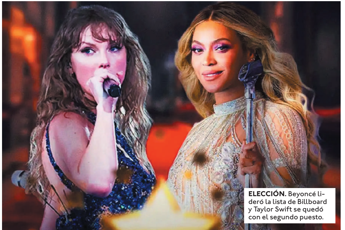
ELECCIÓN. Beyoncé lideró la lista de Billboard y Taylor Swift se quedó con el segundo puesto.

El poder transformador de Beyoncé. Beyoncé ha sido reconoci-