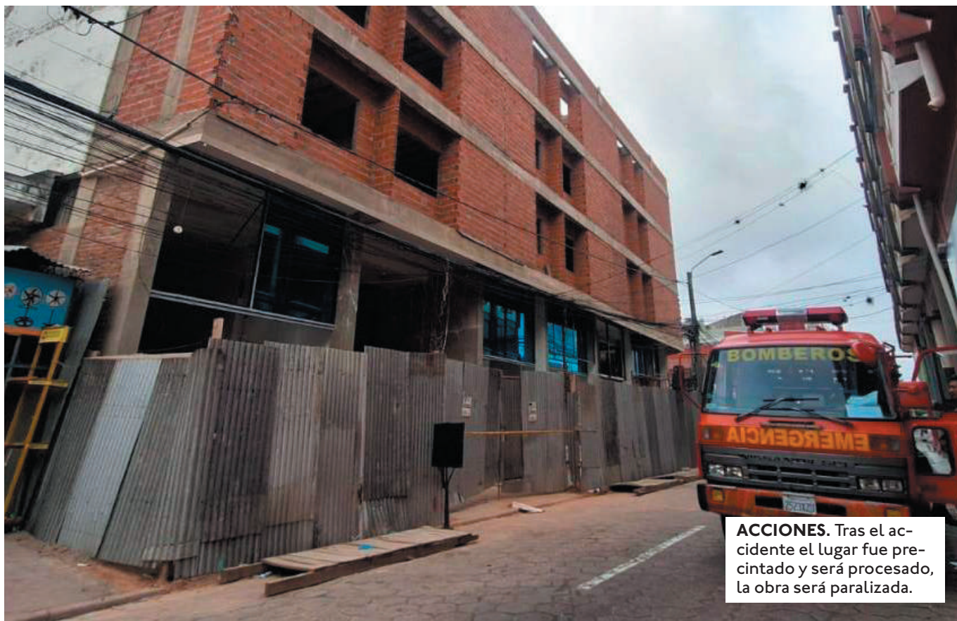
ACCIONES. Tras el accidente el lugar fue precintado y será procesado, la obra será paralizada.