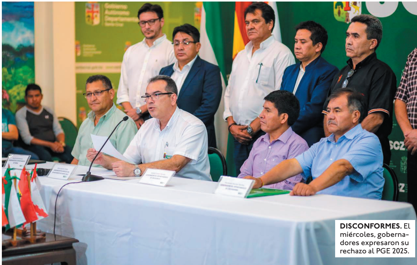
DISCONFORMES. El miércoles, gobernadores expresaron su rechazo al PGE 2025.

EL SENADOR HENRY MONTERO SEÑALÓ QUE LOS MINISTERIOS DE OBRAS PÚBLICAS, GOBIERNO Y DEFENSA MANEJAN UN PRESUPUESTO DE LAS 9 GOBERNACIONES.