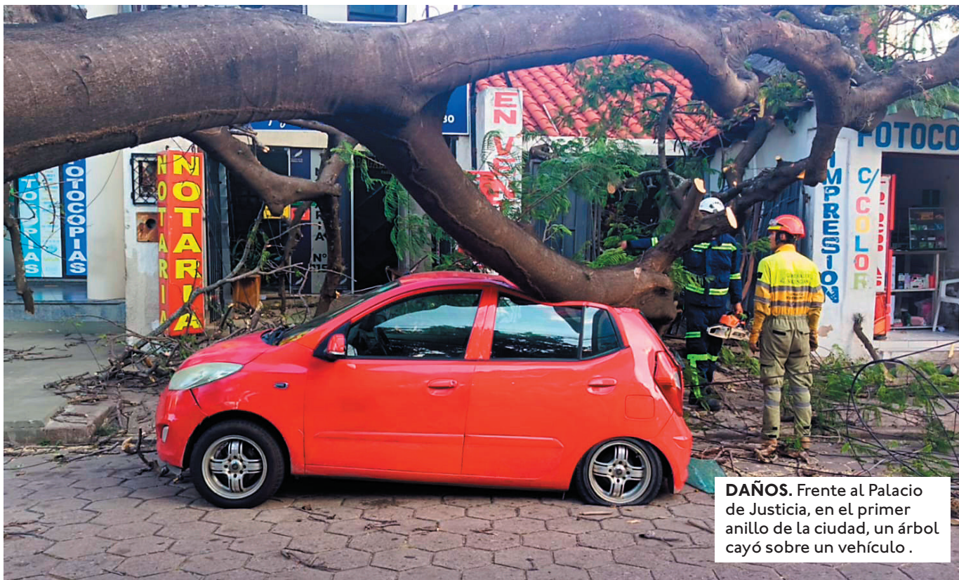
DAÑOS. Frente al Palacio de Justicia, en el primer anillo de la ciudad, un árbol cayó sobre un vehículo.

RECOMIENDAN A LA POBLACIÓN EVITAR ESTACIONARSE BAJO ÁRBOLES FRONDOSOS Y ESTRUCTURAS METÁLICAS VULNERABLES.