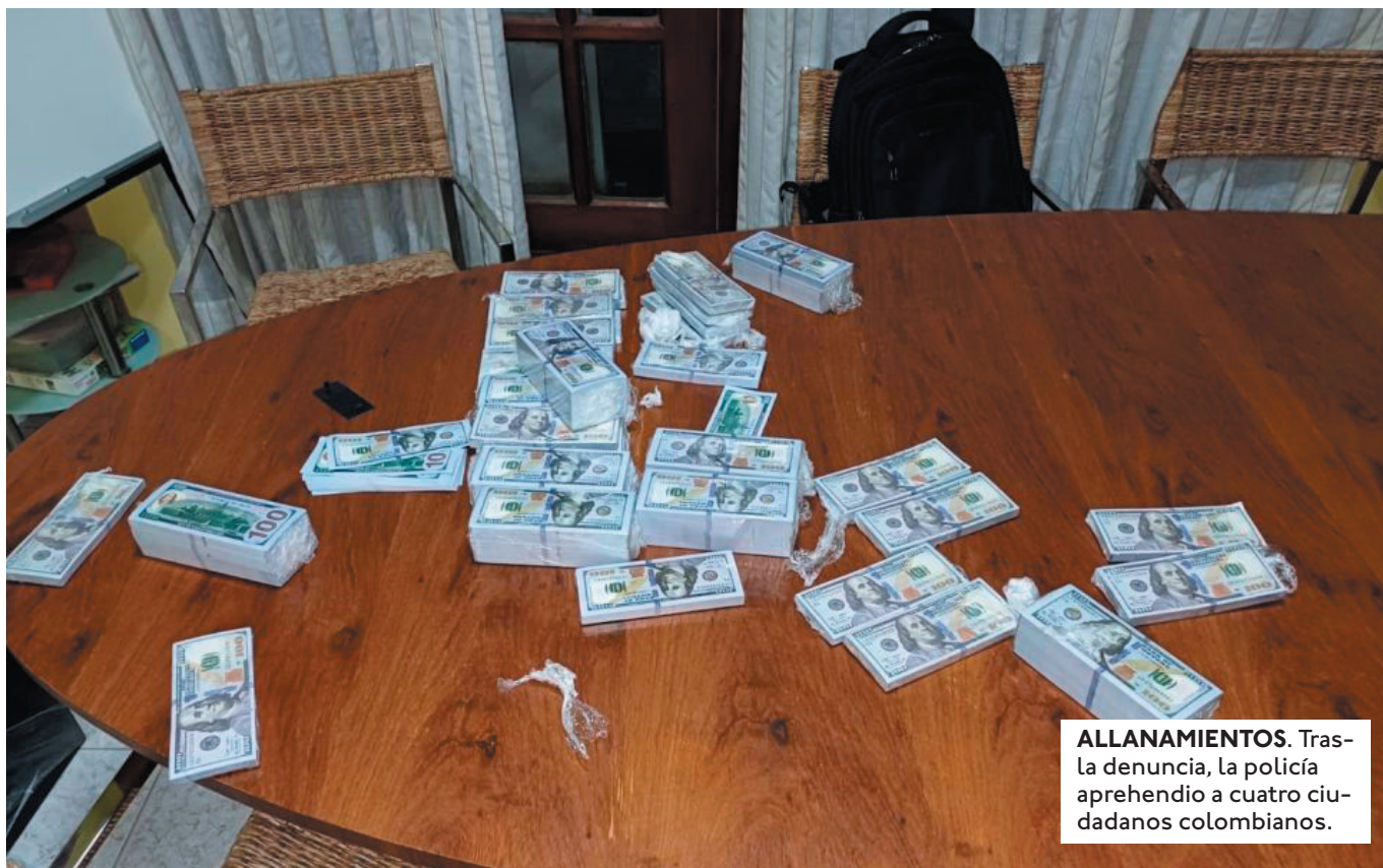
ALLANAMIENTOS. Tras la denuncia, la policía aprehendió a cuatro ciudadanos colombianos.

UNO EN EL QUE OFRECERON UNA CAJA FUERTE CON $US 2 MILLONES PERO CON EL APORTE DE LA CONTRAPARTE DE $US 83 MIL Y BS 340 MIL.