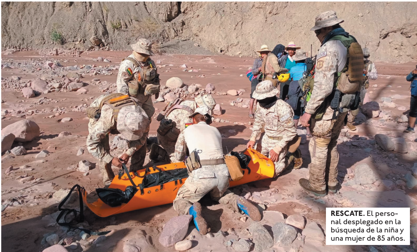
RESCATE. El personal desplegado en la búsqueda de la niña y una mujer de 85 años.

HAY UNAS 300 FAMILIAS Y 117 VIVIENDAS AFECTADAS. EL VICEMINISTRO DE DEFENSA CIVIL INDICÓ QUE SE ANALIZA LA RECONSTRUCCIÓN DE LAS CASAS.