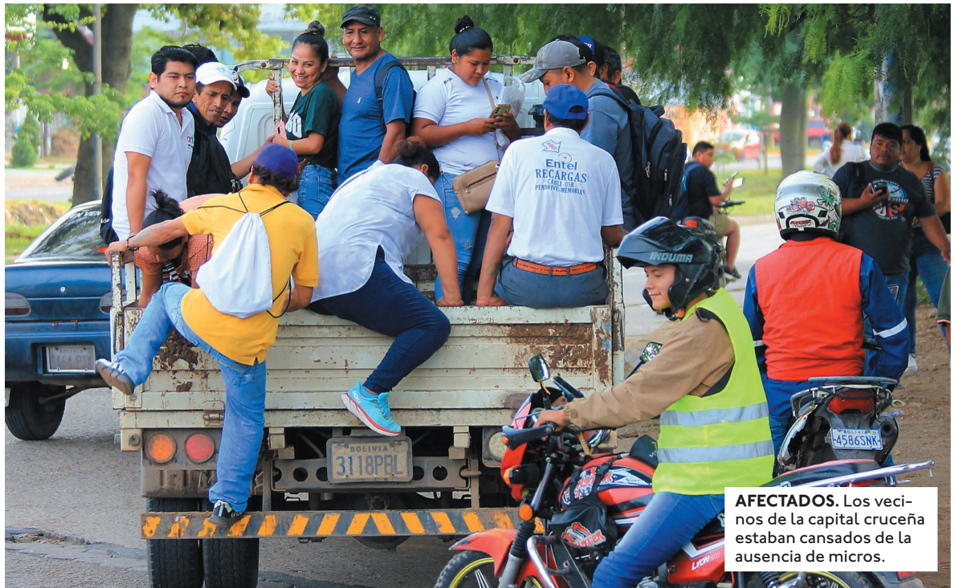
AFECTADOS. Los vecinos de la capital cruceña estaban cansados de la ausencia de micros.

HORAS ANTES, EL ALCALDE HABÍA ADVERTIDO A LAS LÍNEAS CON REVERTIRLES LA LICENCIA DE OPERACIONES, AMPARADO EN LA NORMA QUE ESTABLECE ESTA SANCIÓN SI DEJAN DE TRABAJAR POR TRES DÍAS SEGUIDOS.