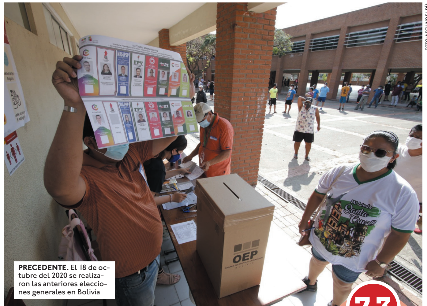
PRECEDENTE. El 18 de octubre del 2020 se realizaron las anteriores elecciones generales en Bolivia

Sin embargo, fuentes del TSE señalaron que no cumplir con todos los requisitos no es necesariamente razón para no estar habilitado para participar en los comicios de 2025 ya que la ley de organizaciones políticas no es totalmente explícita en ese punto. Por ello, la sala plena tendrá