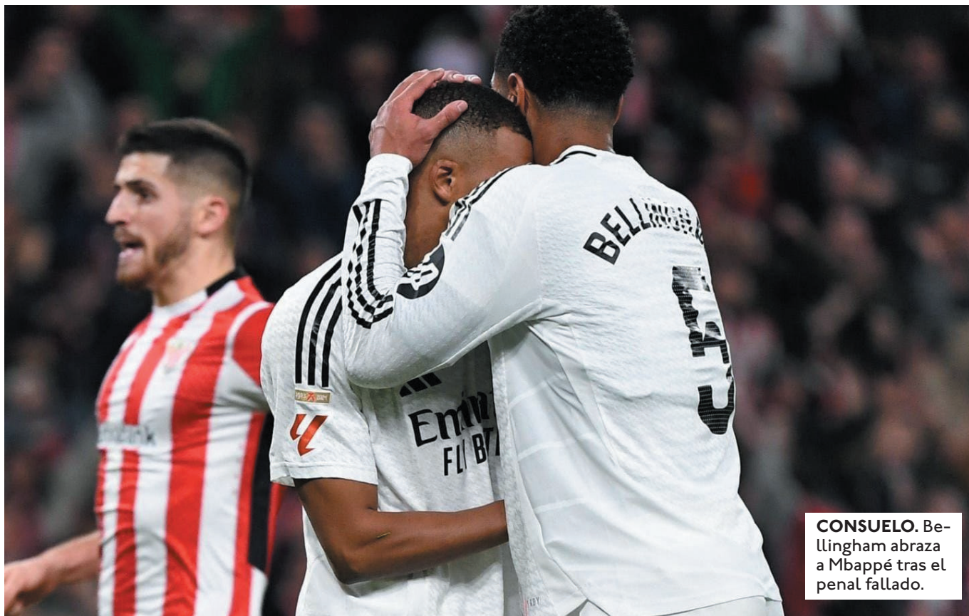
CONSUELO. Bellingham abraza a Mbappé tras el penal fallado.

EL MADRID VISITARÁ AL GIRONA ESTE SÁBADO A PARTIR DE LAS 16:00, HORA BOLIVIANA. MÁS TEMPRANO, EL BARCELONA TAMBIÉN SERÁ VISITANTE, ANTE EL BETIS DESDE LAS 11:15.