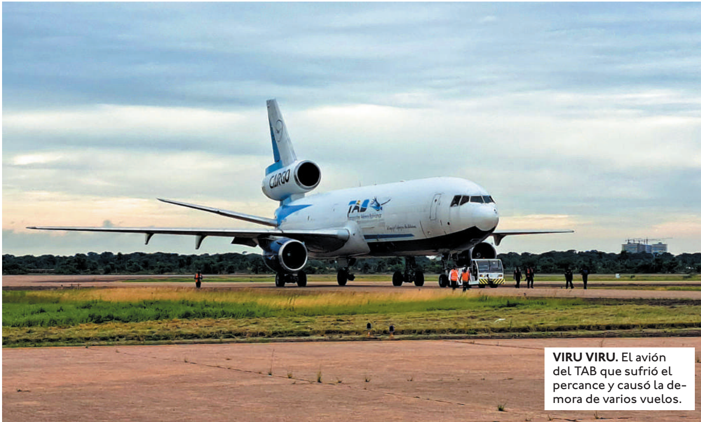
VIRU VIRU. El avión del TAB que sufrió el percance y causó la demora de varios vuelos.

"NI AGUA NOS DAN", DIJO UNA DE LAS PASAJERAS CUYO VUELO HABÍA SIDO REPROGRAMADO VARIAS VECES Y LLEVABA MÁS DE 14 HORAS EN EL AEROPUERTO VIRU VIRU.