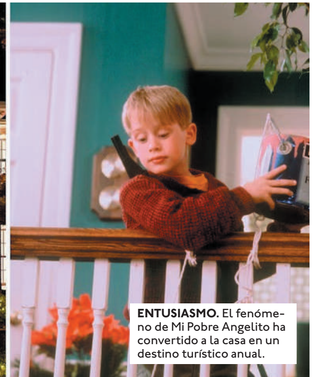
ENTUSIASMO. El fenómeno de Mi Pobre Angelito ha convertido a la casa en un destino turístico anual.