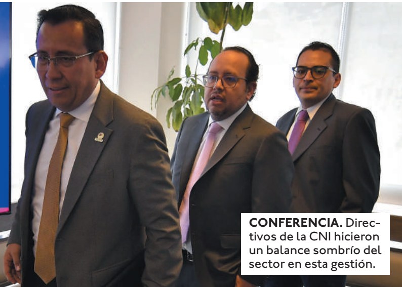
CONFERENCIA. Directivos de la CNI hicieron un balance sombrío del sector en esta gestión.

Bloqueos y divisas, entre las causas. Los bloqueos y la escasez de combustibles contribuyeron a esta situación crítica. Los cortes de vía, en 24