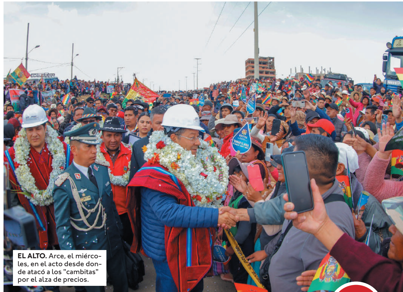
EL ALTO. Arce, el miércoles, en el acto desde donde atacó a los "cambitas" por el alza de precios.

"Santa Cruz cumple con su rol de ser el departamento productor de alimentos que sostiene la seguridad alimentaria para el país. Lo que tiene a Bolivia al borde del desastre es tu incapacidad y la corrupción masista que viene desfalcando las arcas del país hace casi 20 años", agregó Camacho en sus redes sociales, quien exigió al pre-