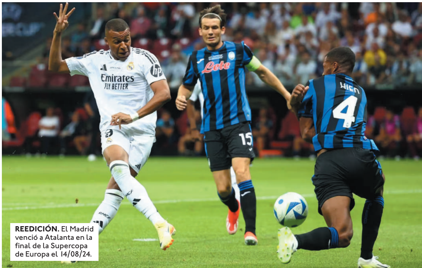
REEDICIÓN. El Madrid venció a Atalanta en la final de la Supercopa de Europa el 14/08/24.

EL LIVERPOOL VISITA AL GIRONA (13:45, HORA BOLI-VIANA), BAYERN MÚNICH ENFRENTA AL SHAKHTAR (16:00), SALZBURGO RECIBE AL PSG (16:00) Y LEVERKUSEN SE MIDA ANTE EL INTER (16:00).