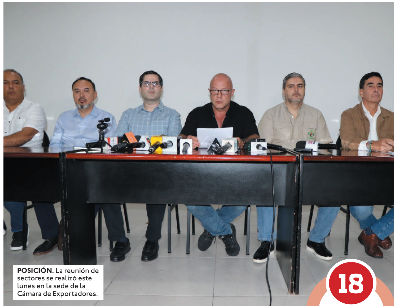
POSICIÓN. La reunión de sectores se realizó este lunes en la sede de la Cámara de Exportadores.

Agregan que en 18 años de gobiernos del MAS la imposición de medidas restrictivas como el veto a las exportaciones, fijación de bandas de precios o imposi-