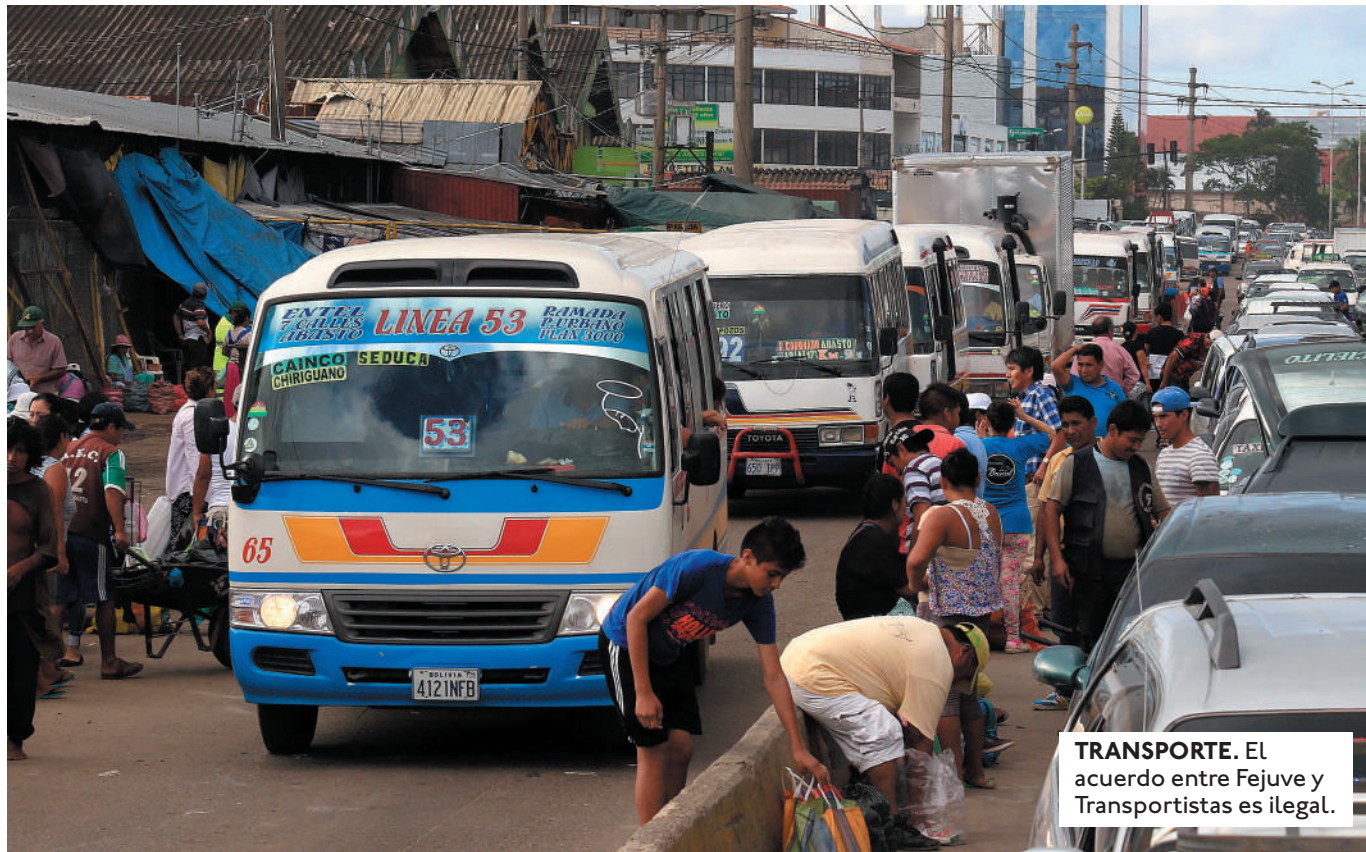
TRANSPORTE. El acuerdo entre Fejuve y Transportistas es ilegal.

SI LOS PASAJEROS PAGABAN CON SUELTO BS 2 SE CONSTATÓ QUE NO LES EXIGEN AUMENTAR, PERO SI PAGAN CON MONEDA MAYOR COBRAN 2.50.