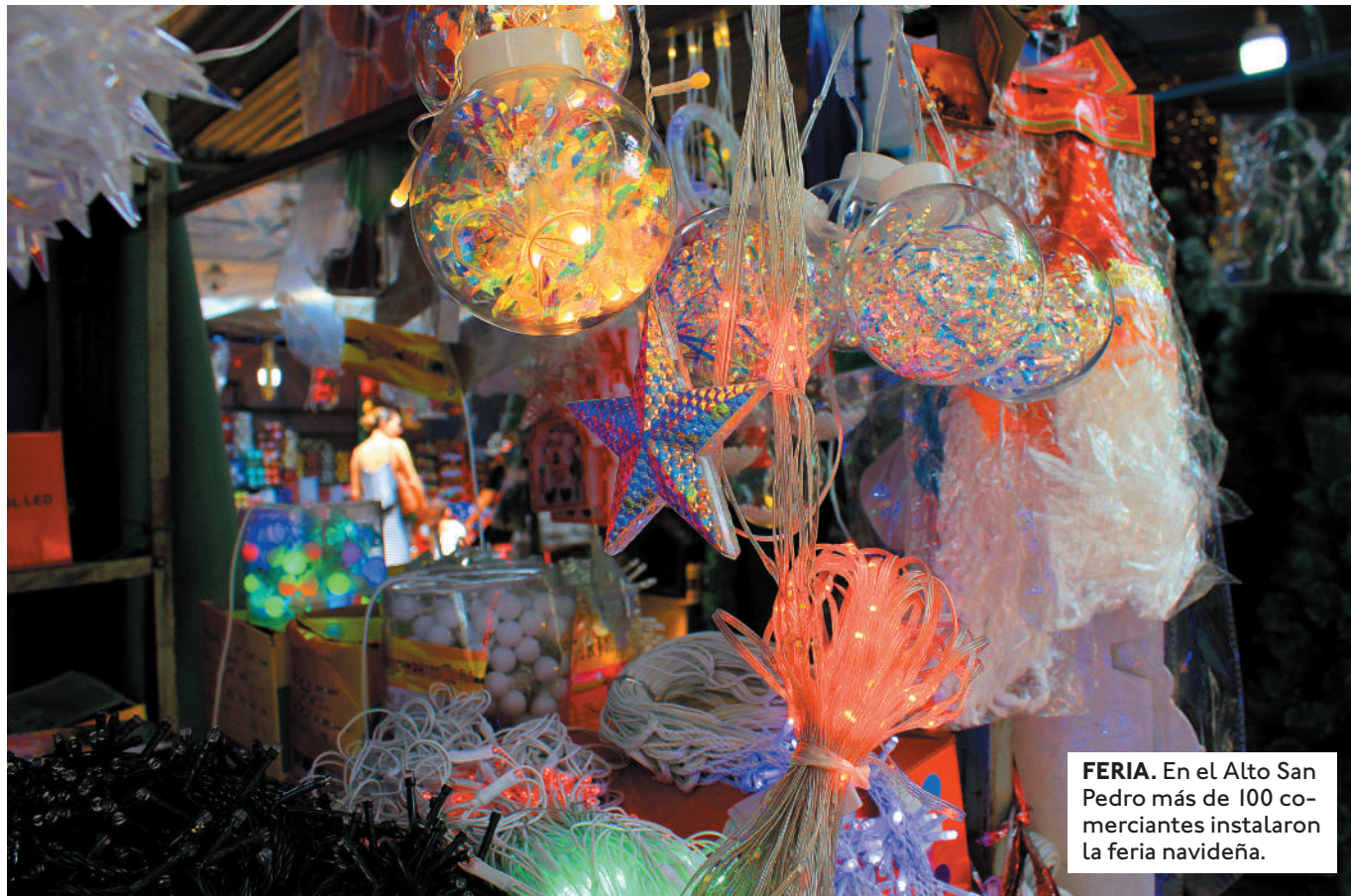
FERIA. En el Alto San Pedro más de 100 comerciantes instalaron la feria navideña.

LOS VENDEDORES DESTACARON QUE TAMBIÉN TIENEN OFERTAS EN PRODUCTOS ELECTRÓNICOS, ROPA, CALZADOS, UTENSILIOS DE COCINA, MUEBLES, ENTRE OTROS.