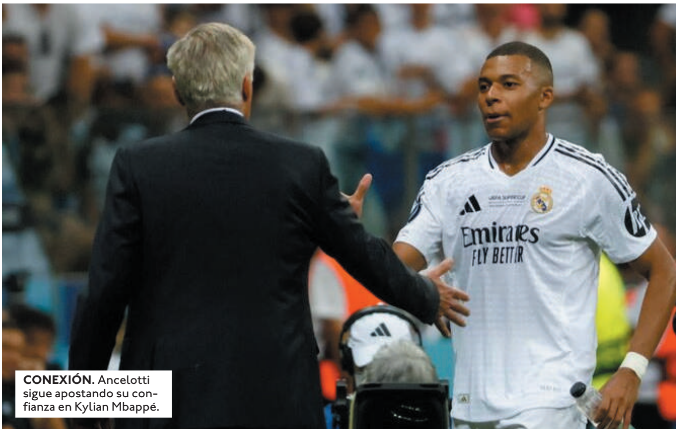
CONEXIÓN. Ancelotti sigue apostando su confianza en Kylian Mbappé.

"KYLIAN MBAPPÉ NO PUDO ACUDIR A LA COMIDA PORQUE ATRAVIESA UN PROCESO GRIPAL" Y ESTO PODRÍA LLEVAR A ALGÚN CONTAGIO, COMUNICARON DESDE EL CLUB.