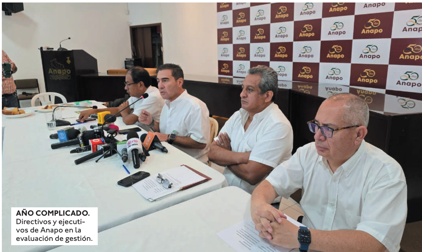
AÑO COMPLICADO. Directivos y ejecutivos de Anapo en la evaluación de gestión.

UNAS 70 MIL HECTÁREAS ESTÁN BAJO AMENAZA DE LOS INVASORES Y EN GUARAYOS UNAS 20 MIL HECTÁREAS PERMANECEN TOMADAS.