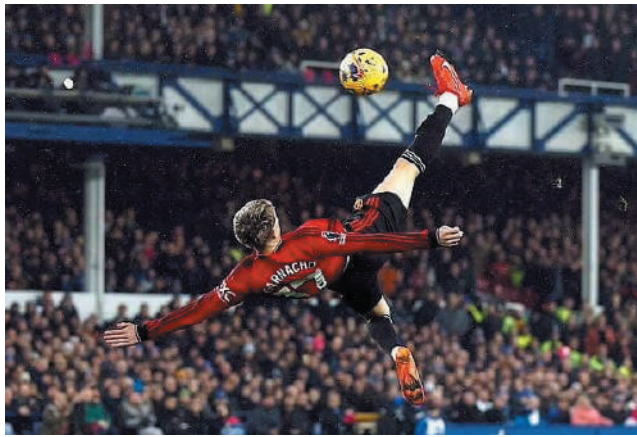
ACROBACIA. Alejandro Garnacho ganó el premio Puskás al mejor gol, con una chilena a Everton.