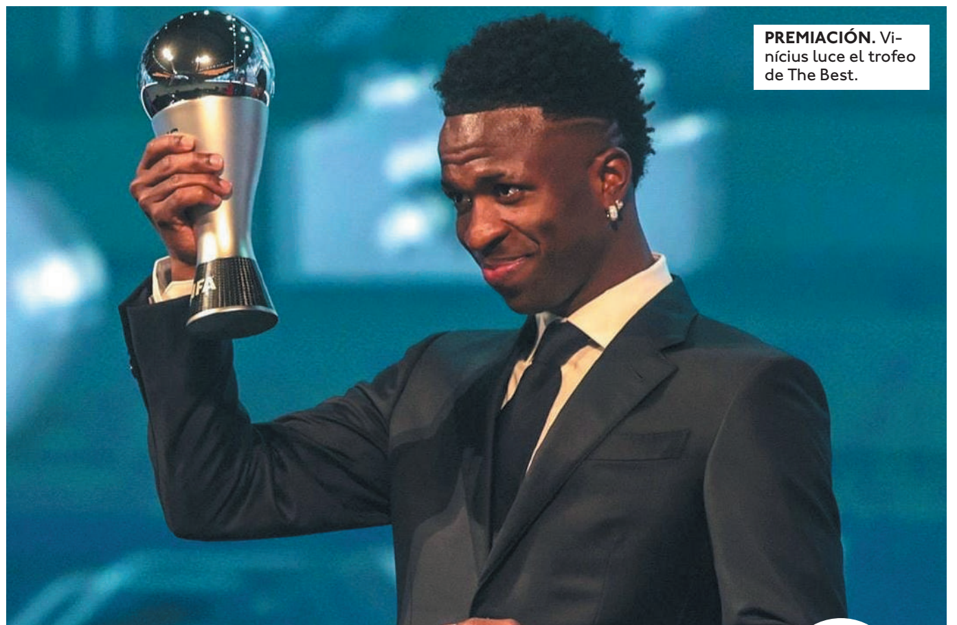
PREMIACIÓN. Vinicius luce el trofeo de The Best.

GALARDÓN. El brasileño quedó por encima de Rodri. También fue reconocido el mejor gol y entrenador, entre otros.