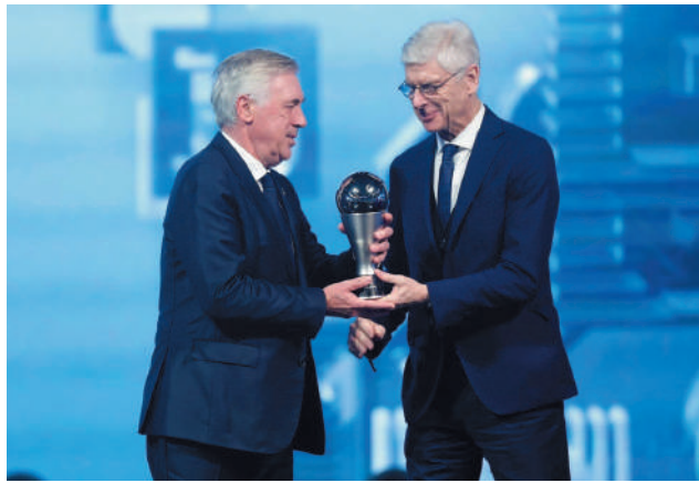
PREMIADO. Carlo Ancelotti, técnico del Madrid, recibió el trofeo como el mejor entrenador en 2024.