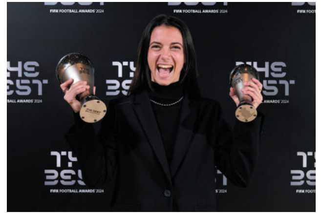
POR DUPLICADO. Aitana Bonmatí ganó el The Best como la mejor jugadora. Hace semanas logró Balón de Oro.