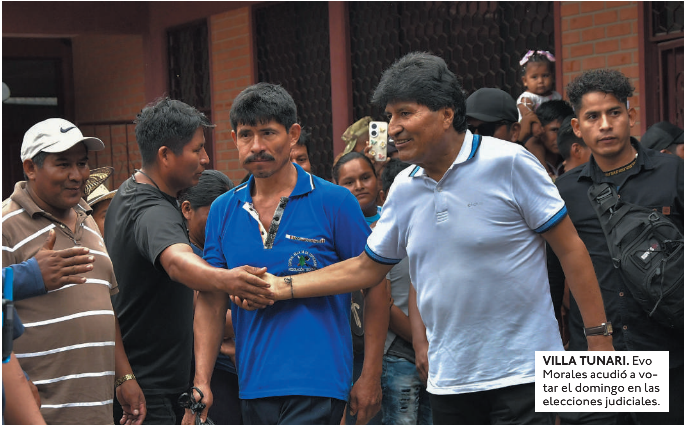
VILLA TUNARI. Evo Morales acudió a votar el domingo en las elecciones judiciales.

EVO MORALES PARTICIPÓ AYER DE UN ENCUENTRO DE LAS BARTOLINAS DONDE SEÑALÓ QUE POSTULARÁ EL 2025 CON SIGLA PRES-TADA.