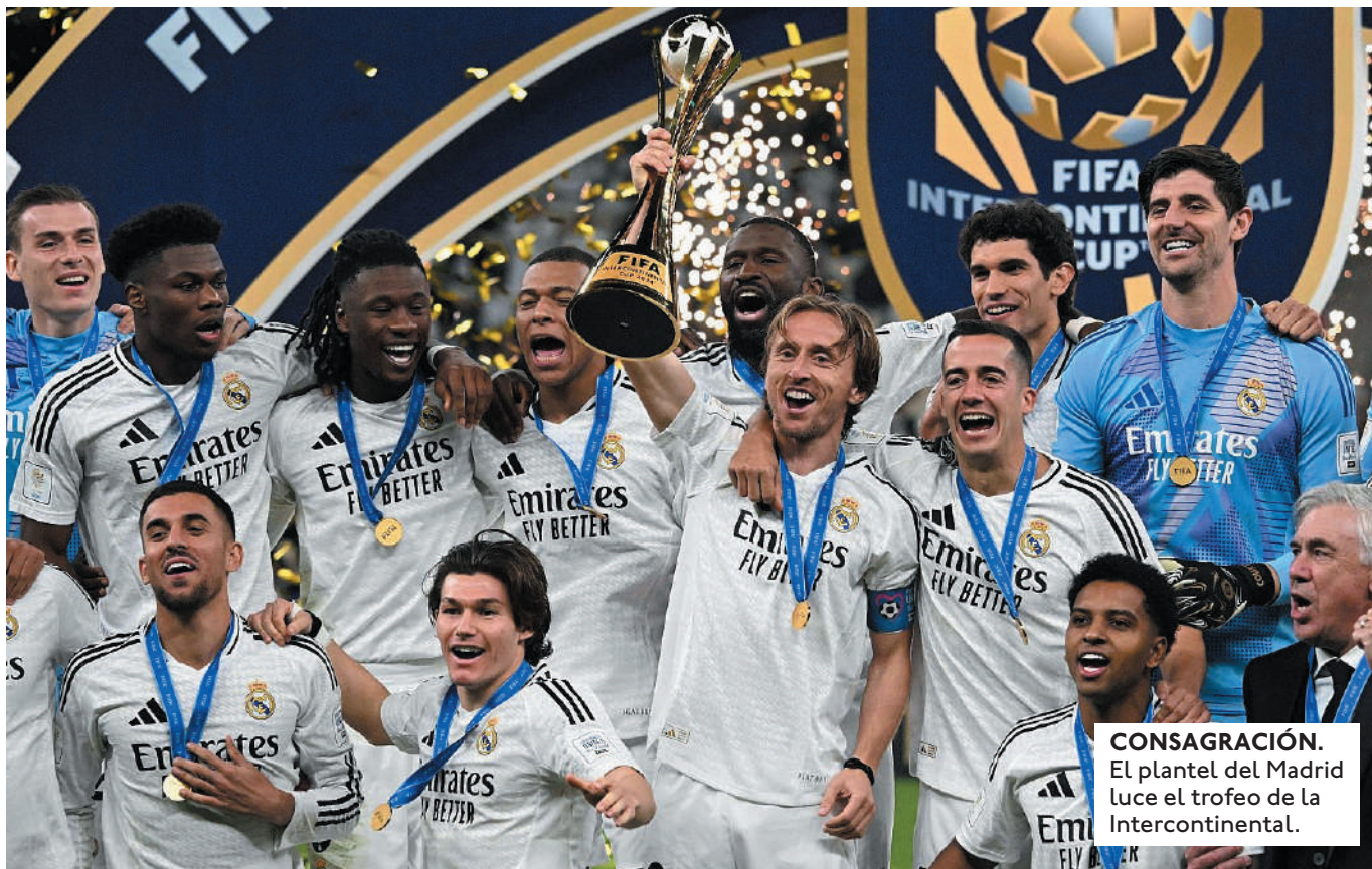
CONSAGRACIÓN. El plantel del Madrid luce el trofeo de la Intercontinental.

EL ENTRENADOR ITALIANO SE HA CONVERTIDO EN EL TÉCNICO CON MÁS TÍTULOS EN LA HISTORIA DEL CLUB BLANCO, CON UN TOTAL DE 15 TROFEOS, SUPERÓ A MIGUEL MUÑOZ QUIEN TIENE 14.