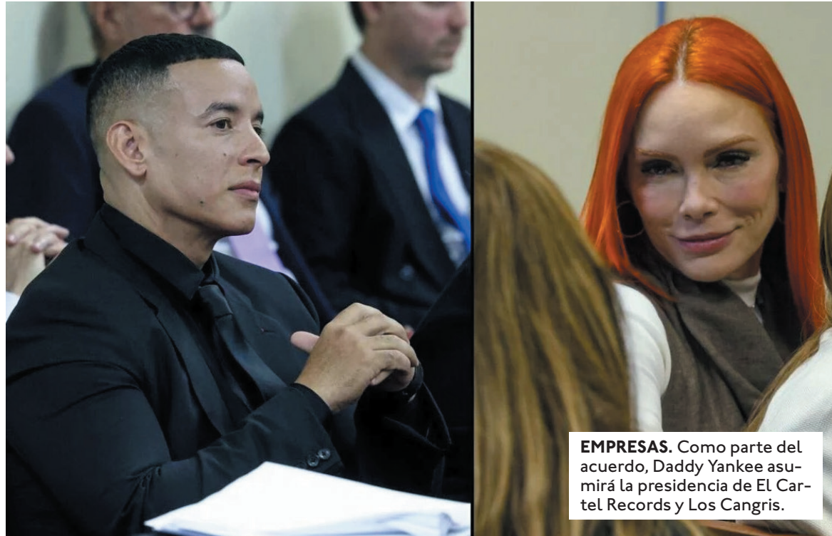
EMPRESAS. Como parte del acuerdo, Daddy Yankee asumirá la presidencia de El Cartel Records y Los Cangris.