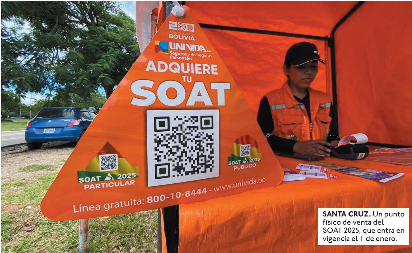
SANTA CRUZ. Un punto físico de venta del SOAT 2025, que entra en vigencia el 1 de enero.

EL 87% OCURRE EN ZONAS URBANAS. LAS COLISIONES SON LAS MÁS COMUNES CON EL 51% Y LOS ATROPELLADOS REPRESENTAN EL 27%.