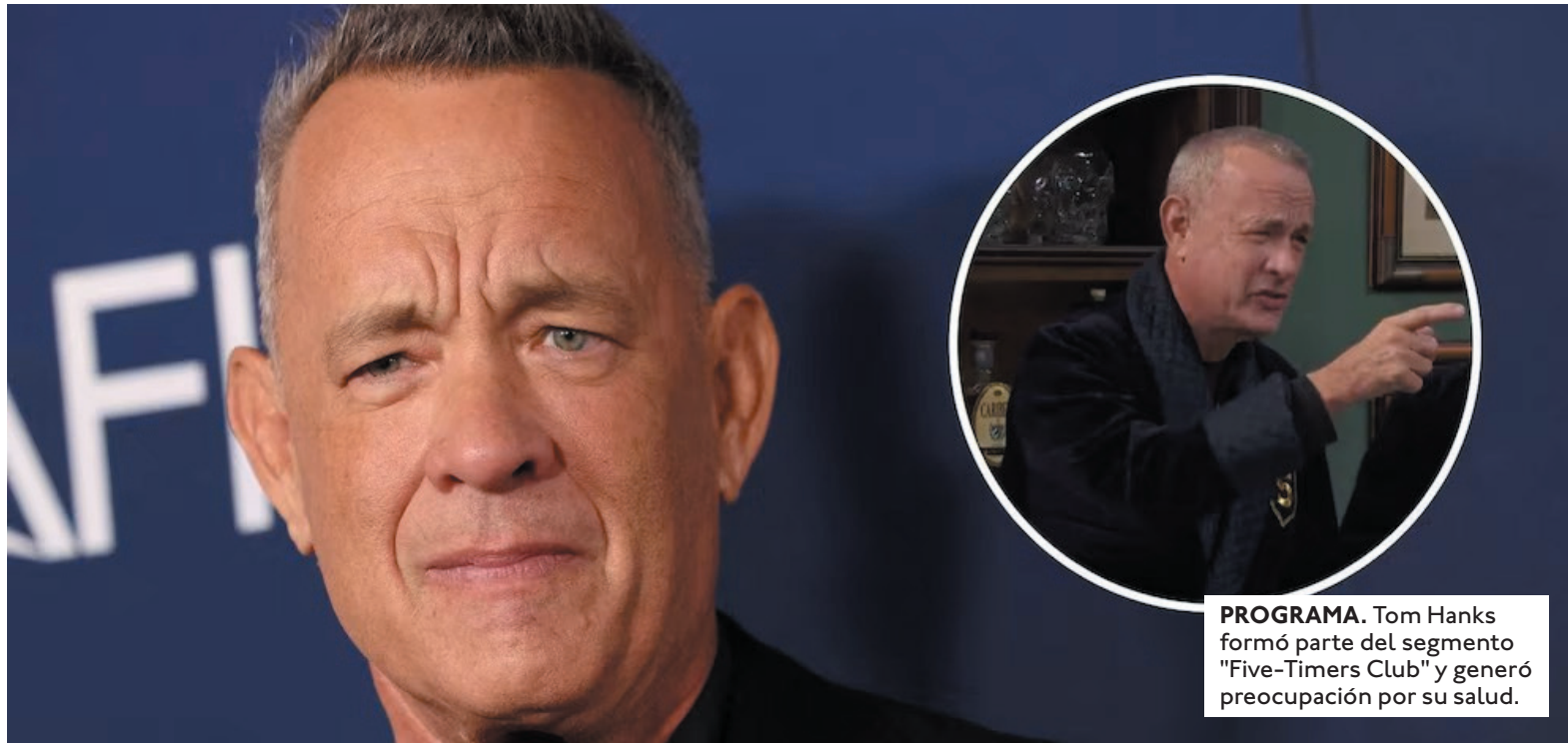
PROGRAMA. Tom Hanks formó parte del segmento "Five-Timers Club" y generó preocupación por su salud.

ACTOR. El intérprete de 68 años volvió a ser tema de conversación después de una aparición que desencadenó comentarios sobre su salud.