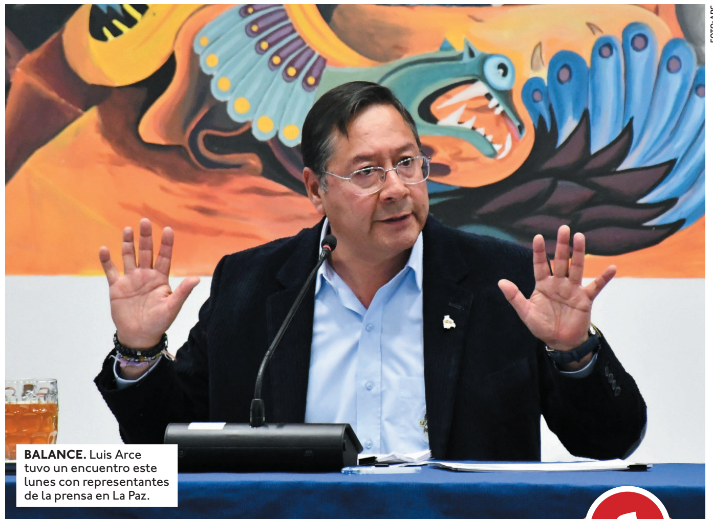
BALANCE. Luis Arce tuvo un encuentro este lunes con representantes de la prensa en La Paz.

Este lunes, Arce reveló que, durante la campaña electoral de 2020,