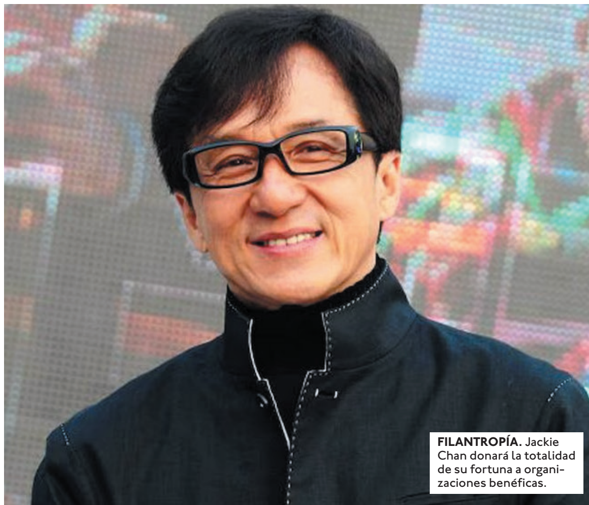
FILANTROPÍA. Jackie Chan donará la totalidad de su fortuna a organizaciones benéficas.

Por qué Jackie Chan donará todo su dinero a la caridad. La filantropía no es un interés reciente para Jackie Chan; ha sido una constante en su vida. El actor considera que su fortuna puede generar un impacto positivo mucho