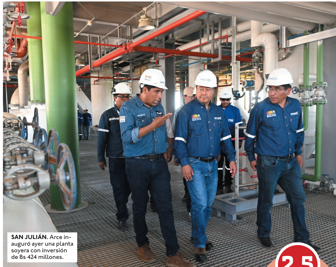
SAN JULIÁN. Arce inauguró ayer una planta soyera con inversión de Bs 424 millones.

"Es momento de aplicar un modelo pensando en el país y en la población, para contrarrestar el deterioro de la economía en el corto plazo y además sentar bases para un mayor crecimiento económico, desarrollo y bienestar para las familias