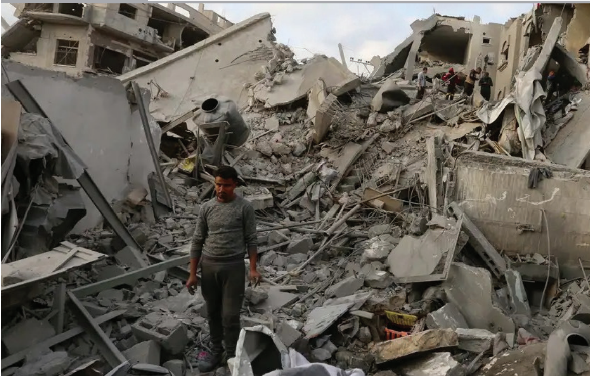
PALESTINA. Una estación de televisión palestina afiliada a la Yihad Islámica anunció este jueves la muerte de cinco de sus periodistas, cuando su vehículo de transmisión fue impactado por un misil del ejército de Israel en la Franja de Gaza.