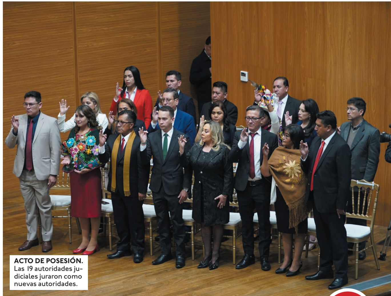
ACTO DE POSESIÓN. Las 19 autoridades judiciales juraron como nuevas autoridades.

El pedido de Arce. "Exhortamos a las nuevas autoridades a ejercer su imparcialidad, ética, con moral y pleno apego a las leyes y a la Constitución Política del Estado", sostuvo Arce en su discurso que duró cerca de nueve minutos. El Mandatario señaló que las au-