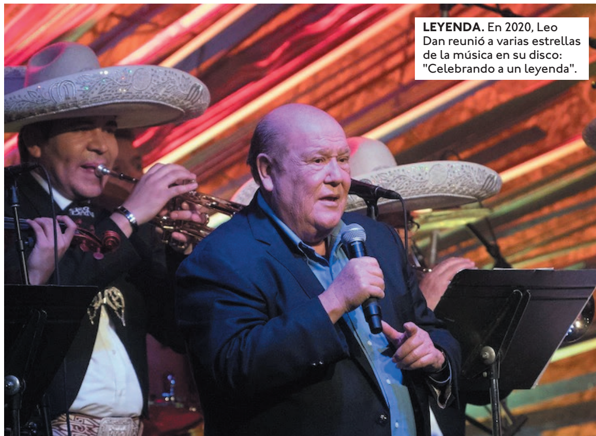
LEYENDA. En 2020, Leo Dan reunió a varias estrellas de la música en su disco: "Celebrando a un leyenda".

Otra cantante que rindió un homenaje a Leo Dan en redes sociales fue Ana Bárbara quien, con una historia en la que la vemos