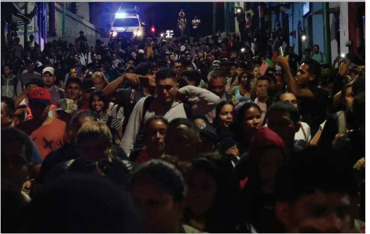
INMIGRANTES. La primera caravana migrante del año 2025 partió el jueves de la frontera sur de México, con cerca de 1.500 integrantes. La mayoría de ellos procede de Venezuela, pero también hay también de Guatemala, El Salvador, Perú y Ecuador.