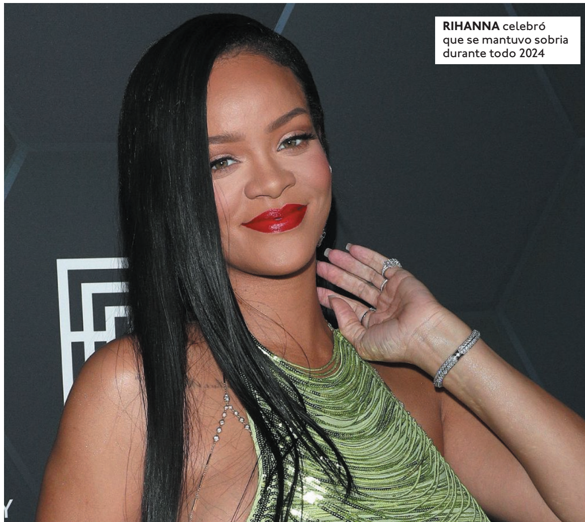
RIHANNA celebró que se mantuvo sobria durante todo 2024

El post que ya acumula más de 2 millones de "me gusta" se llenó de comentarios positivos de los fans y amigos de la cantante: "Tan orgullosa de ti riri", escribió un usuario. Sin embargo, hubo otras personas que en lugar de felicitarla le cuestionaron cuando lanzaría nueva música porque esperan con ansias un disco nuevo de ella: "¿Nuevo yo? Solo si es con disco nuevo, si no, no lo quiero", redactó un fan. De hecho, el medio The Sun afirmó que una fuente le dijo que Rihanna ha trabajado en el estudio con varios temas, los cua-