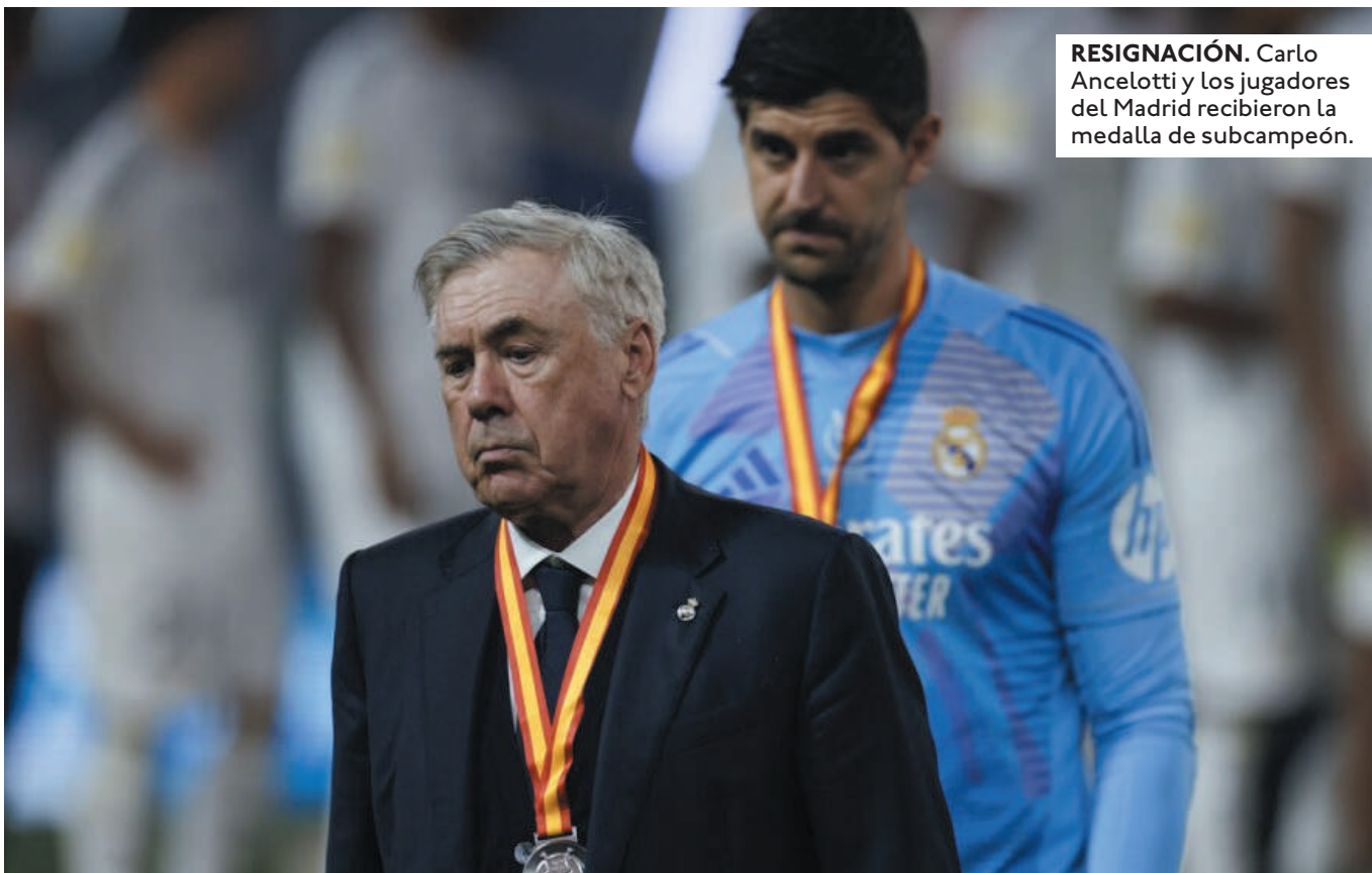
RESIGNACIÓN. Carlo Ancelotti y los jugadores del Madrid recibieron la medalla de subcampeón.

EL BARCELONA VISITARÁ AL GETAFE EL PRÓXIMO SÁBADO (16:00) POR LA FECHA 20 DE LALIGA. AL SIGUIENTE DÍA, EL REAL MADRID RECIBE A LAS PALMAS (11:15 HB).