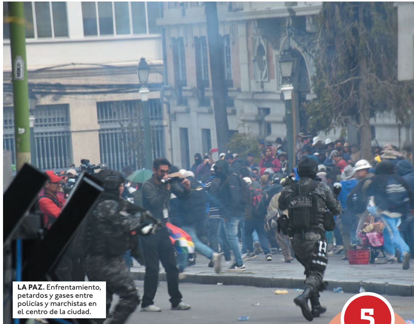
LA PAZ. Enfrentamiento, petardos y gases entre policías y marchistas en el centro de la ciudad.

Pasadas las 14:00 se produjo un enfrentamiento con la Policía, que los gasificó cuando intentaban ingresar a Plaza Murillo. Imágenes difundidas por la agencia APG mostraron a algunas personas que fueron arrestadas durante los enfrentamientos. "Han empezado a lanzar piedras, han empe-