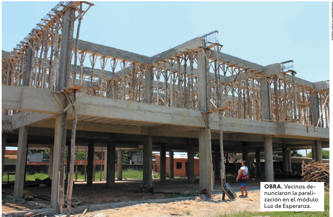
OBRA. Vecinos denunciaron la paralización en el módulo Luz de Esperanza.

CERRAR EMPRESAS PÚBLICAS MUNICIPALES COMO EMACRUZ Y EL MATADERO. TRANSFERIR EL ZOOLOGICO Y EL JARDÍN BOTÁNICO Y CONCESIONAR EL SERVICIO DE ALUMBRADO PÚBLICO.