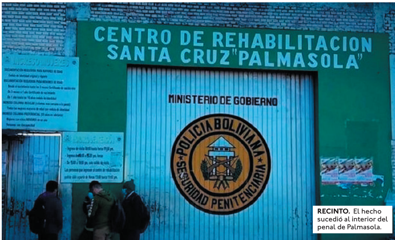
RECINTO. El hecho sucedió al interior del penal de Palmasola.

AUTOPSIA CONFIRMÓ QUE EL SUJETO ESTRANGLÓ A LA MUJER Y LUEGO SE QUITÓ. NINGÚN FAMILIAR HABÍA APARECIDO A RECLAMAR LOS CUERPOS DE AMBOS.