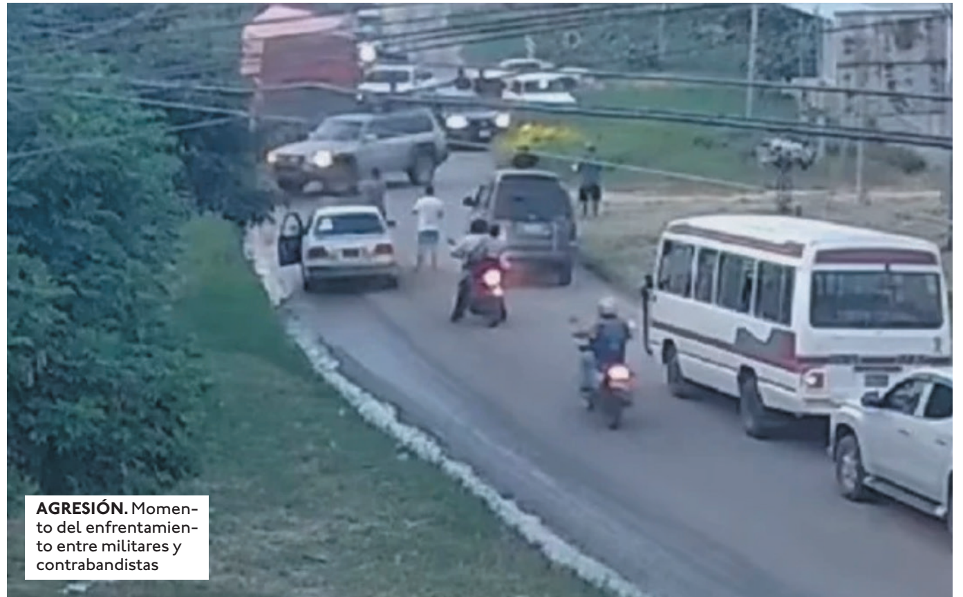
AGRESIÓN. Momento del enfrentamiento entre militares y contrabandistas

EL CAMIÓN NO DETUVO SU MARCHA E INCLUSO RASPÓ A DOS VEHÍCULOS PARTICULARES QUE ESTABAN CIRCULANDO POR EL LUGAR.