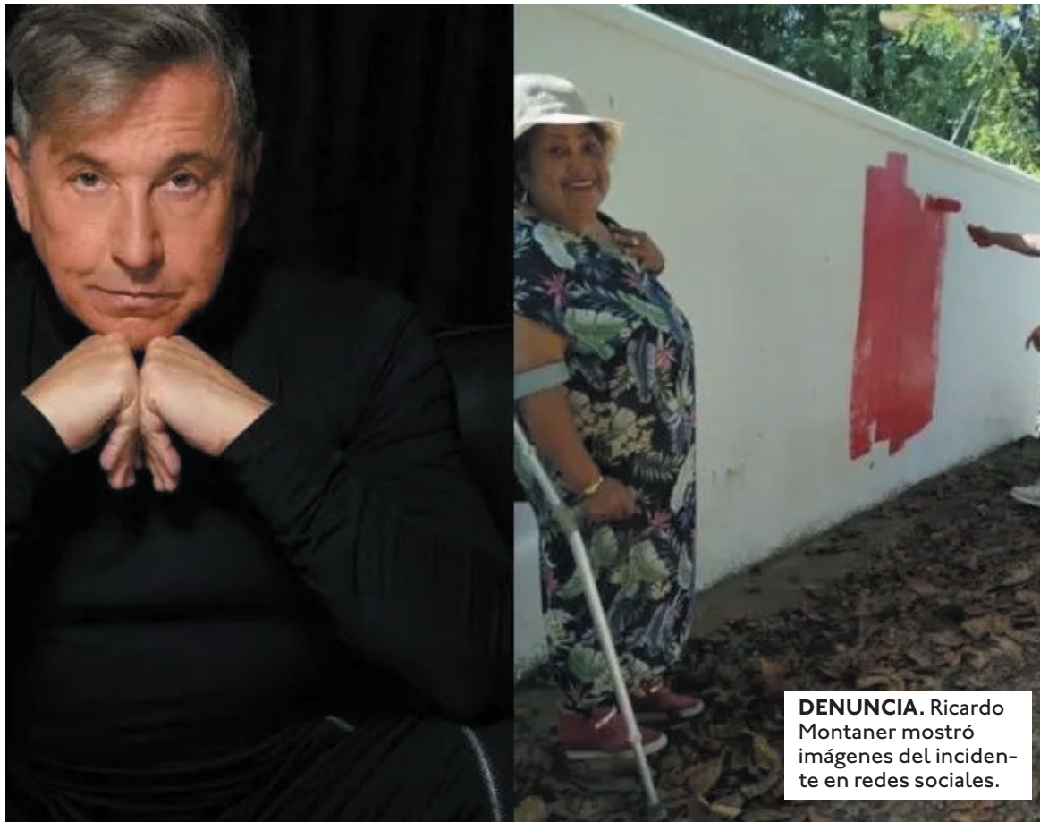
DENUNCIA. Ricardo Montaner mostró imágenes del incidente en redes sociales.

Horas más tarde, el intérprete compartió una imagen que muestra la barda nuevamente restaurada y pintada de blanco. Con un mensaje esperanzador, escribió: "Aquí no ha pasado nada #Samaná", acompañado de un corazón rojo, dejando claro su compromiso con la tranquilidad y la belleza de su hogar en el país caribeño.