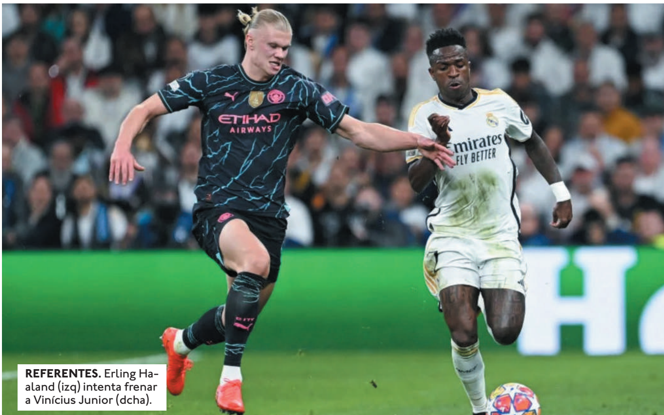
REFERENTES. Erling Haaland (izq) intenta frenar a Vinícius Junior (dcha).

EL BREST SERÁ LOCAL ANTE EL PARÍS SAINT GERMAIN DESDE LAS 13:45, HORA BOLIVIANA. MÁS TARDE, DESDE LAS 16:00, JUVEN-TUS-PSV Y EL SPORTING CP-DORTMUND.