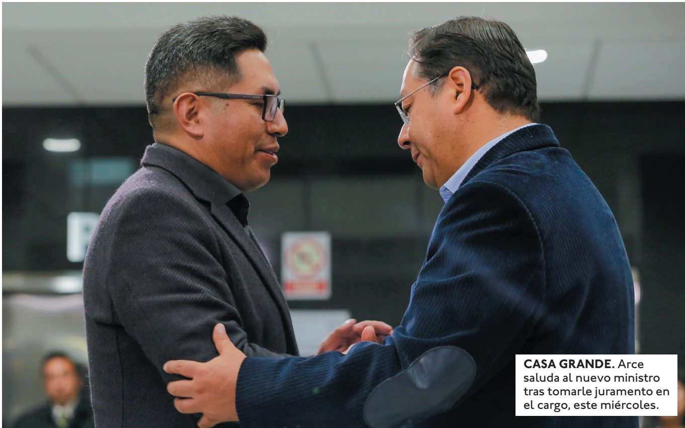
CASA GRANDE. Arce saluda al nuevo ministro tras tomarle juramento en el cargo, este miércoles.

KLAUS FRERKING SEÑALA QUE EL CAMBIO DE AUTORIDADES NO ES SUFICIENTE, SINO DAR UN GIRO EN LAS POLÍTICAS RESTRICTIVAS Y SOLUCIONAR LA FALTA DE COMBUSTIBLES Y DÓLARES.