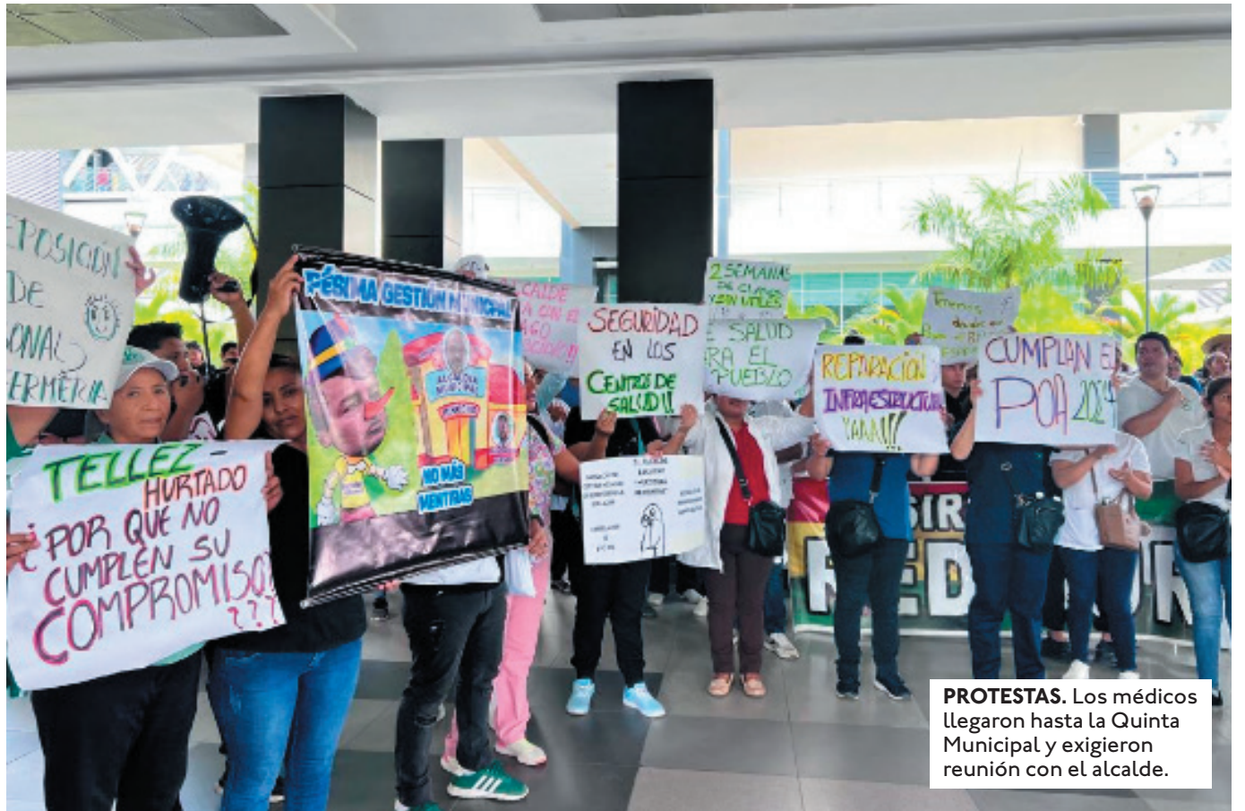
PROTESTAS. Los médicos llegaron hasta la Quinta Municipal y exigieron reunión con el alcalde.