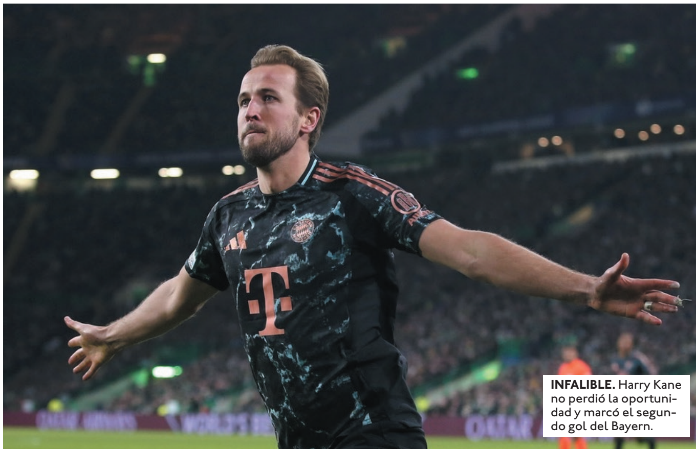
INFALIBLE. Harry Kane no perdió la oportunidad y marcó el segundo gol del Bayern.

EL BRUJAS DE BÉLGICA HIZO RESPETAR SU LOCALÍA AL IMPONERSE POR 2-1 SOBRE EL ATALANTA ITALIANO. MIENTRAS QUE EL BENFICA VENCió AL MÓNACO DE VISITANTE (0-1).