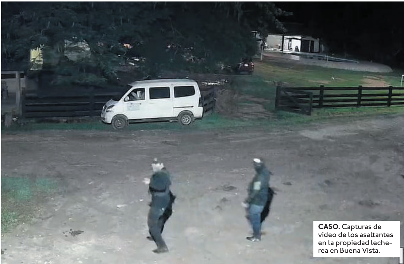
CASO. Capturas de video de los asaltantes en la propiedad lechera en Buena Vista.

"HAY QUE FRENAR ESTO PORQUE HOY ME PASÓ A MÍ, MAÑANA PUEDE PASARLE A CUALQUIERA. ESTAMOS MUY ASUSTADOS" IREVELÓ UNA VÍCTIMA.