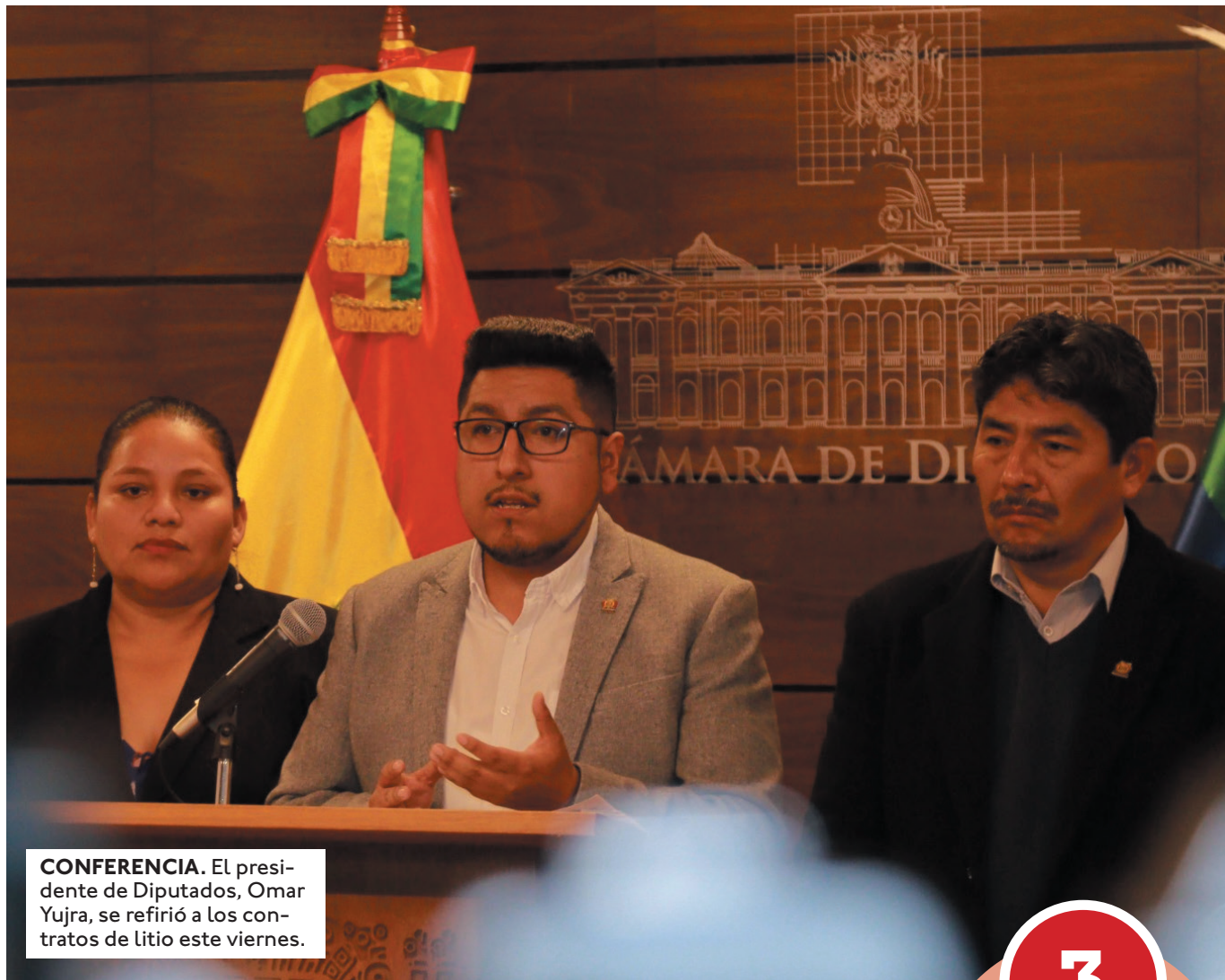
CONFERENCIA. El presidente de Diputados, Omar Yujra, se refirió a los contratos de litio este viernes.

“El primer (contrato) ha ingresado el 7 de octubre del año 2024 y el segundo ingresó el 10 de diciembre del año 2024. Fíjense cómo ha ido evolucionando es-