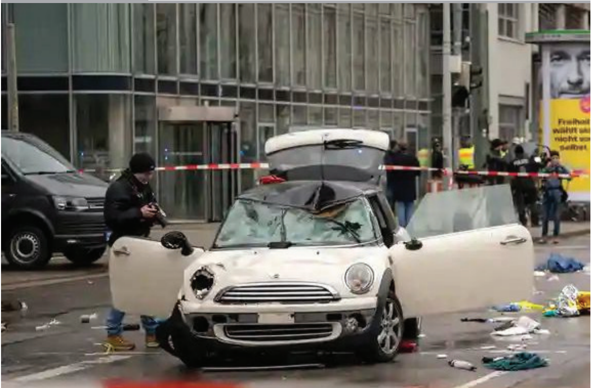
ALEMANIA. El autor de un atropello masivo en Múnich que dejó al menos 36 heridos tenía una "orientación islamista" y una "motivación religiosa", indicaron las autoridades alemanas este viernes (14.02.2025).