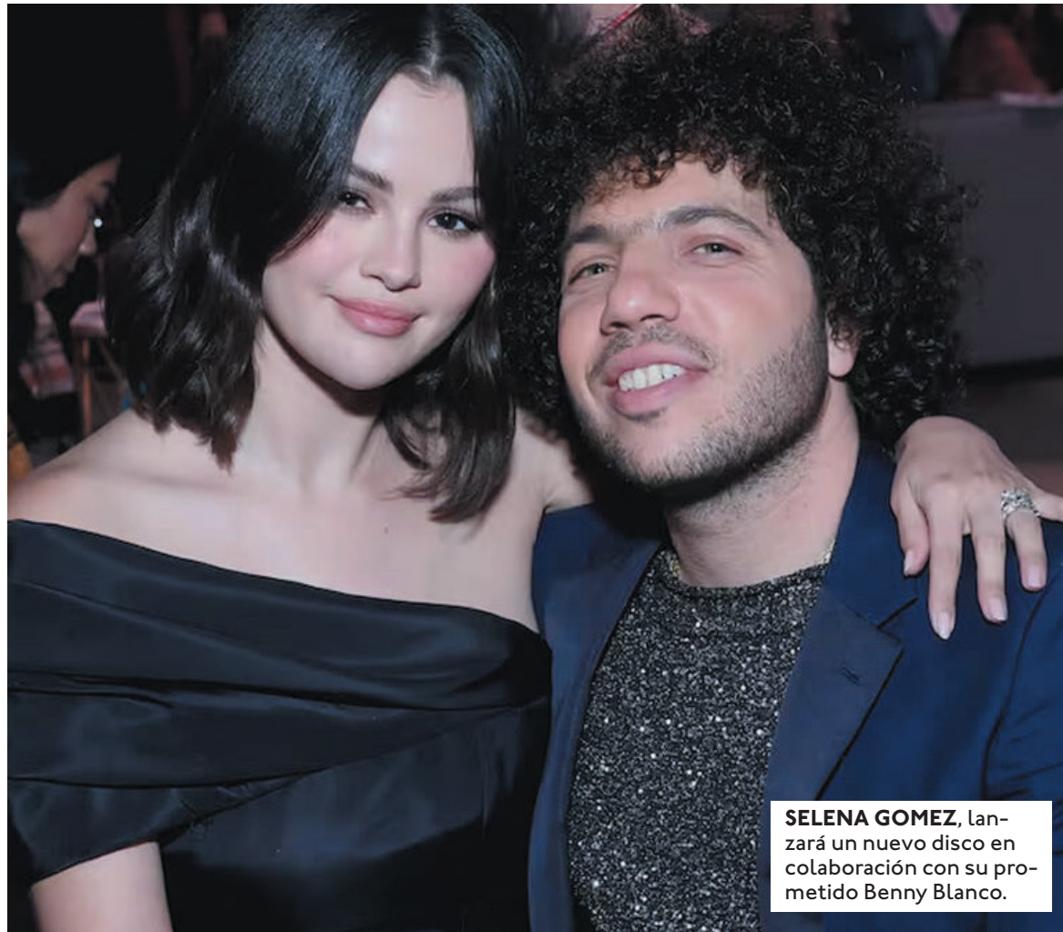
SELENA GOMEZ , lanzará un nuevo disco en colaboración con su prometido Benny Blanco.

Coincidiendo con la celebración de San Valentín, Selena Gomez y Benny Blanco también han lanzado el primer sencillo del álbum, el cual lleva por nombre "Scared