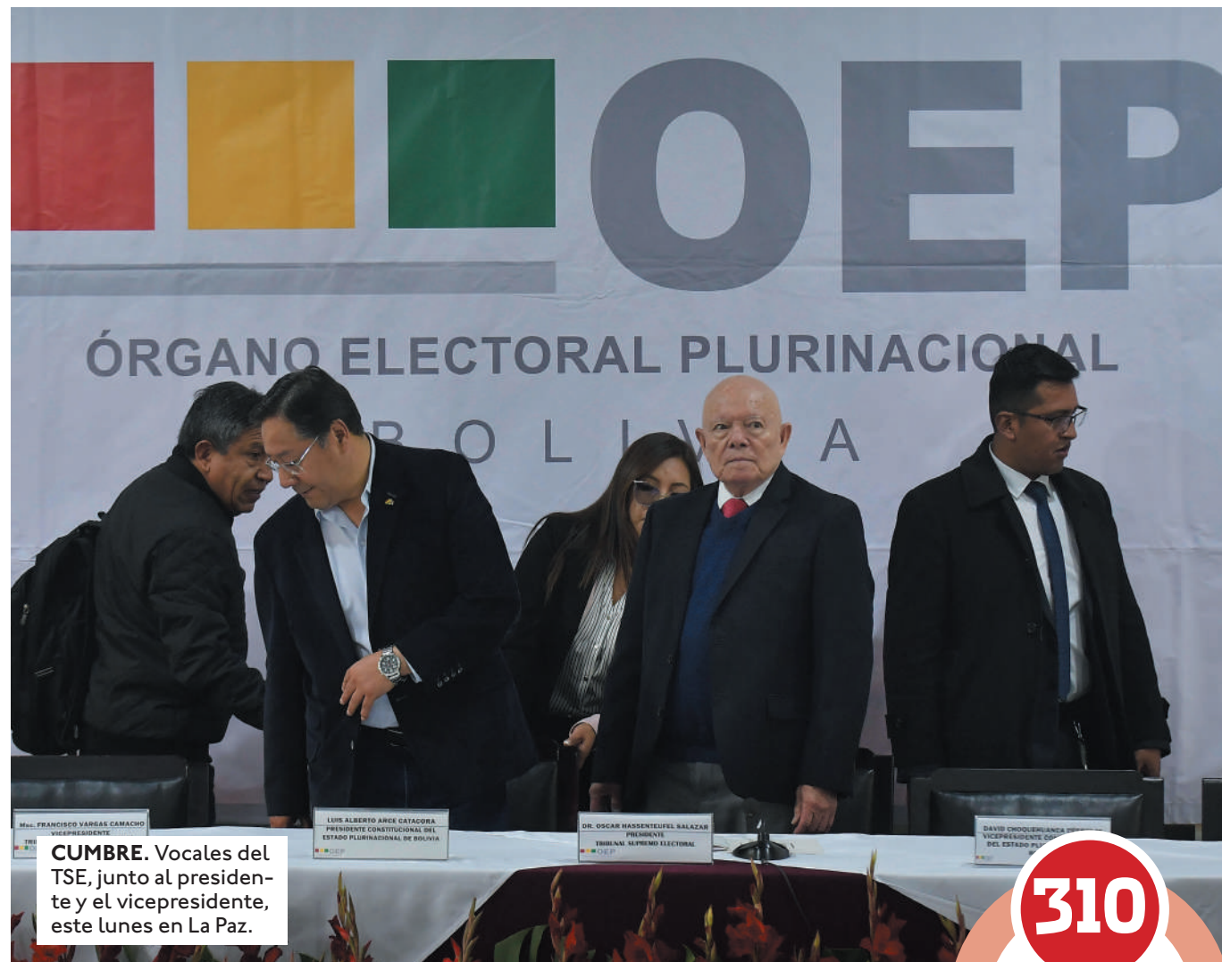
CUMBRE. Vocales del TSE, junto al presidente y el vicepresidente, este lunes en La Paz.

Tema clave. Respeto al tema del TREP, que es uno de los puntos relevantes que plantearon líderes de la oposición al ingresar a la reunión, si bien hay unanimidad entre los que asistieron al encuentro en la idea de que debe estar vigente en el proceso electoral, no ha-