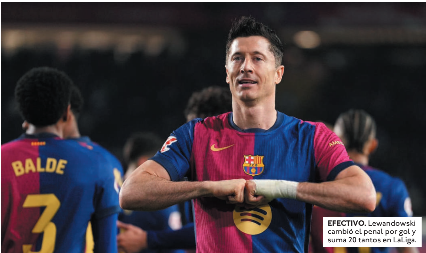
EFECTIVO. Lewandowski cambió el penal por gol y suma 20 tantos en LaLiga.

ESTE SÁBADO 22 DE FEBRERO, EL BARCELONA SERÁ VISITANTE ANTE LA PALMAS DESDE LAS 16:00, HORA BOLIVIANA. AL SIGUIENTE DÍA, REAL MADRID SERÁ LOCAL ANTE GIRONA (11:15).