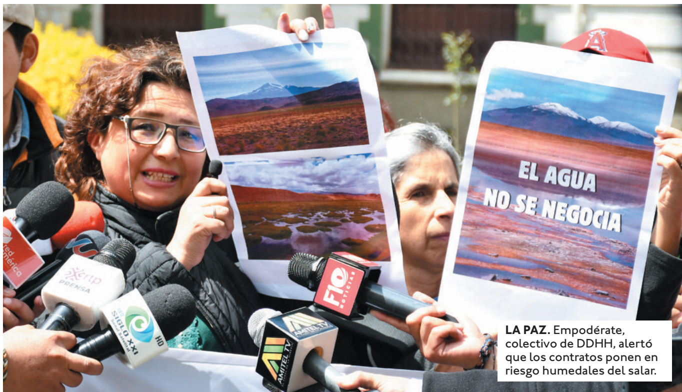
LA PAZ. Empodérate, colectivo de DDHH, alertó que los contratos ponen en riesgo humedales del salar.