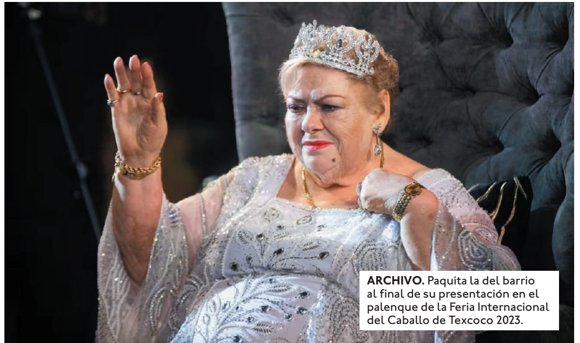
Paquita la del Barrio al final de su presentación en el palenque de La Feria Internacional del Caballo de Texcoco 2023.

"Este inútil que fue tu amigo, te va a extrañar. Porque fuiste raza de uno y un chispazo de autenticidad entre tanta falsedad. Le harás