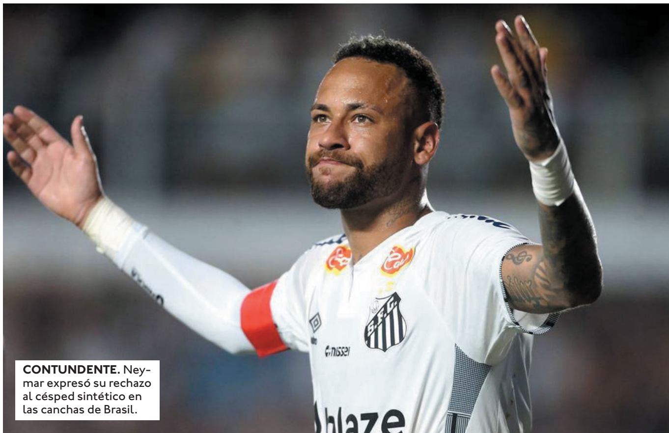
CONTUNDENTE. Neymar expresó su rechazo al césped sintético en las canchas de Brasil.

"EN LAS LIGAS MÁS RESPECTADAS DEL MUNDO SE REALIZAN INVERSIONES PARA ASEGURAR LA CALIDAD DEL TERRENO DE JUEGO EN LOS ESTADIOS. SE TRATA DE OFRECER CALIDAD A QUIENES JUEGAN Y MIRAN", COMPARÓ.