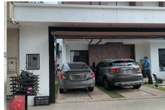
CÁMARAS. Fotografías revelaron varios impactos de bala en las puertas y vidrios laterales de la vagoneta de la víctima.