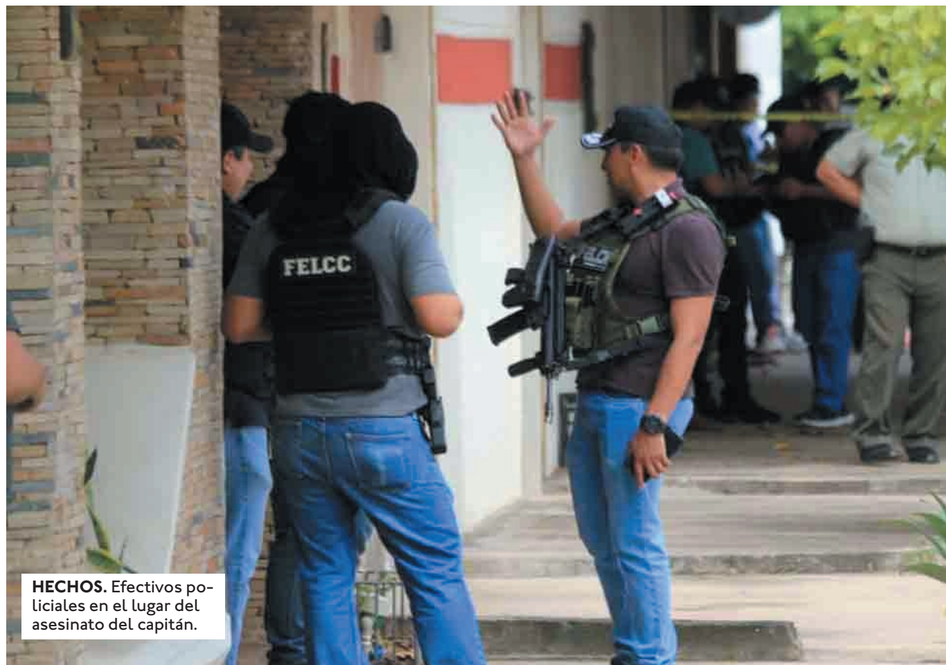
HECHOS. Efectivos policiales en el lugar del asesinato del capitán.