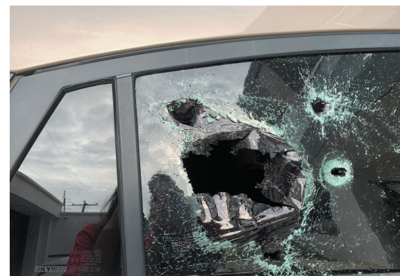
DISPAROS. Según los reportes preliminares, en el lugar del ataque se encontraron más de 15 casquillos de bala.