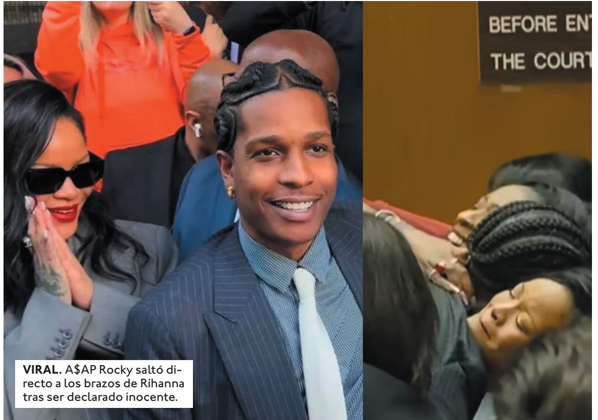
VIRAL. A$AP Rocky saltó directo a los brazos de Rihanna tras ser declarado inocente.

Los investigadores no encontraron armas ni municiones en