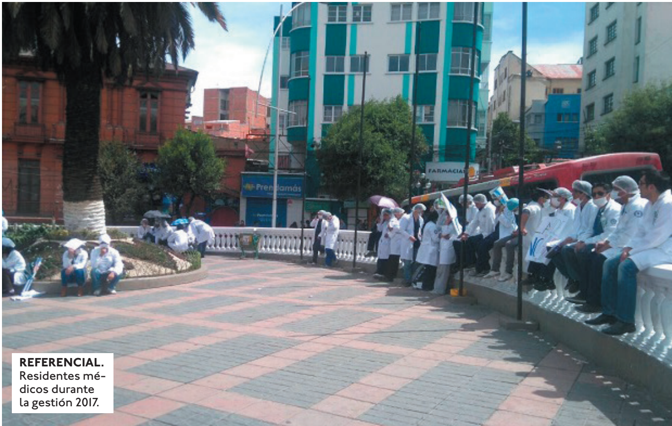
REFERENCIAL. Residentes médicos durante la gestión 2017.

DURANTE ESTE JUEVES NO HUBO UN PRONUNCIAMIENTO DEL MINISTERIO DE SALUD ANTE LAS DENUNCIAS SOBRE LA RESIDENCIA MÉDICA.