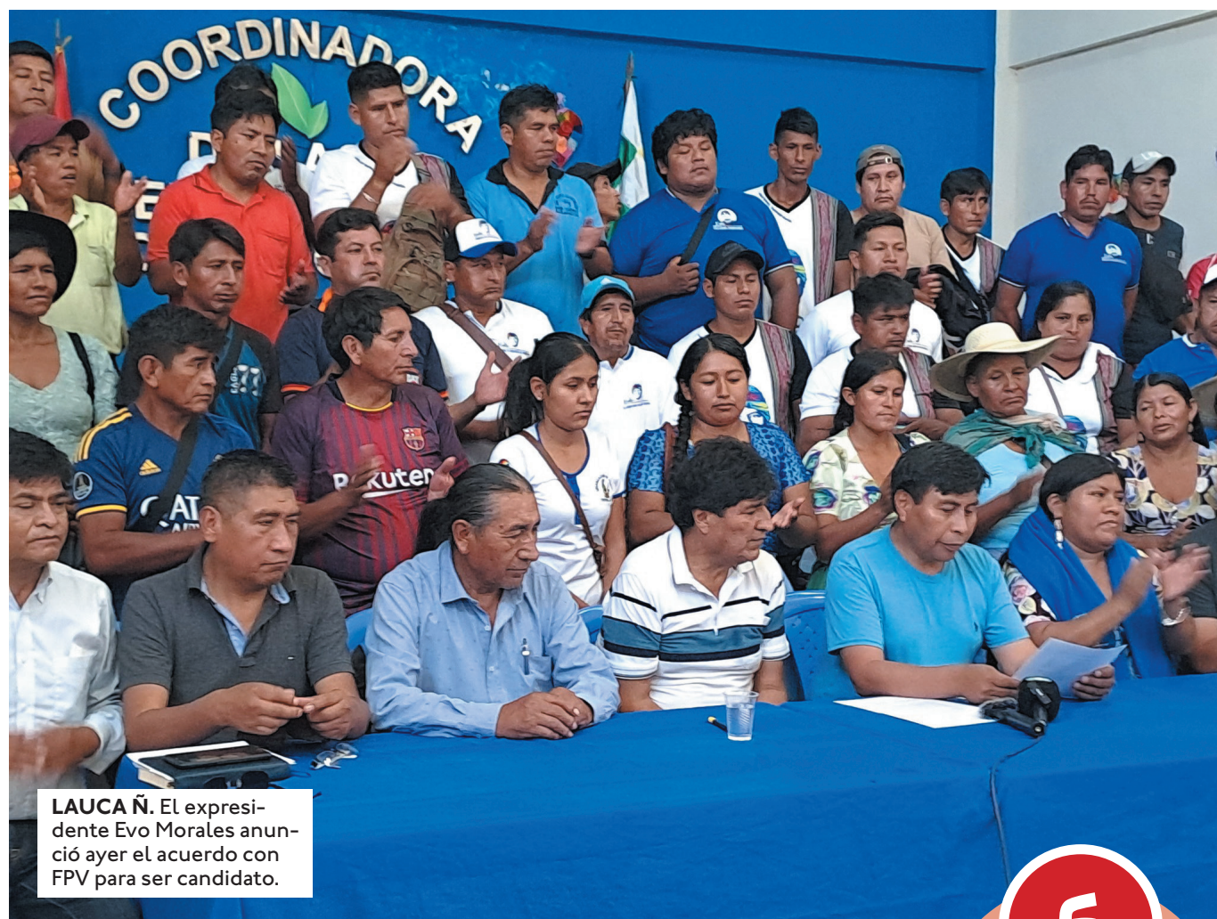
LAUCA Ñ. El expresidente Evo Morales anunció ayer el acuerdo con FPV para ser candidato.

En la conferencia se anunció que el compañero de fórmula será ele-