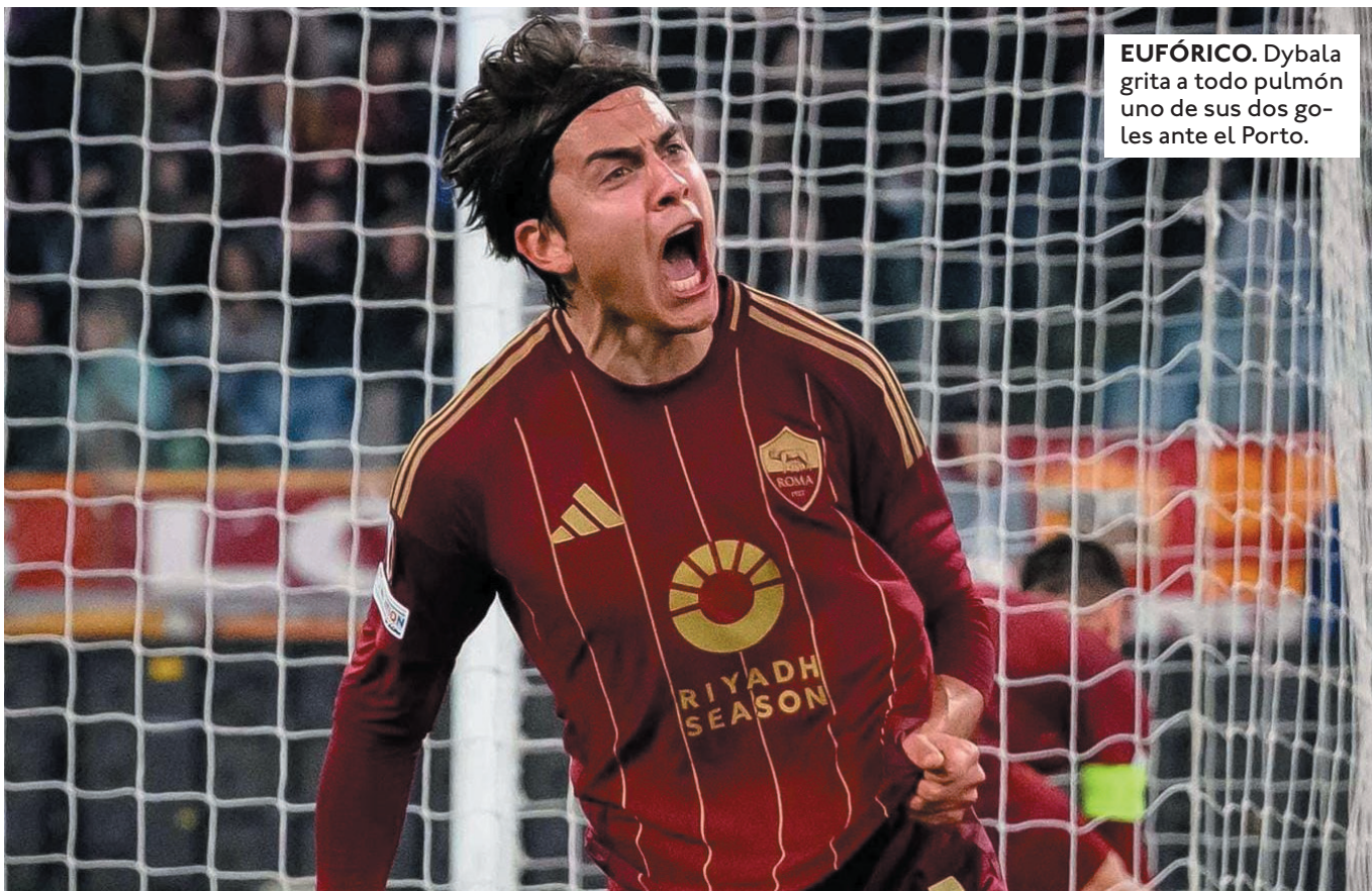
EUFÓRICO. Dybala grita a todo pulmón uno de sus dos goles ante el Porto.

FENERBAHCE GANÓ 3-0 EN LA IDA. AUMENTÓ DIFERENCIA A LOS 4' EN LA VUELTA. FINALIZADOS LOS FESTEJOS, SE DESATÓ UNA PELEA GRADERÍAS Y SE PARALIZÓ EL DUELO. 2-5 FUE GLOBAL A FAVOR DE FENERBAHCE.