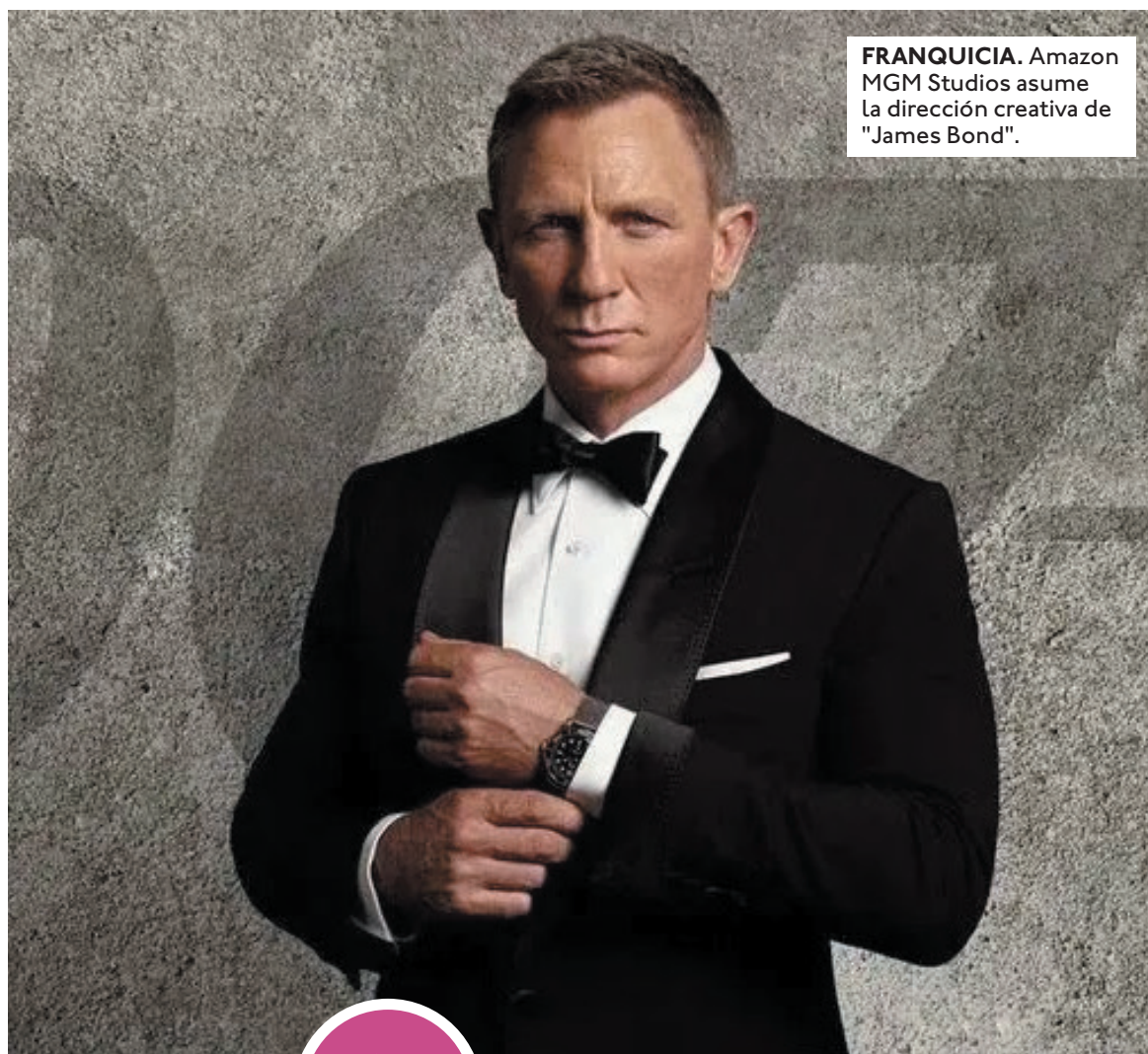
FRANQUICIA. Amazon MGM Studios asume la dirección creativa de "James Bond".

La noticia marca el fin de la influencia de la familia Broccoli en las decisiones creativas de la franquicia, tras más de seis décadas de control a través de su productora Eon Productions. Albert "Cubby" Broccoli, junto con Harry Saltzman, lanzó la saga en 1962 con Dr. No. Tras su fallecimiento, Barbara Broccoli y Michael G. Wilson asumieron el liderazgo, supervisando la producción de todas las películas de Bond desde GoldenEye en 1995. Wilson, de 83 años, confirmó su