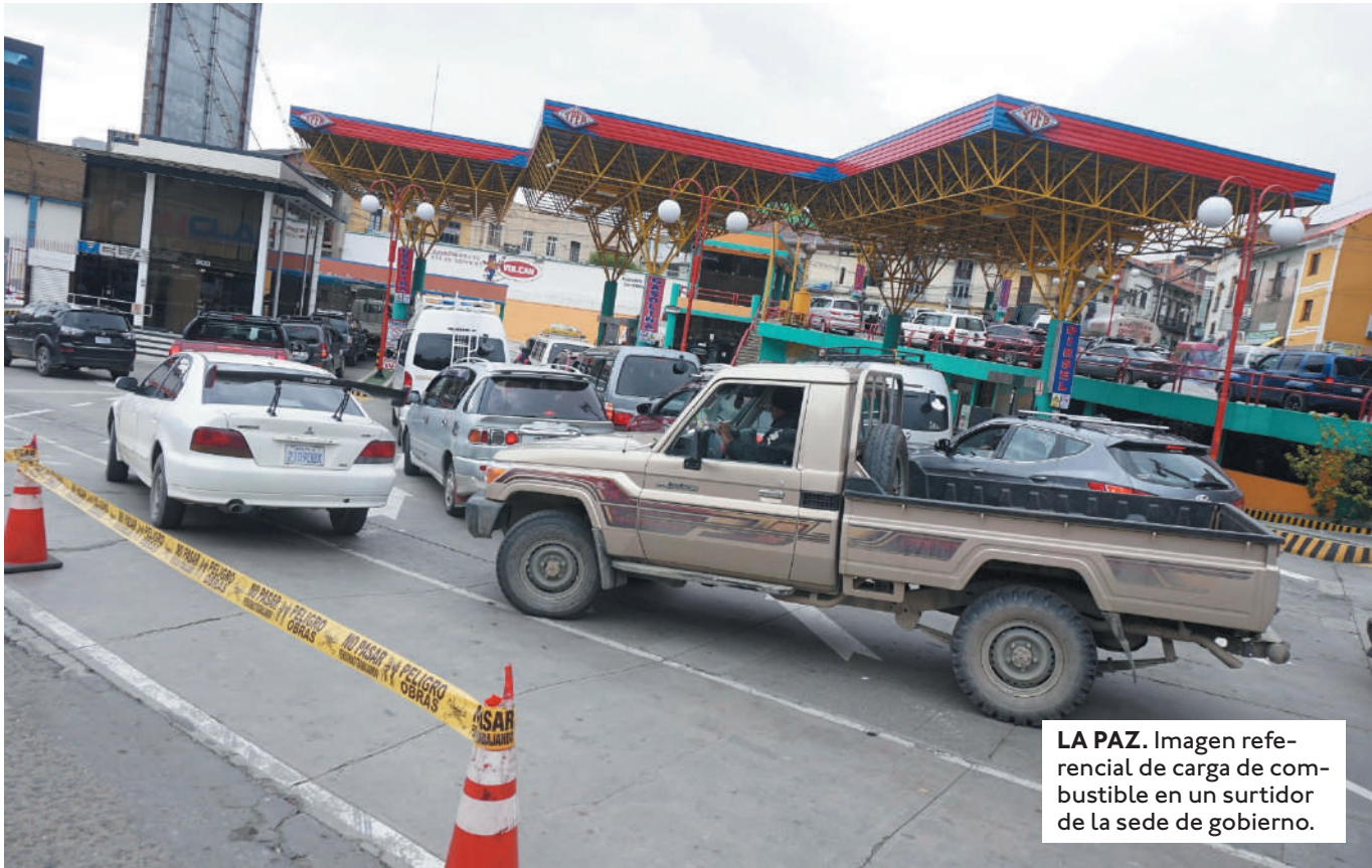
LA PAZ. Imagen referencial de carga de combustible en un surtidor de la sede de gobierno.