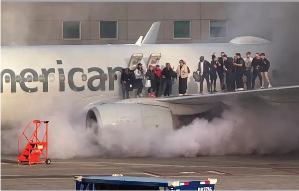
DENVER. Un avión de American Airlines con 178 personas a bordo se incendió en la pista, tras realizar un aterrizaje de emergencia en el aeropuerto internacional de Denver (Colorado, EE.UU.), lo que provocó que decenas de pasajeros fueran evacuados subiéndose al ala del avión.

Luis Arce ha atravesado tres fases bien definidas en la crisis de combustibles y dólares que golpea al país. Primero, la negación: durante meses, las autoridades minimizaron el problema, asegurando que todo estaba bajo control y que el abastecimiento estaba garantizado. Sin embargo, las largas filas en surtidores y la falta de divisas evidenciaron lo contrario. Ante la imposibilidad de ocultar la realidad, llegó la etapa de la acusación. Culpó a los empresarios, a la oposición y a la asamblea legislativa por bloquear créditos internacionales, sugiriendo que estos obstáculos son los responsables de la crisis. Sin embargo, la raíz del problema está en la caída de la producción de hidrocarburos y el agotamiento del modelo económico basado en subsidios insostenibles. Recientemente ha entrado en la fase de victimización. Dice estar "dolido" por la situación y asegura que hace todo lo posible para dar un "respiro" al país, apelando al sacrificio del pueblo. No obstante, más que dolor, la población necesita soluciones concretas y responsabilidad en la gestión económica.