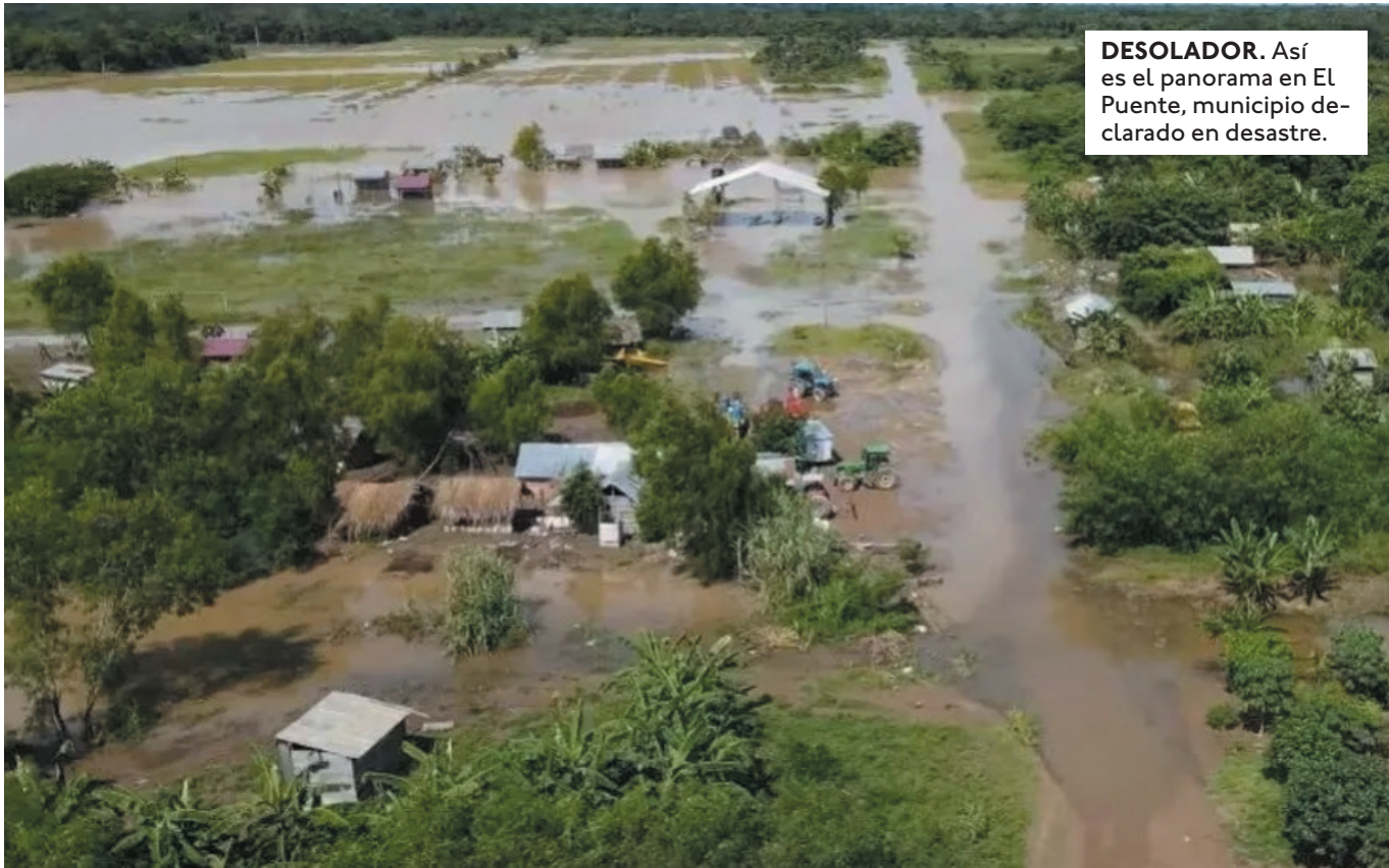
DESOLADOR. Así es el panorama en El Puente, municipio declarado en desastre.

EN EL PUENTE, AGAPITO CASTRO INFORMÓ QUE MÁS DE 1.000 FAMILIAS Y 37 COMUNIDADES HAN SIDO GRAVEMENTE AFECTADAS POR LAS INUNDACIONES.