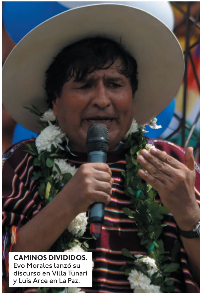
CAMINOS DIVIDIDOS. Evo Morales lanzó su discurso en Villa Tunari y Luis Arce en La Paz.

No quiere otro que no sea él. “Somos una fuerza política importante. Por eso, hermanas y hermanos, para terminar, quiero decirles, aquí no hay plan B. Cuando hablan del plan B, ese plan B es el imperio del gobierno y de la derecha. Yo he escuchado decir, eso no es solo plan, un plan, plan B, como decidieron regiones, departamentos, congresos, nacionales, distintos sectores sociales. Es el candidato único, Evo presidente”, indicó Morales en su intervención. Morales aún persiste con su candidatura para las elecciones presidenciales venideras, pese a que un fallo del Tribunal Constitucional Plurinacional (TCP) lo inhabilitara de dichos comicios. Además, la respuesta del exmandatario, sobre que no existe un plan B dentro de las filas del instrumento político para las elecciones, se da luego de que una encuesta de la Red Uno, en la que el presidente de la Cámara de