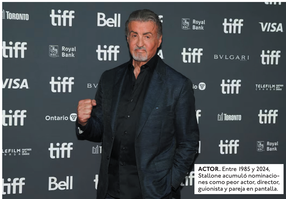
ACTOR. Entre 1985 y 2024, Stallone acumuló nominaciones como peor actor, director, guionista y pareja en pantalla.

Las películas que le valieron estas distinciones abarcan gran parte de su carrera: fue distinguido como peor actor por Rhinestone, Rocky III, Rambo: First Blood Part II y ¡Alto! O mi madre dispara. Como actor de reparto, fue premiado por Spy Kids 3 y Los Indestructibles 4. También recibió críticas por su trabajo detrás de cámara, siendo elegido Peor Director por Rocky IV y Peor Guion por Rambo: First Blood Part II. Incluso compartió una Frambuesa de Oro por la "Peor Pareja en Pantalla" con Sharon Stone por El especialista. En marzo de 2024, Sylvester Stallone volvió a figurar en el listado de ganadores de los Razzie al recibir el premio a Peor Actor de Reparto por su participa-