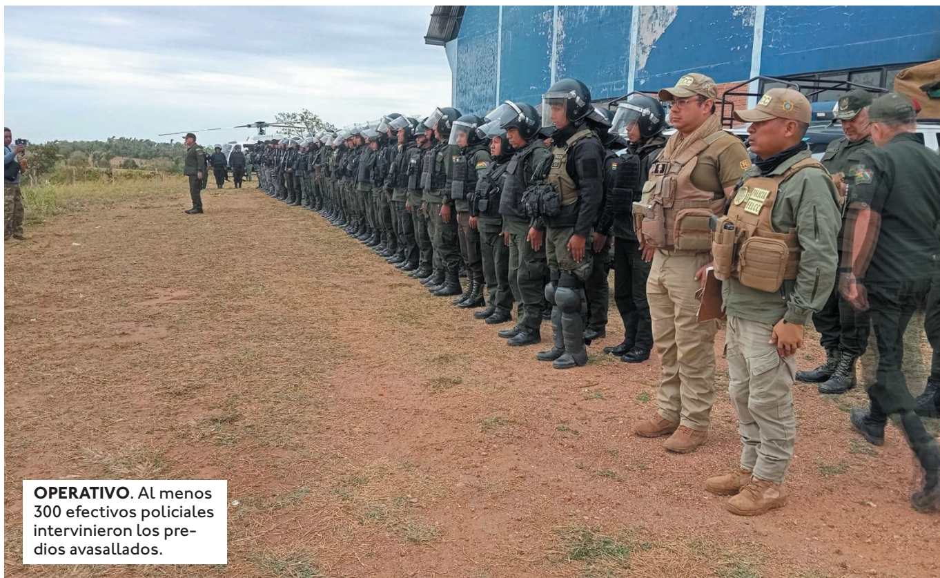
OPERATIVO. Al menos 300 efectivos policiales intervinieron los predios avasallados.