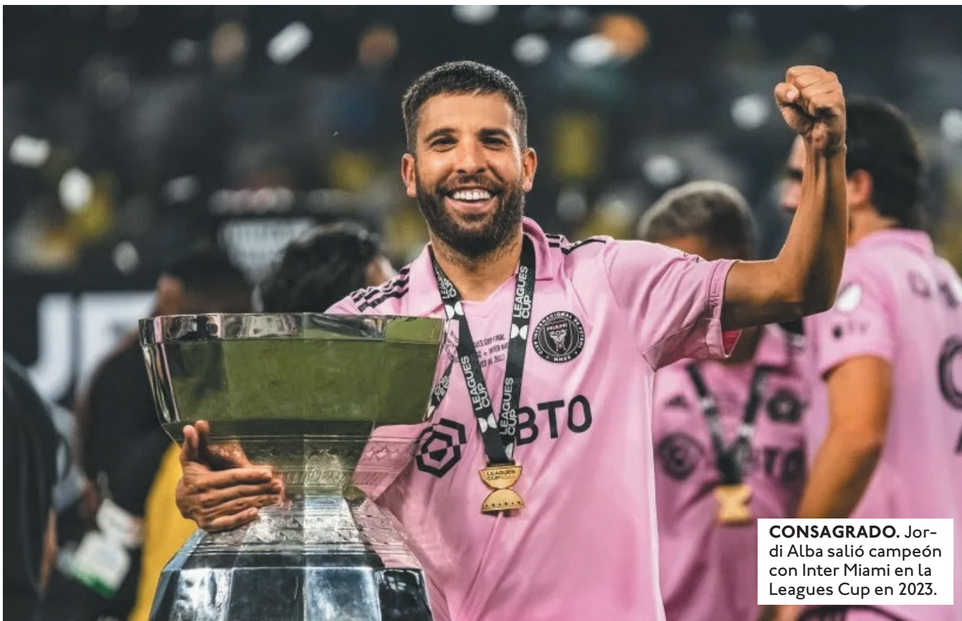
CONSAGRADO. Jordi Alba salió campeón con Inter Miami en la Leagues Cup en 2023.

"MI QUERIDO JORDI, CUÁNTAS AVENTURAS, ENFRENTAMIENTOS Y MOMENTOS HE MOS COMPARTIDO. EL FÚTBOL TE ECHARÁ DE MENOS", ESCRIBIÓ EN TWITTER.