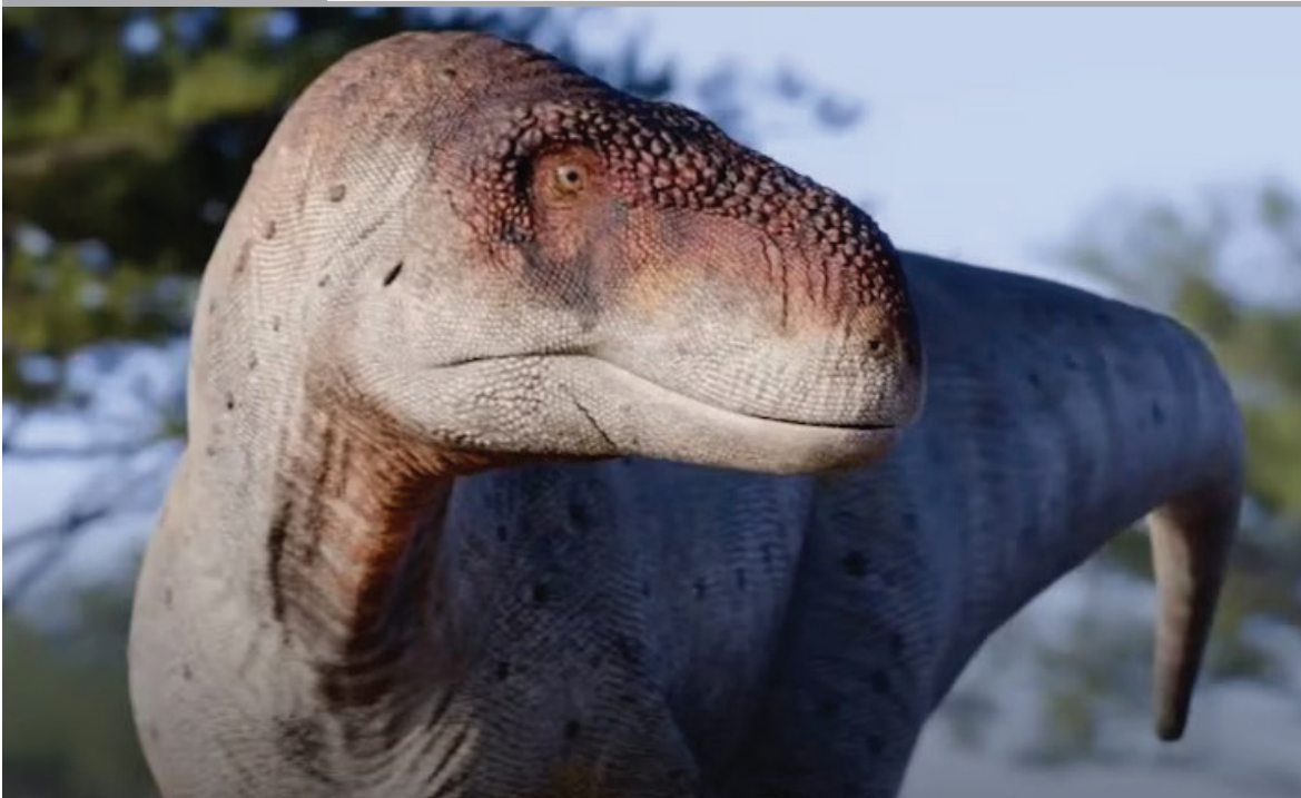
DINOSAURIO. Científicos de Argentina, Reino Unido y Brasil descubrieron en la provincia nortea de La Rioja una nueva especie de dinosaurio carnívoro, Vitosaura colozacani, que desafía la idea de que los abelisaurios solo habitaban la Patagonia. El hallazgo, publicado en la revista Ameghiniana, redefine la distribución y diversidad de los grandes depredadores del Cretácico en Sudamérica.

La nueva izquierda se disfraza de víctima, pero ruge como depredadora. Siempre grita "¡mírenme, escúchenme, respétenme!", convencida de que su dolor la autoriza a imponer su moral y castigar a quien no la adore. Esa obsesión con el "me, me, me" (me discriminan, me atacan, me ignoran...) ha convertido al individualismo en un culto narcisista donde todo desacuerdo se interpreta como agresión. Quien no repite sus dogmas sobre raza, género o identidad, es tachado de enemigo y "merece" ser cancelado o eliminado. En nombre de la justicia social, esta izquierda-oveja reclama ternura, pero actúa con los colmillos del odio. Se ampara en el victimismo para justificar la violencia y el control moral, confundiendo defensa con ataque. Ha hecho de la indignación un modo de poder, y del resentimiento, una bandera. Olvidó que la libertad solo existe cuando respeta la del otro. Detrás de su discurso compasivo se oculta una intolerancia feroz que devora la razón y la libertad. Es la oveja que llora mientras muerde: la que predica amor, pero practica destrucción.