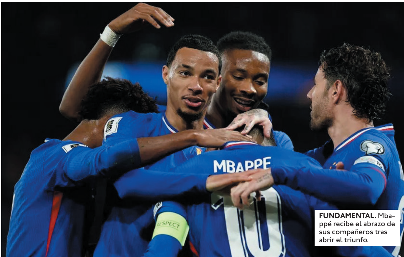
FUNDAMENTAL. Mbappé recibe el abrazo de sus compañeros tras abrir el triunfo.