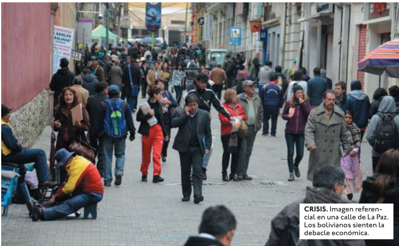
CRISIS. Imagen referencial en una calle de La Paz. Los bolivianos sienten la debacle económica.