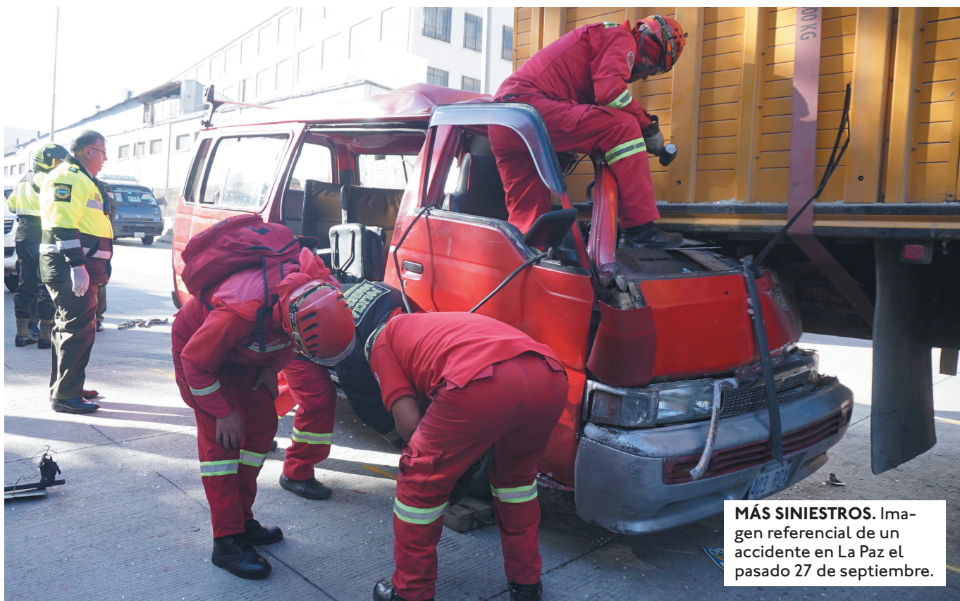
MÁS SINIESTROS. Imagen referencial de un accidente en La Paz el pasado 27 de septiembre.

EL EJE TRONCAL DEL PAÍS —LA PAZ, COCHABAMBA Y SANTA CRUZ— CONCENTRA CERCA DEL 90% DE LOS ACCIDENTES, SIENDO SANTA CRUZ Y COCHABAMBA LAS REGIONES CON MÁS CASOS EN MOTOCICLETAS.