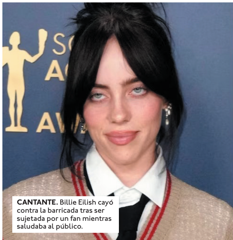
CANTANTE. Billie Eilish cayó contra la barricada tras ser sujeta por un fan mientras saludaba al público.

INCIDENTE. Un hombre tiró violentamente de la cantante mientras ella saludaba a la primera fila de su show.