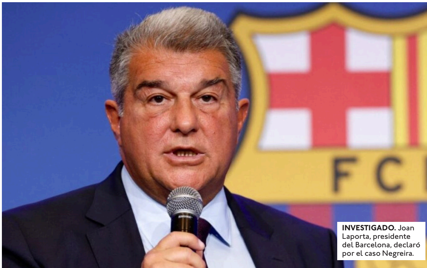
INVESTIGADO. Joan Laporta, presidente del Barcelona, declaró por el caso Negreira.

LOS DIRIGIDOS POR FLICK BUSCAN AFIANZARSE EN EL LIDERATO CUANDO RECIBAN AL OSASUNA ESTE SÁBADO A LAS 13:30 (HB). EL MADRID JUEGA EL DOMINGO ANTE ALAVÉS (16:00).