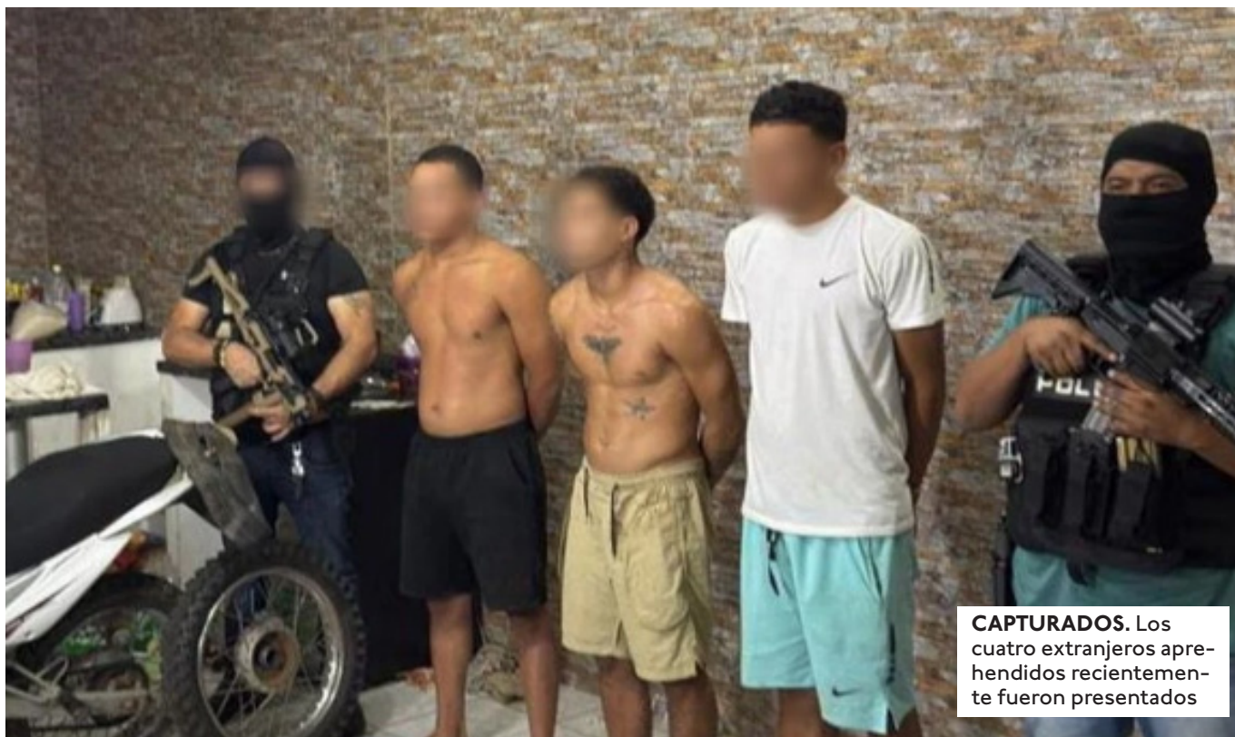
CAPTURADOS. Los cuatro extranjeros aprehendidos recientemente fueron presentados