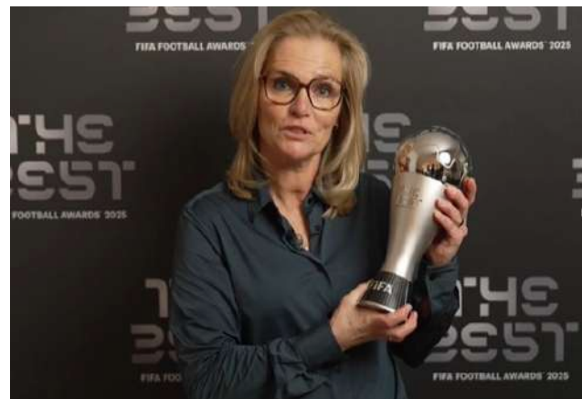
GALARDONADA. Sarina Wiegman fue elegida mejor entrenadora tras destacar con la Selección de Inglaterra.