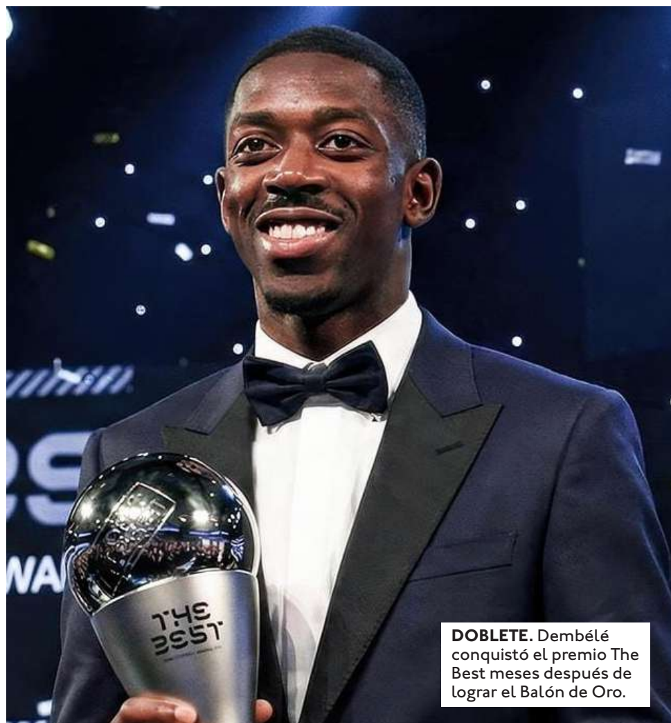
DOBLETE. Dembélé conquistó el premio The Best meses después de lograr el Balón de Oro.