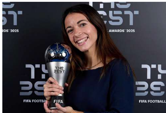
HISTÓRICO. La jugadora del Barcelona, Aitana Bonmatí, consiguió su tercer The Best de forma consecutiva.