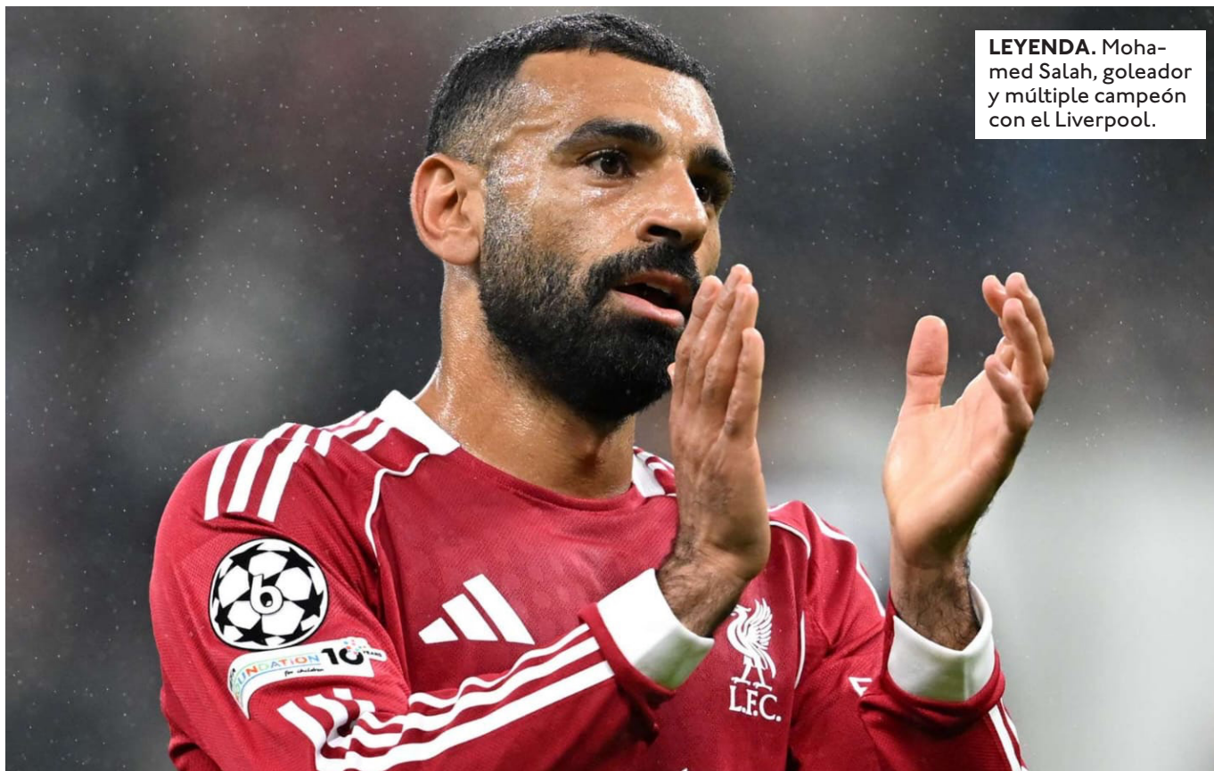
LEYENDA. Mohamed Salah, goleador y múltiple campeón con el Liverpool.

DOS TÍTULOS DE LA PREMIER, UNA CHAMPIONS, UNA FA CUP, DOS COPAS DE LA LIGA, UNA SUPERCOPA DE LA UEFA Y UN MUNDIAL DE CLUBES DE LA FIFA.