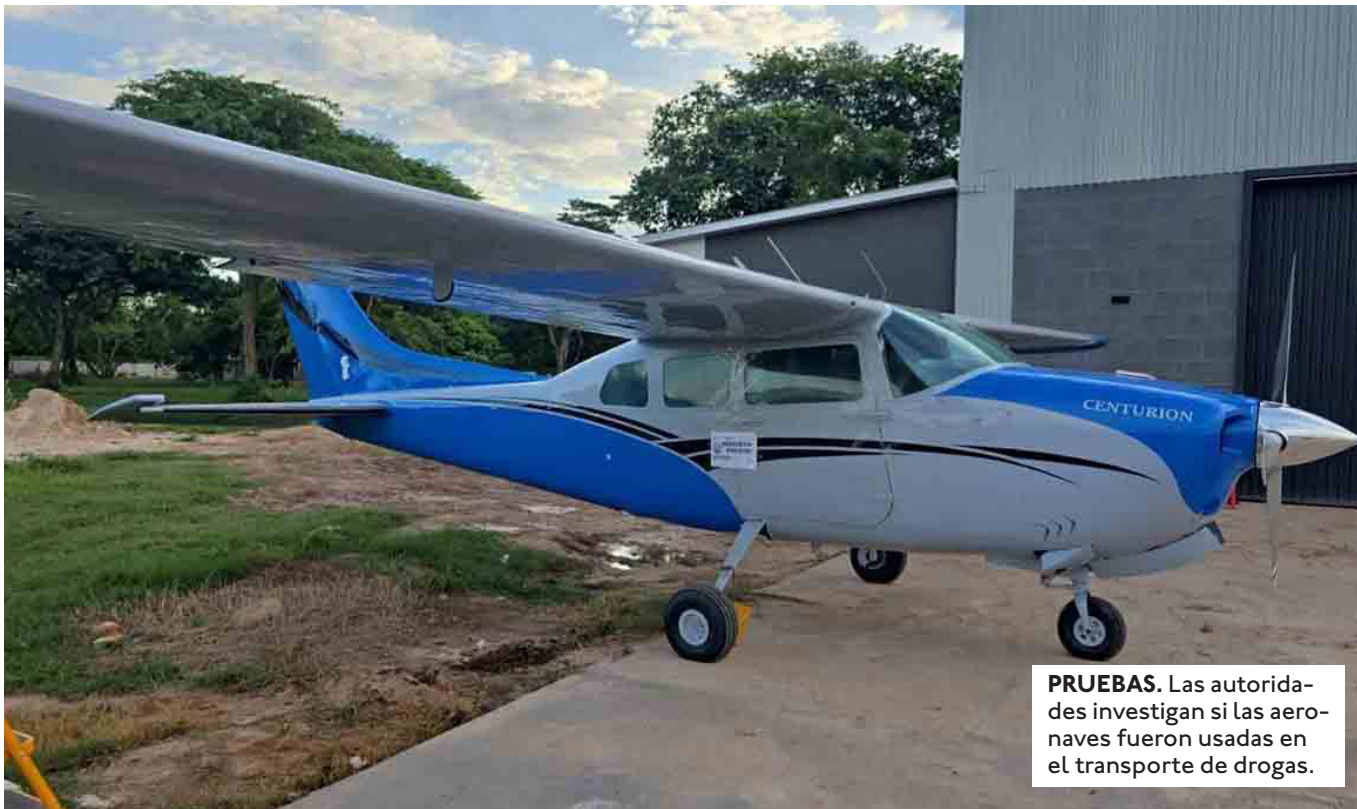
PRUEBAS. Las autoridades investigan si las aeronaves fueron usadas en el transporte de drogas.

EN UN MONTE UBICADO EN EL INGRESO AL AERÓDROMO COLORADILLO, LA POLICÍA HALLÓ VARIOS EQUIPOS DE COMUNICACIÓN.