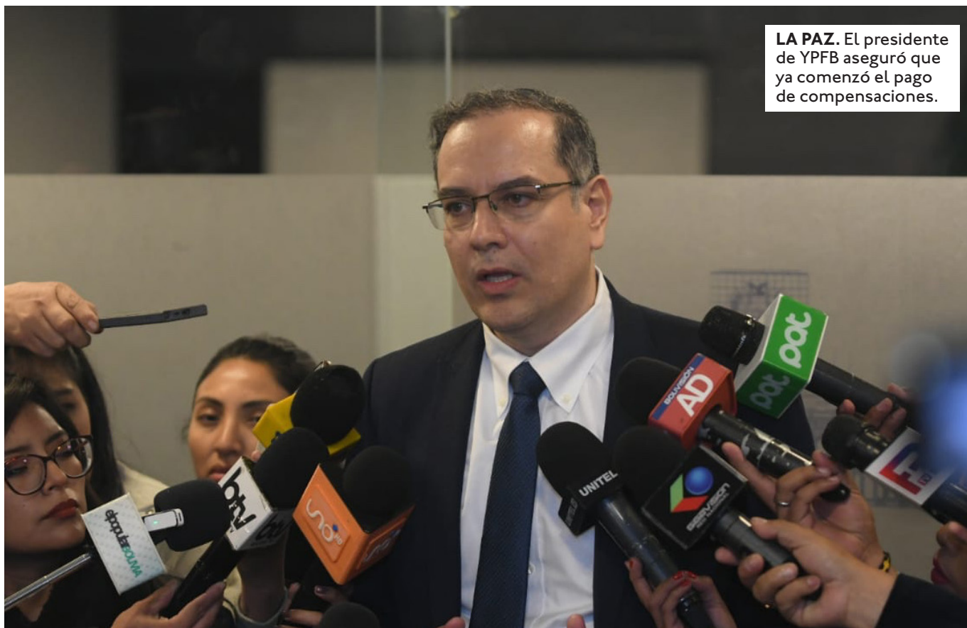
LA PAZ. El presidente de YPFB aseguró que ya comenzó el pago de compensaciones.

SEÑALÓ QUE EL CONDUCTOR CARGÓ 32,751 LITROS EN IQUIQUE Y ANTES DE DESCARGARLO EN SENKATA, SE DETECTÓ QUE EL DIÉSEL ESTABA CONTAMINADO.