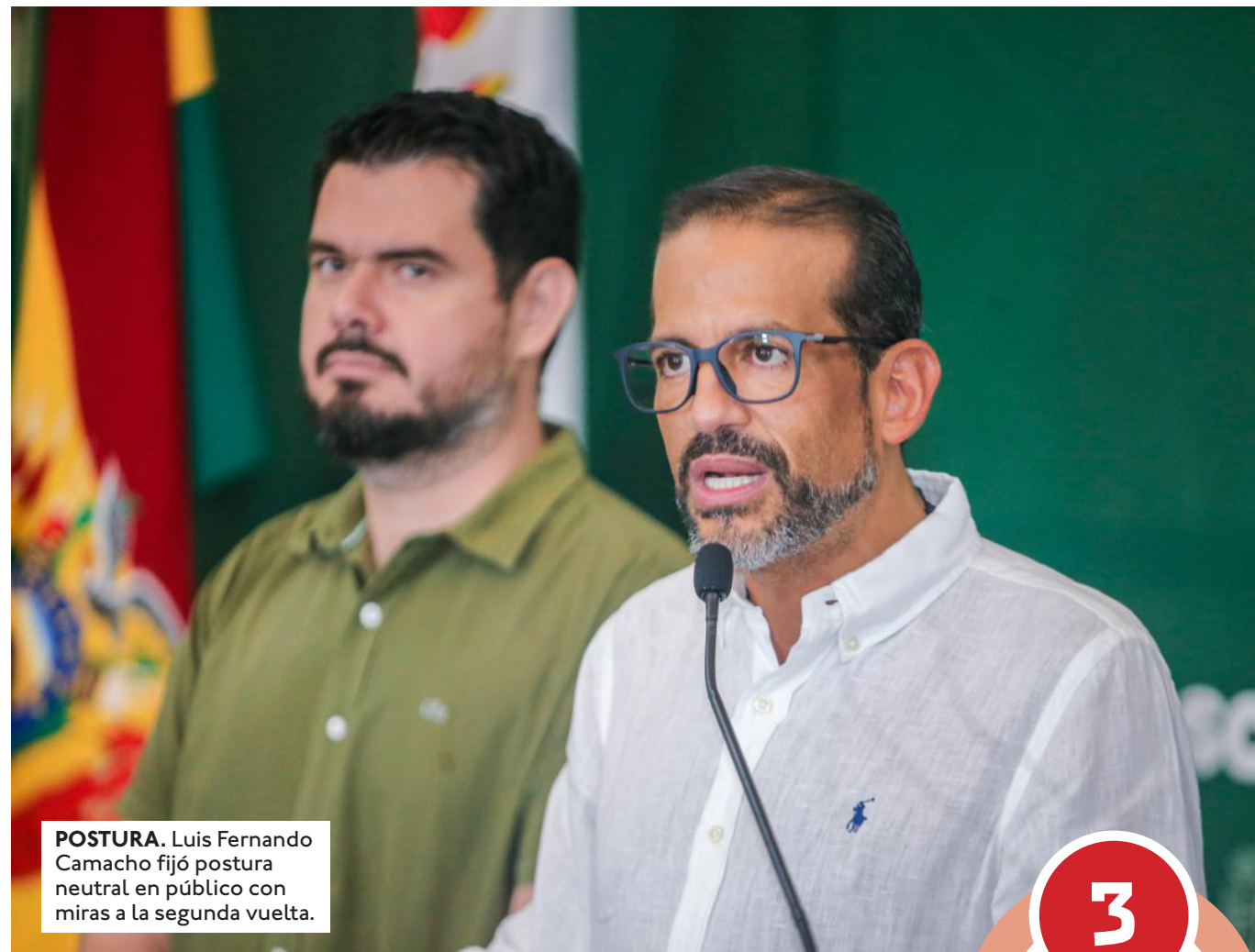
POSTURA. Luis Fernando Camacho fijó postura neutral en público con miras a la segunda vuelta.

Repite postura con respecto a las generales. Sobre quienes continúan en carrera señaló que serán ellos quienes tendrán que seguir informando sobre sus propuestas a la ciudadanía en busca del voto. Así, Camacho asume una posición igual a la que tomó en las elecciones generales ya que en la