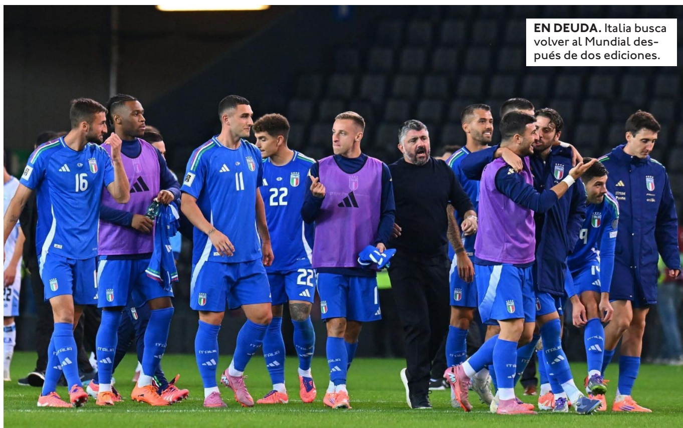
EN DEUDA. Italia busca volver al Mundial después de dos ediciones.

EL COMBINADO POLACO SE ENFRENTARÁ A ALBANIA ESTE JUEVES A LAS 15:45, HORA BOLIVIANA. EL GANADOR DEFINIRÁ EL PASE AL MUNDIAL ANTE UCRANIA O SUECIA.