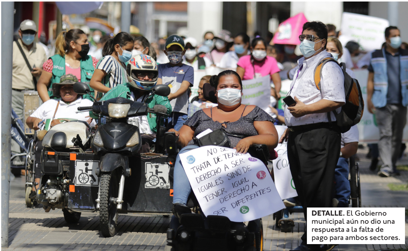
DETALLE. El Gobierno municipal aún no dio una respuesta a la falta de pago para ambos sectores.

EL GOBIERNO MUNICIPAL PAGA ESA CIFRA POR MES, EN EL MARCO DE LA LEY 977 DE AYUDA ECONÓMICA A PERSONAS CON DISCAPACIDAD.