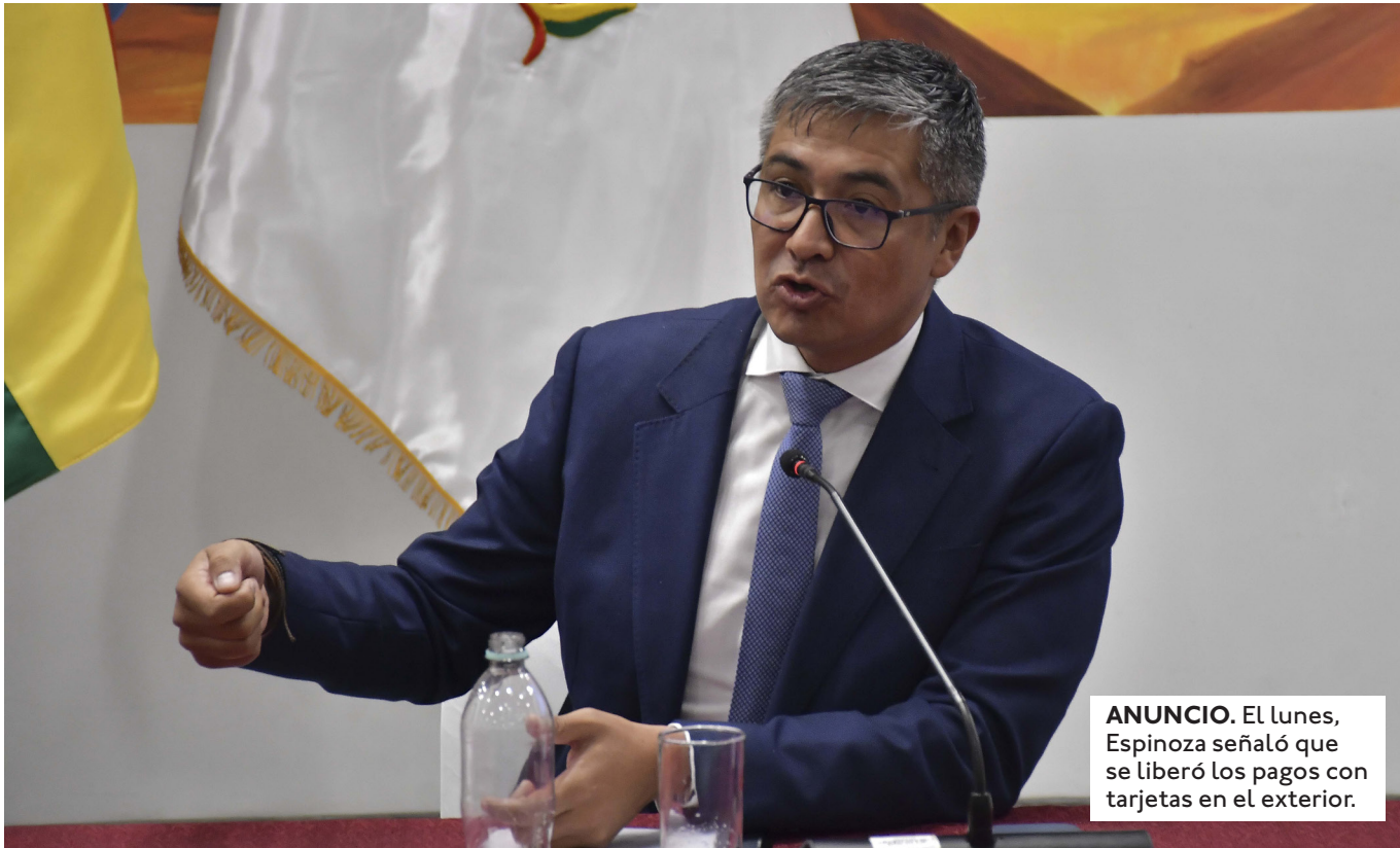
ANUNCIO. El lunes, Espinoza señaló que se liberó los pagos con tarjetas en el exterior.

EL MINISTRO ESPINOZA REMARCÓ QUE LOS BANCOS YA NO PODRÁN COBRAR COMISIONES PARA PAGOS AL EXTERIOR, SINO USAR EL VALOR REFERENCIAL DEL DÓLAR DEL DÍA.