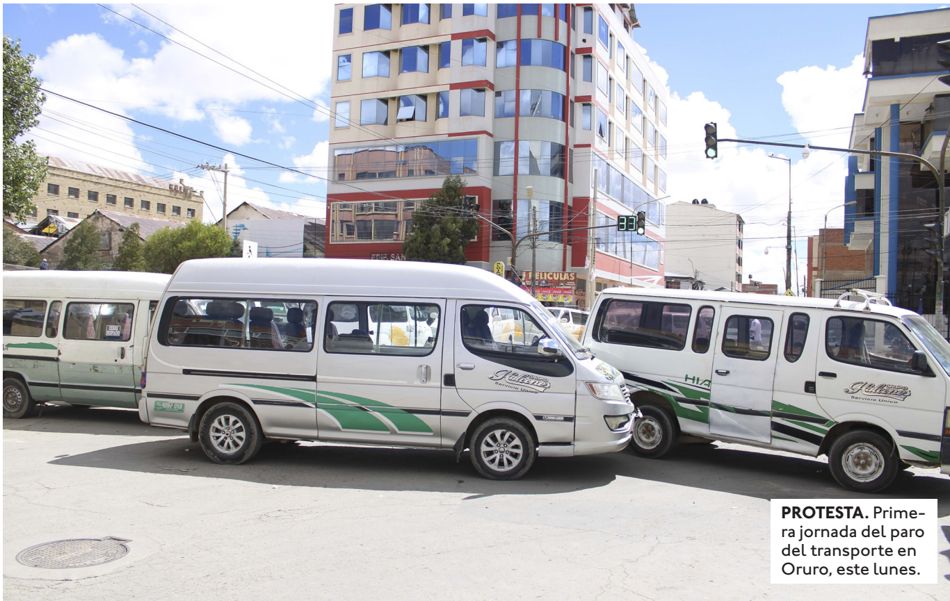
PROTESTA. Primera jornada del paro del transporte en Oruro, este lunes.

YPFB INCORPORÓ ADITIVOS PARA MEJORAR LA GASOLINA, PERO PERSISTEN LAS QUEJAS. EL GOBIERNO DIO VARIAS VERSIONES DE LAS CAUSAS, PERO NO CONVENCE.