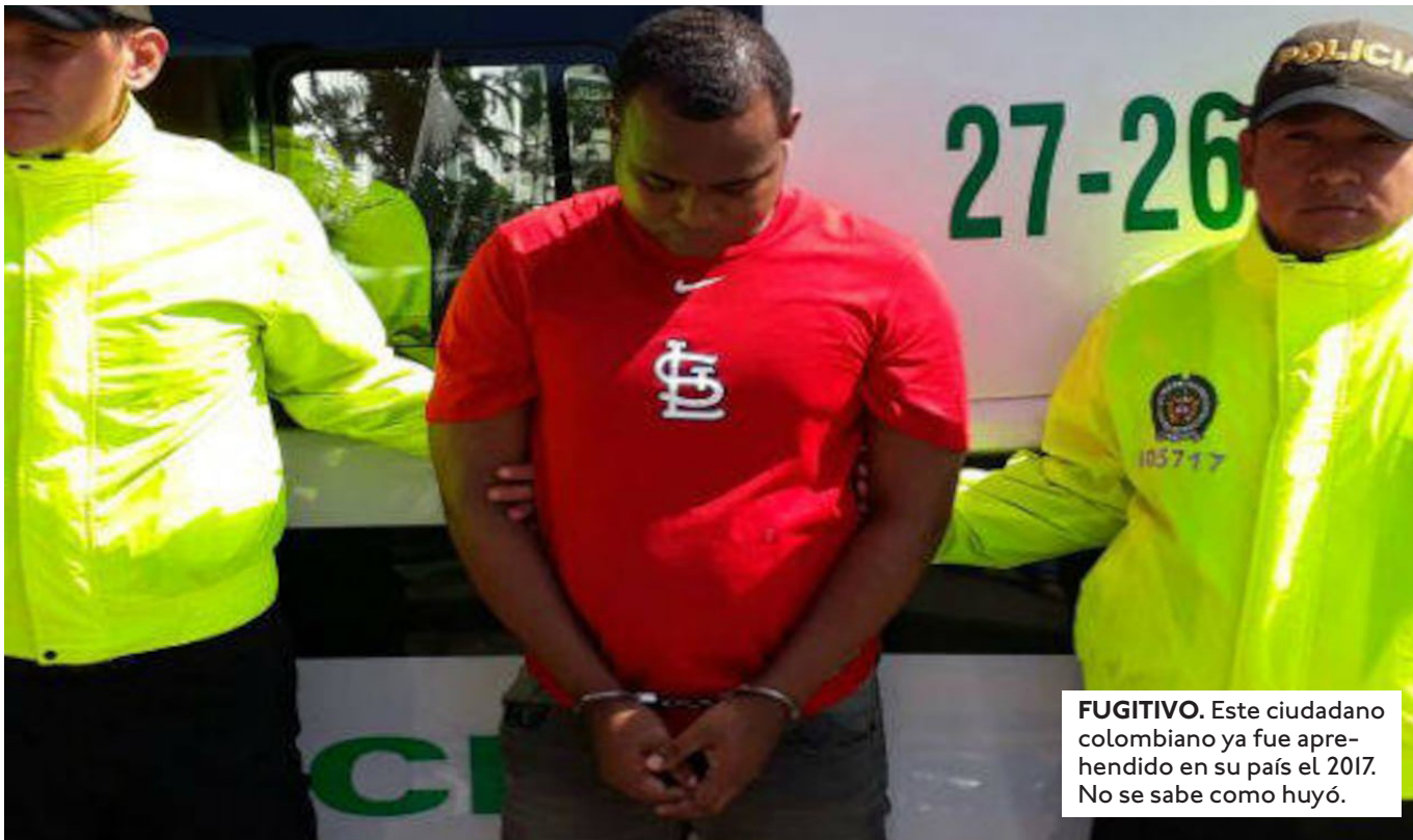
FUGITIVO. Este ciudadano colombiano ya fue aprehendido en su país el 2017. No se sabe como huyó.

EL GRUPO UTILIZABA LA CASA-QUINTA ALQUILADA COMO BASE DE OPERACIONES, DONDE PRETENDIERON EVADIR LA VIGILANCIA