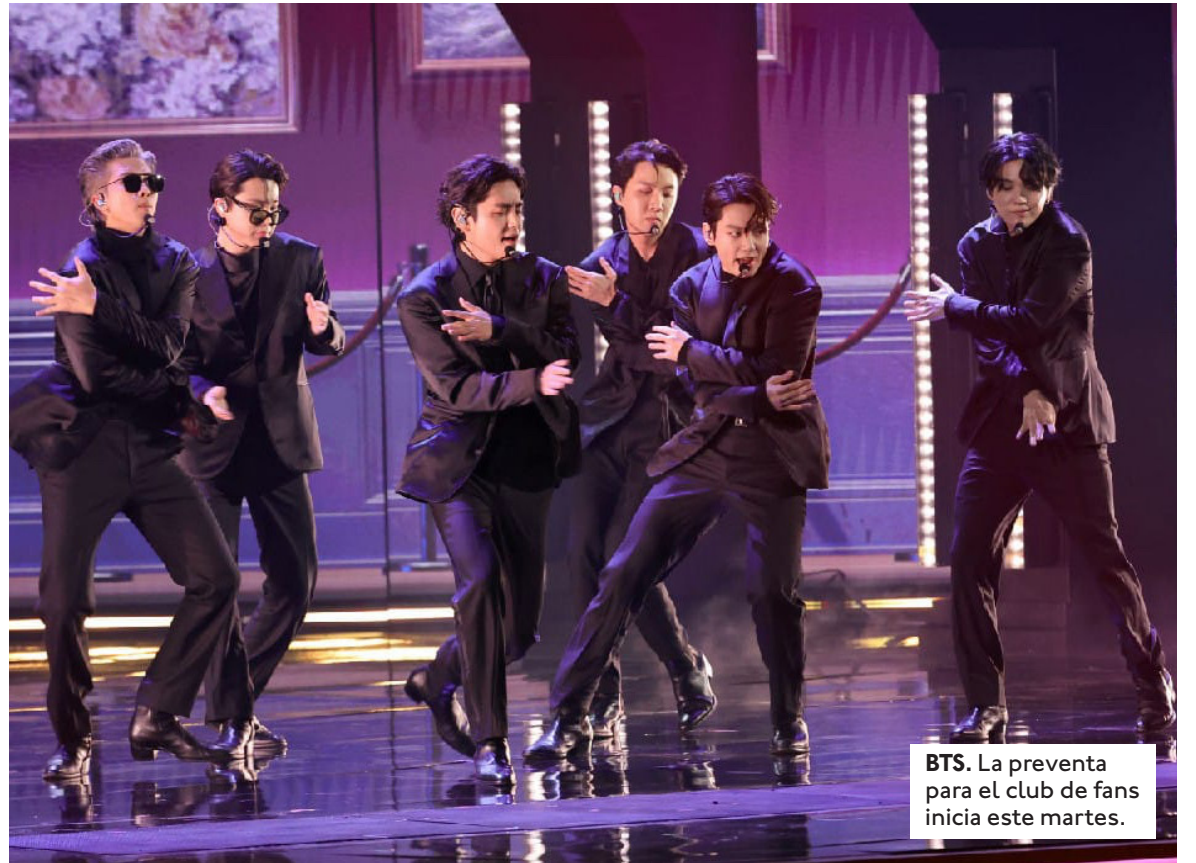
BTS. La preventa para el club de fans inicia este martes.

Inmediatamente después, el grupo se trasladará a Lima, Perú, un país que ha demostrado ser uno de los bastiones más fieles del fandom. Originalmente se habían previsto dos presentaciones para los días 9 y 10 de octubre, pero ante la velocidad con la que se agotaron las reservas previas y la movilización en redes sociales, la banda añadió un tercer concierto para el 7 de octubre en el Estadio de la Universidad San Marcos, ampliando así la oportunidad para miles de seguidores peruanos. En Chile, la fiebre por BTS no ha sido menor y el impacto en la taquilla ha obligado a replantear el calendario. El Estadio Nacional en Santiago será el recinto donde el septeto ofrecerá tres espectácu-