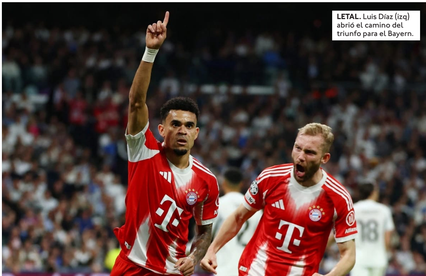
LETAL. Luis Díaz (izq) abrió el camino del triunfo para el Bayern.

"NECESITAMOS TIRAR MÁS A PUERTA. EL MEJOR JUGADOR DEL BAYERN HOY FUE NEUER", DIJO EL DEFENSOR DEL MADRID SOBRE EL FINAL.