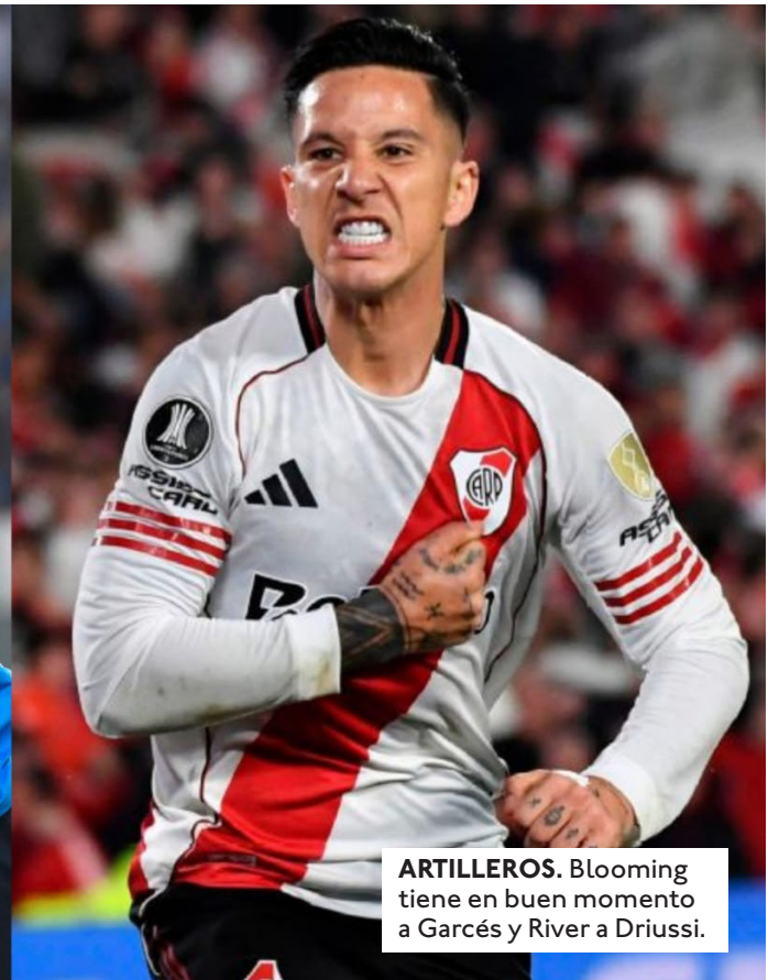
ARTILLEROS. Blooming tiene en buen momento a Garcés y River a Driussi.

Luis Lijeron Nuñez llijeron@eldia.com.bo