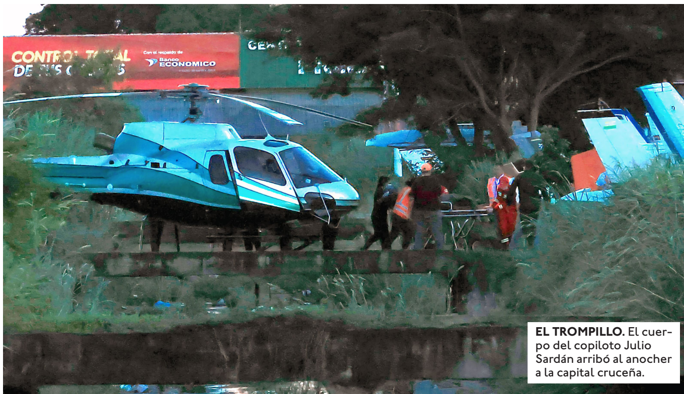
EL TROMPILLO. El cuerpo del copiloto Julio Sardán arribó al anoche a la capital cruceña.

EN TIKTOK, JULIO SARDÁN COM- PARTIÓ EL DOMINGO UN VIDEO DONDE SE LO VE EN LA CABINA Y LUEGO EL ATERRIZAJE DE LA CESSNA CITATION.