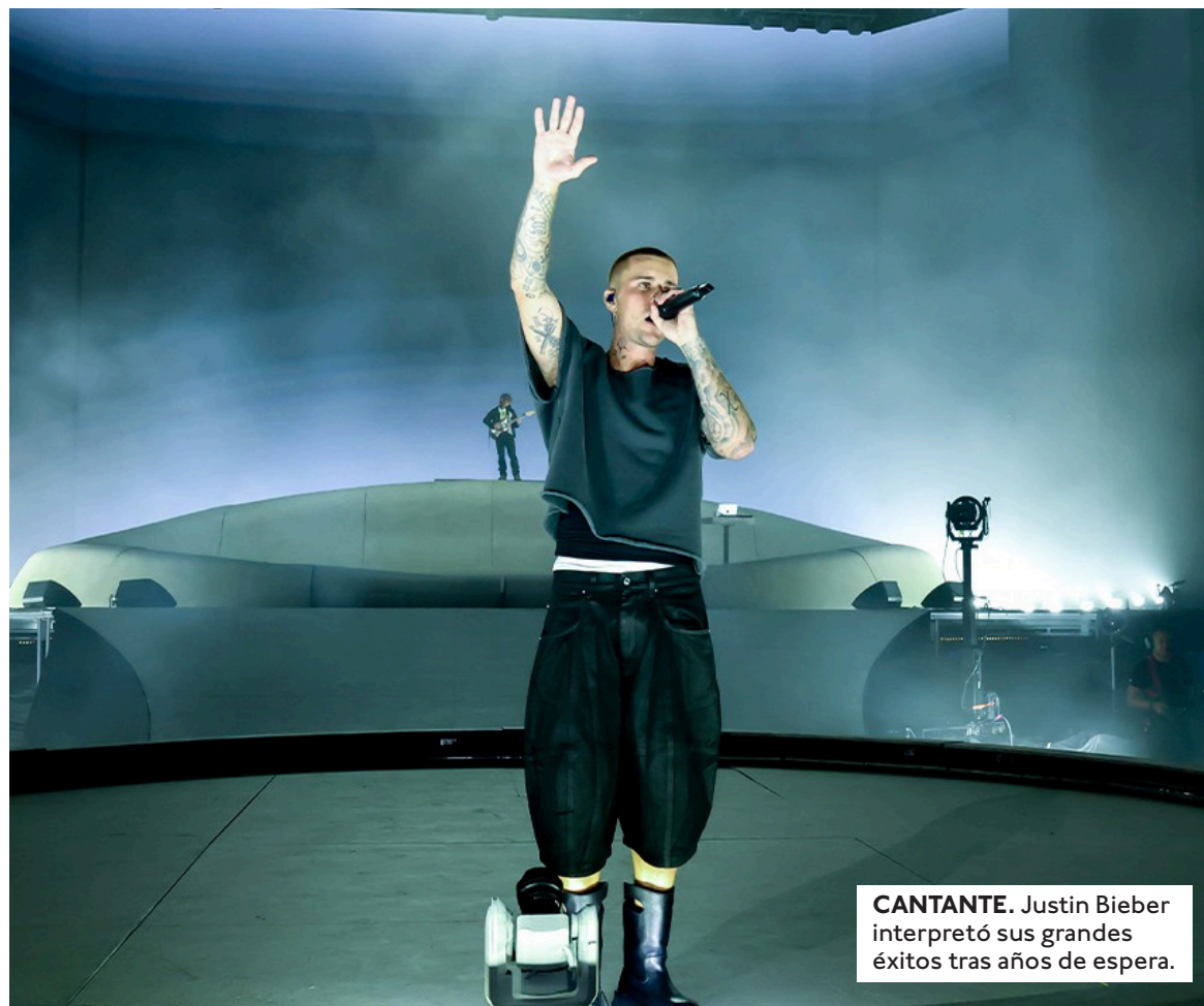
CANTANTE. Justin Bieber interpretó sus grandes éxitos tras años de espera.

Además del boletaje general, los paquetes VIP y las experiencias