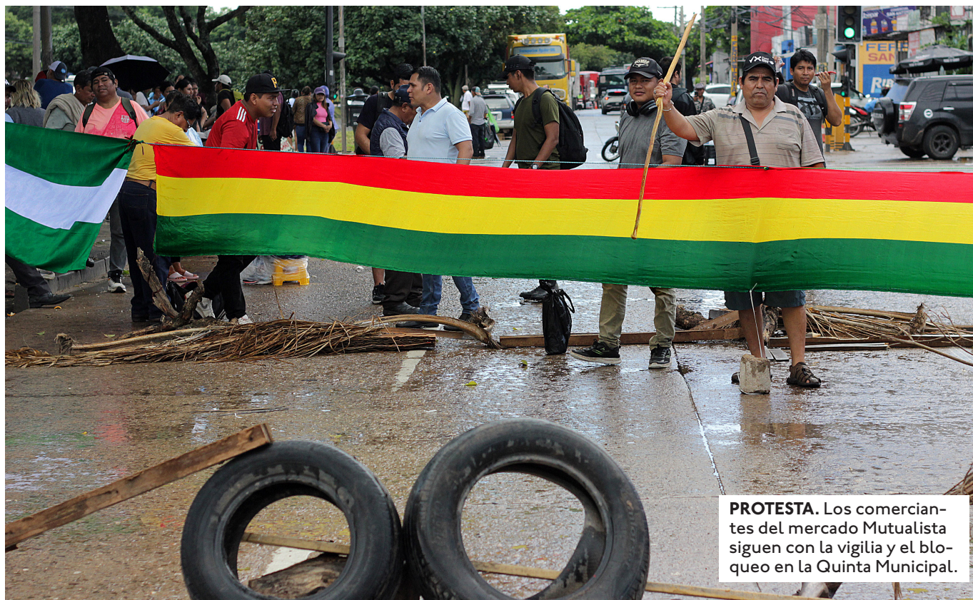
PROTESTA. Los comerciantes del mercado Mutualista siguen con la vigilia y el bloqueo en la Quinta Municipal.

"MAMÉN" SA- AVEDRAENFA- TIZÓ QUE EL MERCADO MUTUALISTA "NO SE VENDE NI SE NEGOCIA" Y PIDIÓ ASUMIR UNA DEFENSA DE ESTE PREDIO.