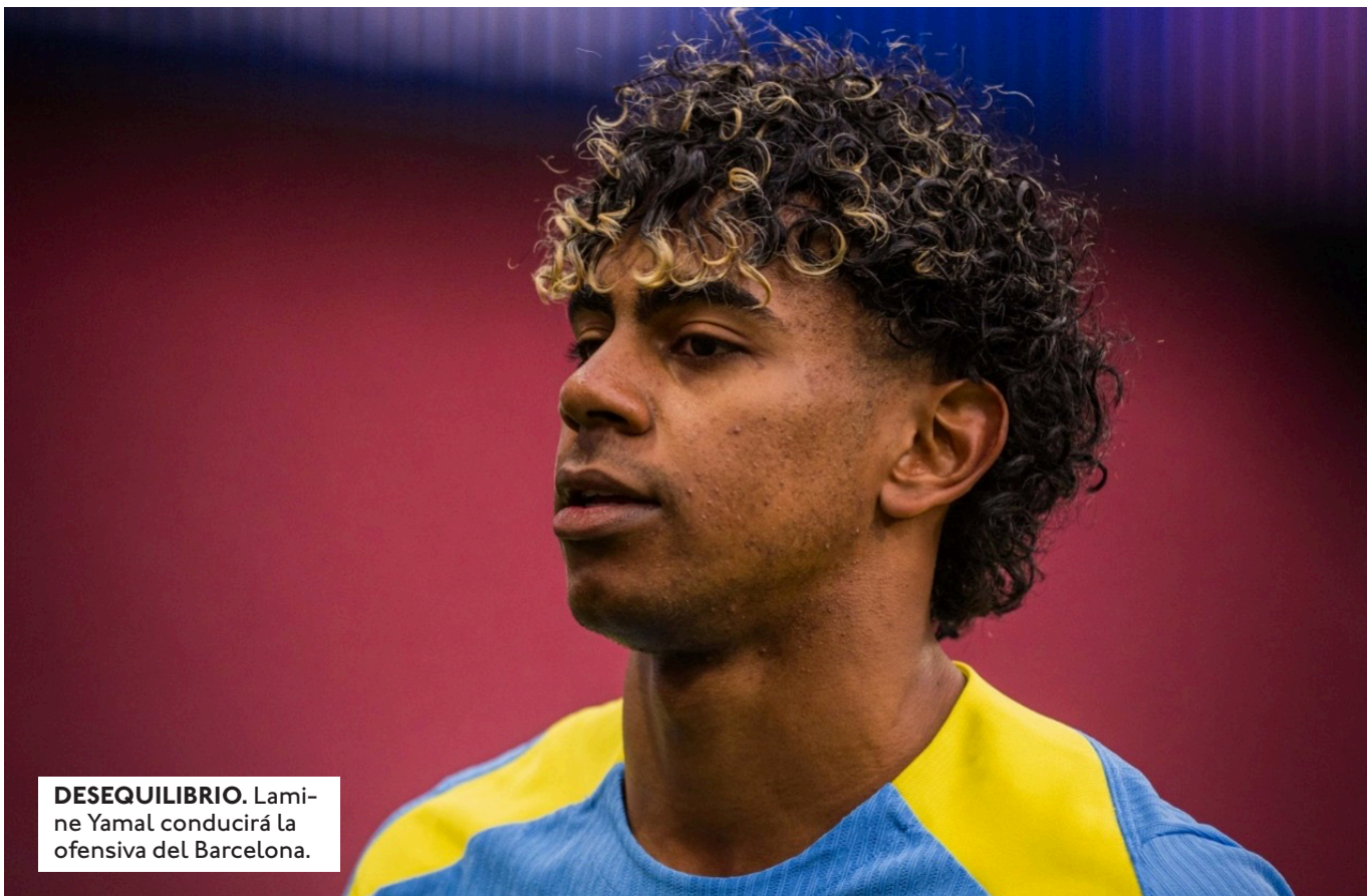
DESEQUILIBRIO. Lamine Yamal conducirá la ofensiva del Barcelona.

EL CUADRO FRANCÉS TIENE LA VENTAJA DE HABER GANADO 2-0 EN LA IDA. ESTE MARTES SERÁ VISITANTE ANTE EL LIVERPOOL A PARTIR DE LAS 15:00, HORA BOLIVIANA.