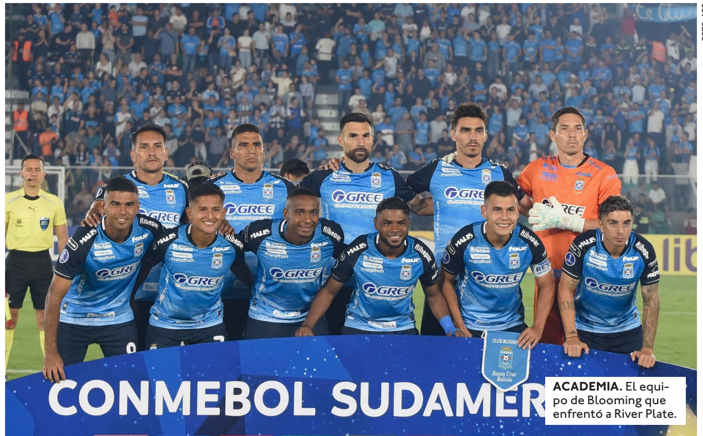
ACADEMIA. El equipo de Blooming que enfrentó a River Plate.

EL CUADRO DE EL ALTO, LUEGO DE DEBUTAR CON DERROTA ANTE LIGA DE QUITO, VISITARÁ ESTE JUEVES A LANÚS EN ARGENTINA A PARTIR DE LAS 18:00.