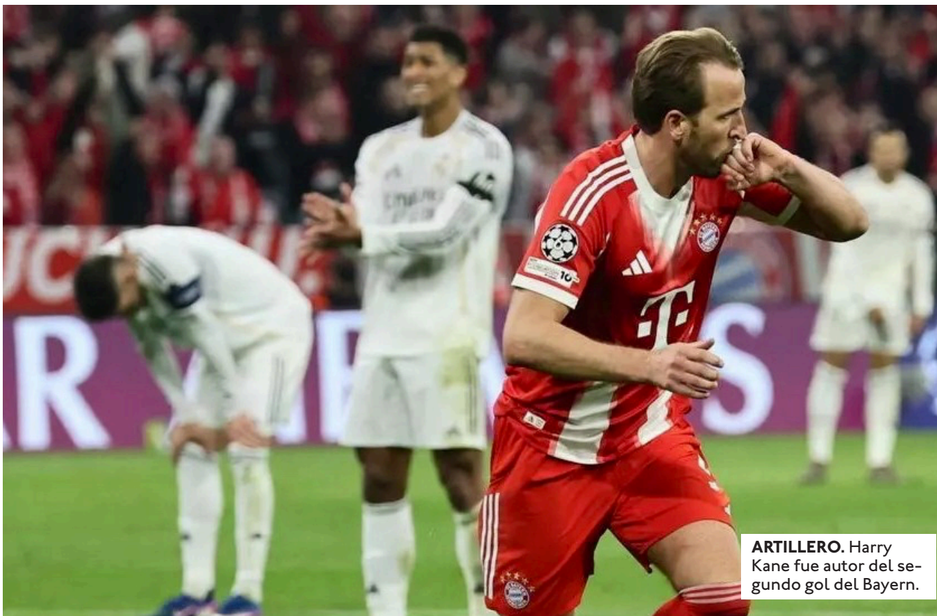
ARTILLERO. Harry Kane fue autor del segundo gol del Bayern.

“UNA DECISIÓN SE HA CARGADO POR COMPLETO EL PARTIDO”, DIJO EL DT DEL MADRID, CONSIDERANDO COMO INJUSTA LA EXPULSIÓN DE CAMAVINGA.