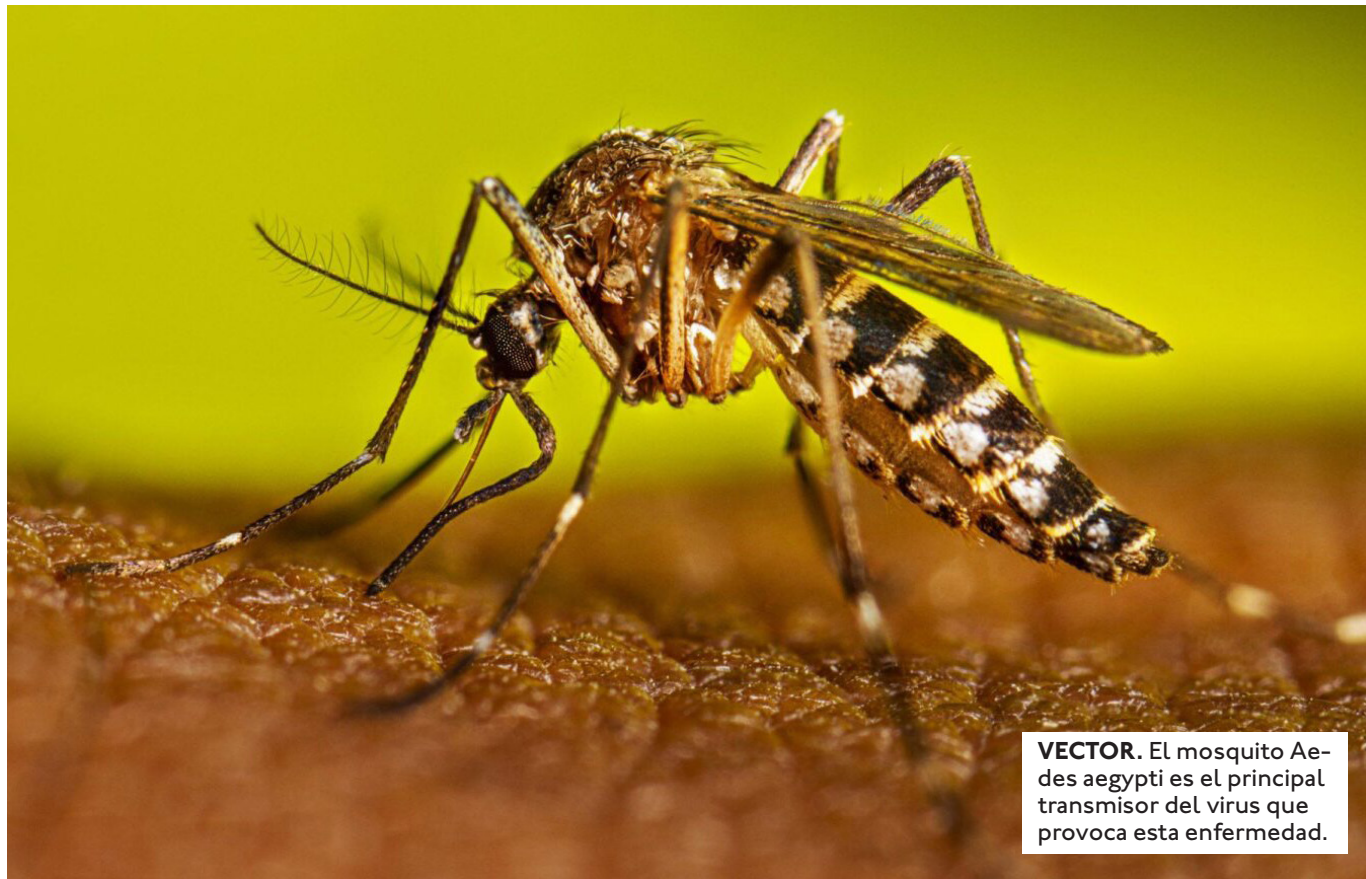
VECTOR. El mosquito Aedes aegypti es el principal transmisor del virus que provoca esta enfermedad.

EN ABRIL DE 2023 SE REGISTRÓ UN CASO AUTÓCTONO EN EL MUNICIPIO DE PUERTO SUÁREZ, EL PRIMERO EN LA ZONA DESPUÉS DE 19 AÑOS.