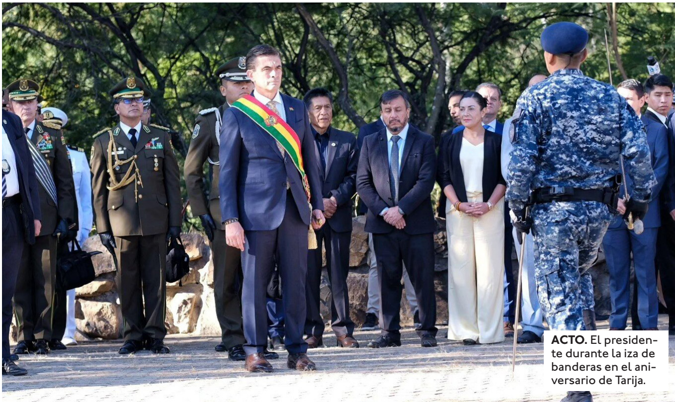
ACTO. El presidente durante la iza de banderas en el aniversario de Tarija.

RODRIGO PAZ PARTICIPÓ DE LOS ACTOS EN TARIJA JUNTO A LOS MINISTROS MAURICIO MEDINACELI, ÉDGAR MORALES, MARCELO SALINAS Y MAURICIO ZAMORA.