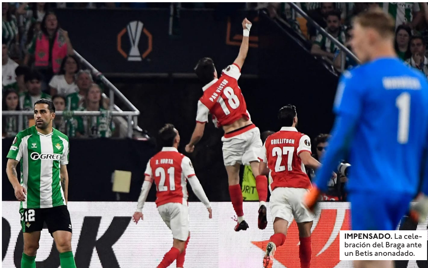
IMPENSADO. La celebración del Braga ante un Betis anonadado.

SHAKHTAR ELIMINÓ AL ALKMAAR Y ENFRENTARÁ EN SEMIFINALES AL CRYSTAL PALACE. RAYO VALLECANO JUGARÁ CON ESTRASBURGO.