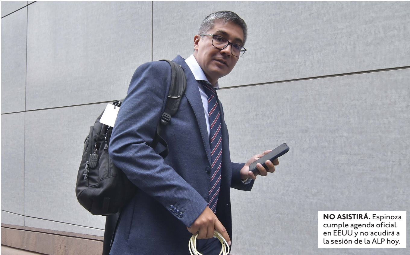
NO ASISTIRÁ. Espinoza cumple agenda oficial en EEUU y no acudirá a la sesión de la ALP hoy.

EL MINISTRO DE HIDROCARBUROS, MAURICIO MEDINACELI, SE SALVÓ DE LA CENSURA EN LA INTERPELACIÓN EL 10 DE ABRIL POR LA COMPRA DE COMBUSTIBLES.