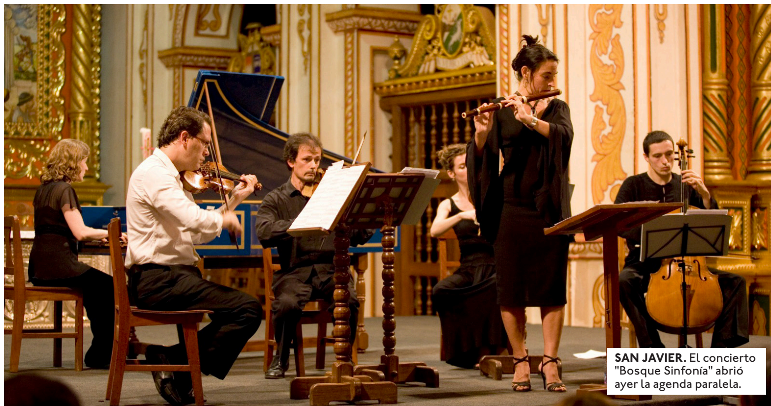
SAN JAVIER. El concierto "Bosque Sinfonía" abrió ayer la agenda paralela.

HISTÓRICO ENCUENTRO. La XIV edición del evento reunirá a más de un millar de músicos provenientes de 16 países.