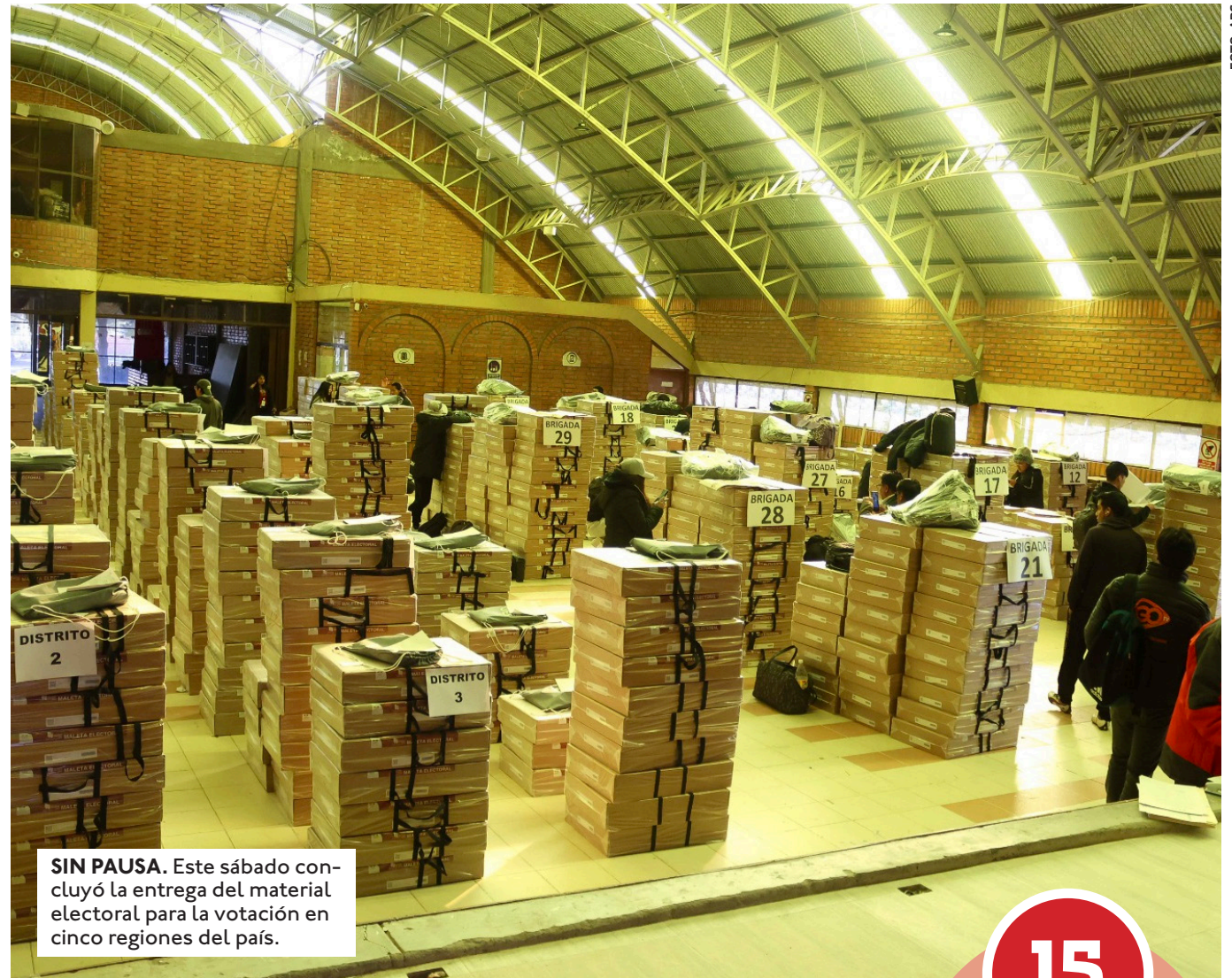
SIN PAUSA. Este sábado concluyó la entrega del material electoral para la votación en cinco regiones del país.

asistiendo a misa en la catedral y luego emitirá su voto en el Colegio Salesiano. Ritter también arrancará el domingo con su participación en la misa en la iglesia La Santa Cruz, luego compartirá un desayuno con periodistas en un hotel y a las 9.00 tiene previsto sufragar en el Colegio Americano. Los desafíos para los nuevos go-