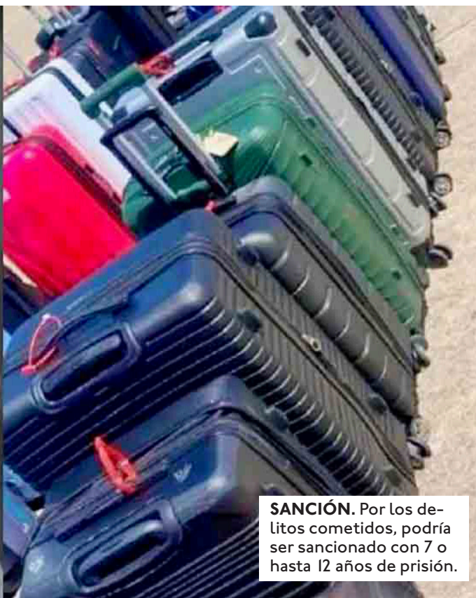
SANCIÓN. Por los delitos cometidos, podría ser sancionado con 7 o hasta 12 años de prisión.