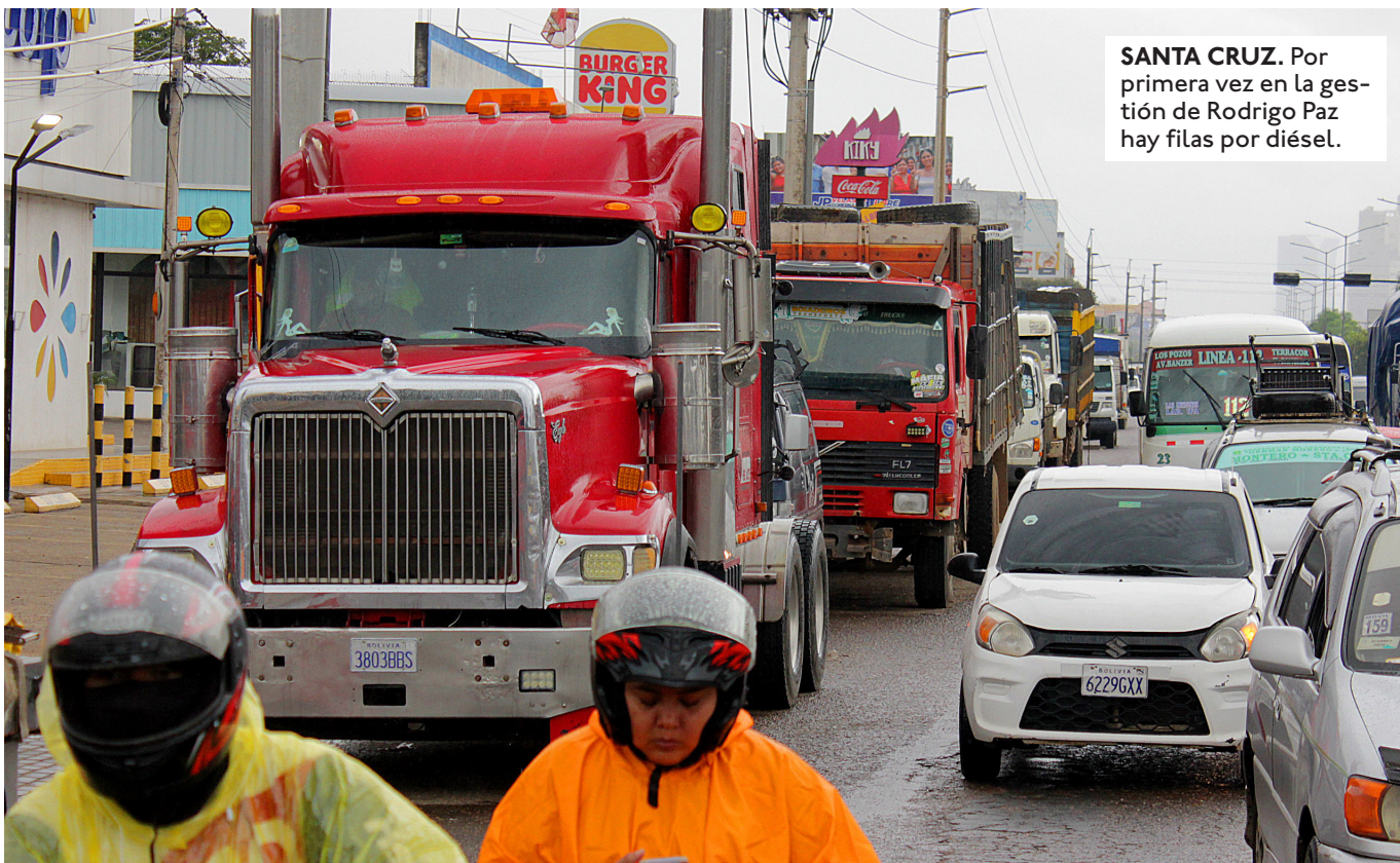
SANTA CRUZ. Por primera vez en la gestión de Rodrigo Paz hay filas por diésel.

LA CÁMARA AGROPECUARIA DEL ORIENTE PIDIÓ AL GOBIERNO DAR SOLUCIÓN AL ABASTECIMIENTO DE DIÉSEL PARA EVITAR PÉRDIDAS EN LA PRODUCCIÓN.