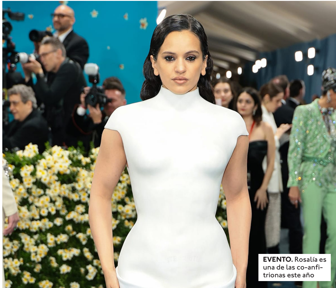
EVENTO. Rosalía es una de las co-anfitrionas este año

Entre los confirmados para desfilarse por las famosas escaleras del Met se encuentran figuras de la talla de Zendaya, Bad Bunny, Taylor Swift y Jennie de BLACKPINK, quien recientemente fue nombrada una de las personas más in-