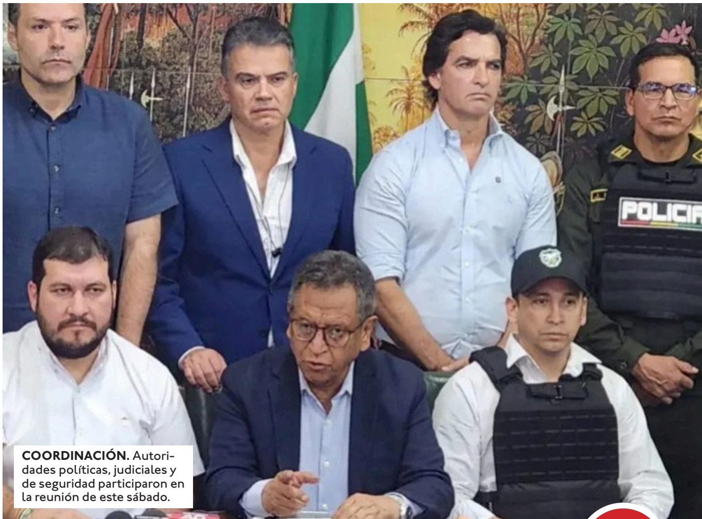
COORDINACIÓN. Autoridades políticas, judiciales y de seguridad participaron en la reunión de este sábado.

Intensificarán operativos. El anuncio se produjo luego de una reunión de emergencia convocada en el Comité pro Santa Cruz, donde participaron representantes del Gobierno, la justicia, el Ministerio Público y autoridades locales. El ministro de Gobierno, Marco Antonio Oviedo, advirtió que se desplegarán operativos intensivos en la capital cruceña, incluyendo redadas y controles en puntos estratégicos. "Está absolutamente prohibido que ciudadanos anden armados en la ciudad. Vamos a tomar acciones radicales para frenar la ola de violencia y sicariatos", afirmó. Entre las principales determinaciones, se acordó solicitar al Ministerio de Defensa que instruya el refuerzo inmediato de las Fuerzas Armadas de Bolivia en zonas fronterizas y regiones identificadas como vulnerables al accionar del crimen organizado. Asimismo, se dispuso la creación de un Grupo Especial Táctico de Lucha contra el Crimen Organizado, que operará inicialmente en Santa Cruz. Según Oviedo, esta unidad estará integrada por personal altamente especializado de la Policía, con formación en la lucha contra el narcotráfico, el terrorismo y redes criminales.