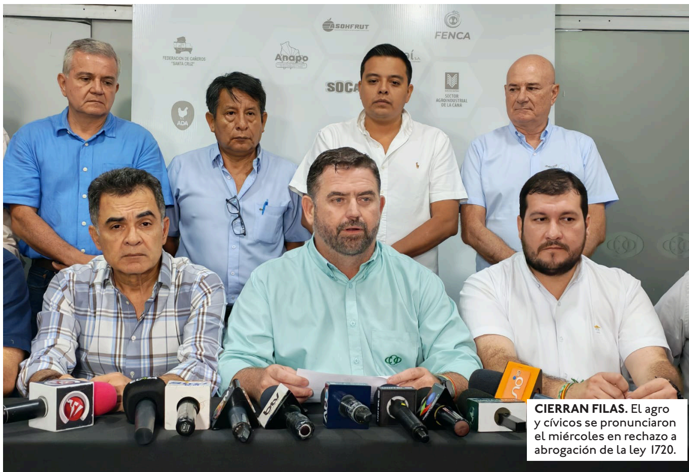
CIERRAN FILAS. El agro y cívicos se pronunciaron el miércoles en rechazo a abrogación de la Ley 1720.

ESTE JUEVES FUE APROBADA EN COMISIÓN LA NORMA PARA ABROGAR LA LEY 1720 Y SE PREVEÍA SU DEBATE EN EL PLENO. EL PROYECTO LO PRESENTÓ CLAUDIA HERBAS.