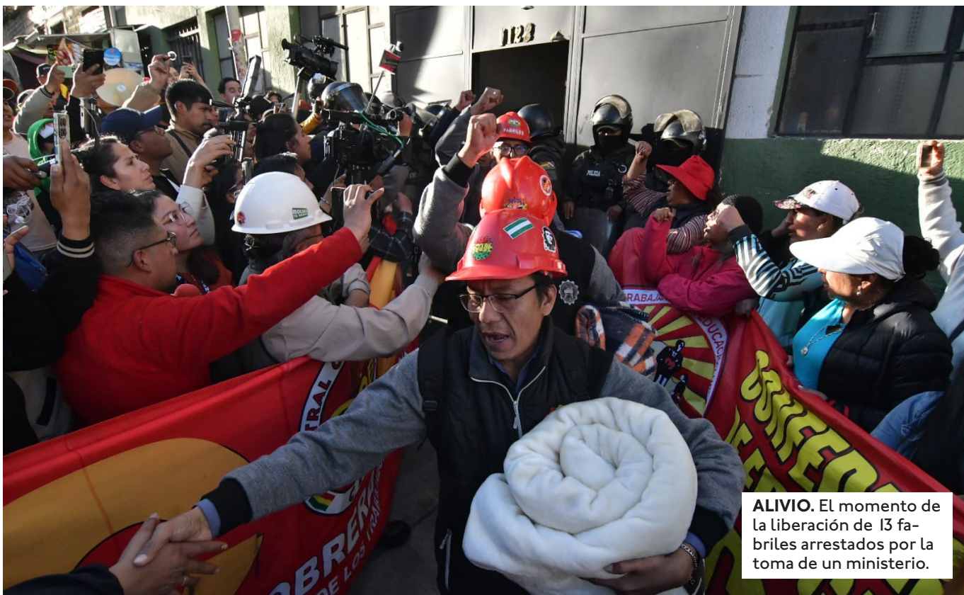
ALIVIO. El momento de la liberación de 13 fabriles arrestados por la toma de un ministerio.

EL DIPUTADO MANOLO ROJAS PRESENTÓ LA QUERRELLA. VE INDICIOS DE FRAUDE EN EL COBRO DE SU PENSIÓN DE INVALIDEZ. HIZO UN PRIMER COBRO DE BS 141.000.