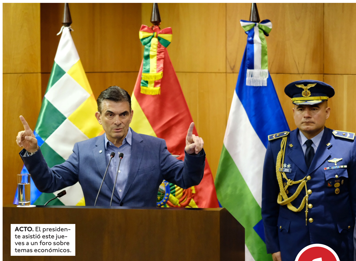
ACTO. El presidente asistió este jueves a un foro sobre temas económicos.

"La agenda está establecida, absolutamente abierta al debate, como debe ser todo lo que signifique proyectos de ley en cuanto a hidrocarburos, minería, inversión, energía, Bolivia verde. Hay que encarar una serie de reformas