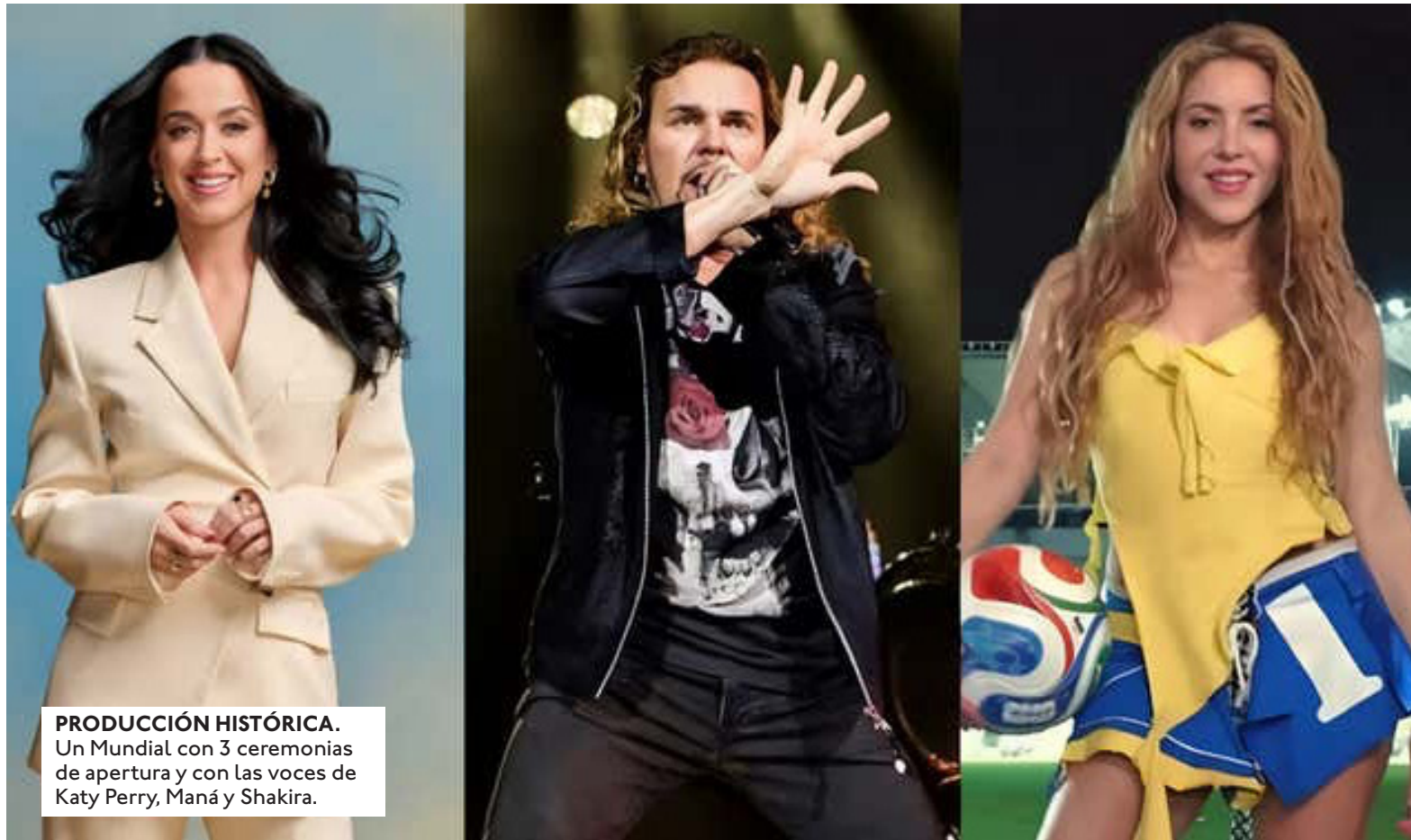
PRODUCCIÓN HISTÓRICA. Un Mundial con 3 ceremonias de apertura y con las voces de Katy Perry, Maná y Shakira.

FIFA. Con un "line-up" que incluye el regreso de la reina de los mundiales y el poder del rock en español, el evento promete ser el show más visto.