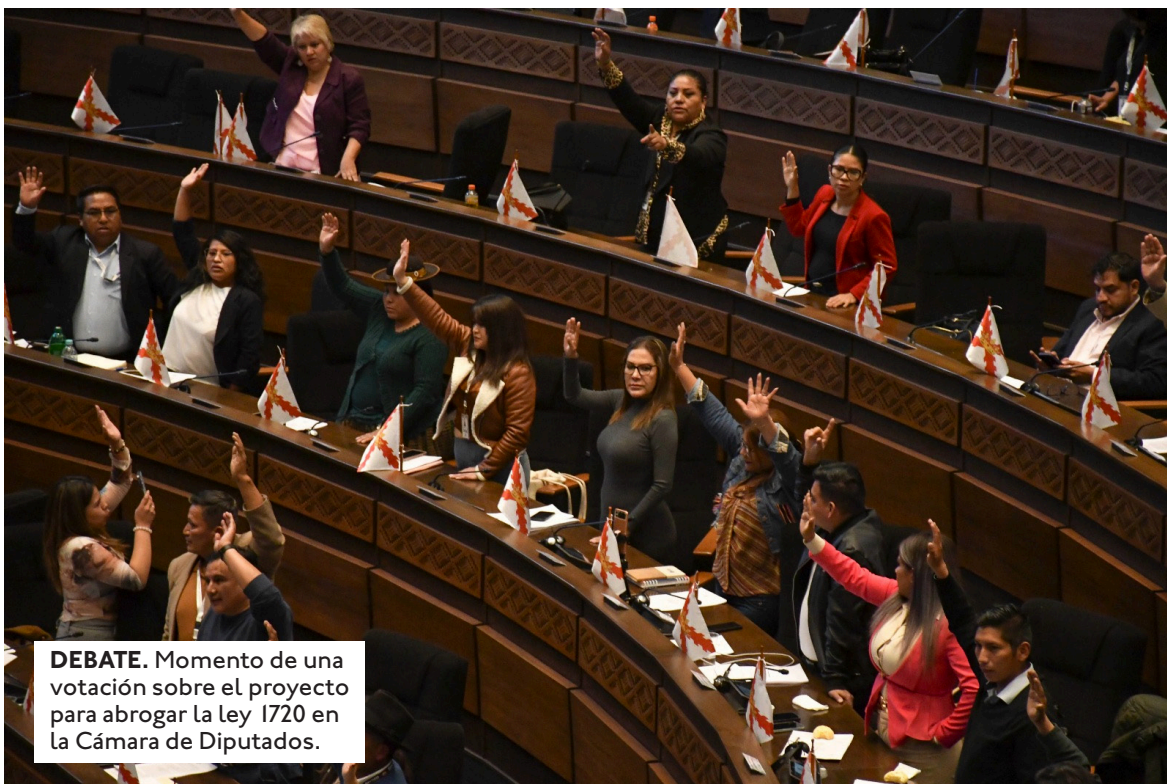
DEBATE. Momento de una votación sobre el proyecto para abrogar la ley 1720 en la Cámara de Diputados.