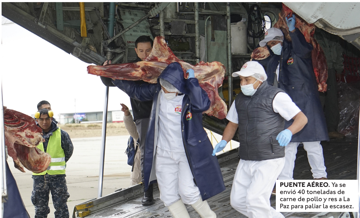
PUENTE AÉREO. Ya se envió 40 toneladas de carne de pollo y res a La Paz para paliar la escasez.

EN LA BIMODAL DE SANTA CRUZ NO VENDEN PASAJES A LA PAZ. EN LA SEDE DE GOBIERNO NO HAY SALIDAS A NINGÚN DESTINO.