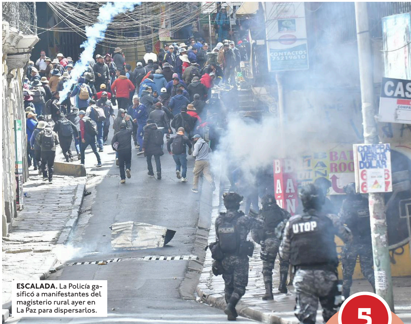
ESCALADA. La Policía gaseificó a manifestantes del magisterio rural ayer en La Paz para dispersarlos.

Suman pedidos. Este miércoles, integrantes del magisterio rural se enfrentaron a la Policía en el Ministerio de Trabajo. Hubo gaseificación de la Policía para dispersarlos, pero al final un grupo de dirigentes ingresó hasta esa cartera de Estado para dejar su pliego petitorio. Un dirigente precisó que el pedido de incremento salarial es de 30 %, 10 % más de lo que venían pidiendo la Central Obrera Boliviana (COB) y los propios maestros. "Estamos