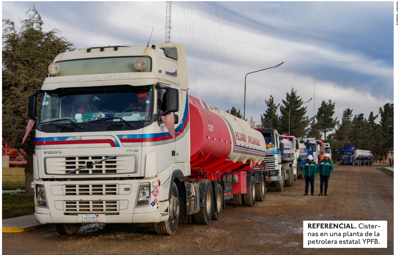
REFERENCIAL. Cisternas en una planta de la petrolera estatal YPFB.

"NO HAY MOTIVOS PARA SEGUIR BLOQUEANDO", SEÑALÓ LA ENTIDAD CRUCEÑA, QUE PIDIÓ QUE LAS DEMANDAS Y EL DEBATE PASEN A LA ALP.