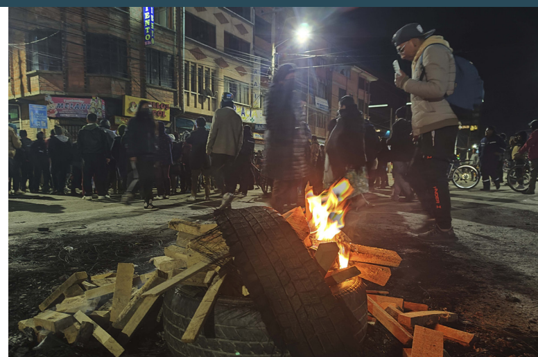
RÍO SECO. El martes hubo vandalismo y amenaza de saqueos.

pública, ya que este insumo es indispensable para pacientes con enfermedades respiratorias y otras patologías. En La Paz persiste la falta de carnes y verduras. En el mercado Rodríguez el kilo de pollo subió a Bs 32. Una comerciante señaló que desde el pasado viernes no reciben verduras. El sector avícola reporta ya pérdidas de Bs 35 millones en producción de pollos, huevos y pollitos BB. Los bloqueos han distorsionado los mercados, ya que abarataron los costos en Santa Cruz a Bs 16 el kilo. Productores afirman que están perdiendo 8 bolivianos por pollo que venden a bajo precio.