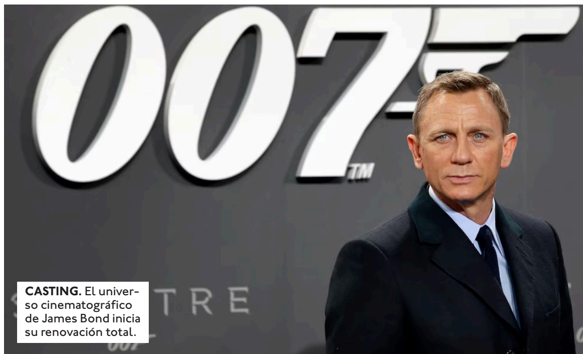
CASTING. El universo cinematográfico de James Bond inicia su renovación total.

Un perfil sumamente específico y restrictivo. A diferencia de otros procesos de selección en Hollywood, donde los directores de casting suelen mantener un abanico amplio de opciones, los responsables de la franquicia Bond han impuesto directrices demográficas y físicas sumamente estrictas para