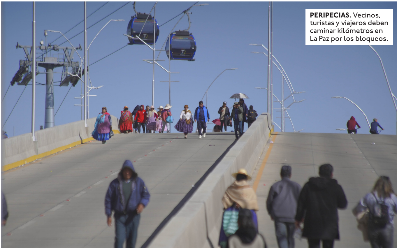
PERIPECIAS. Vecinos, turistas y viajeros deben caminar kilómetros en La Paz por los bloqueos.