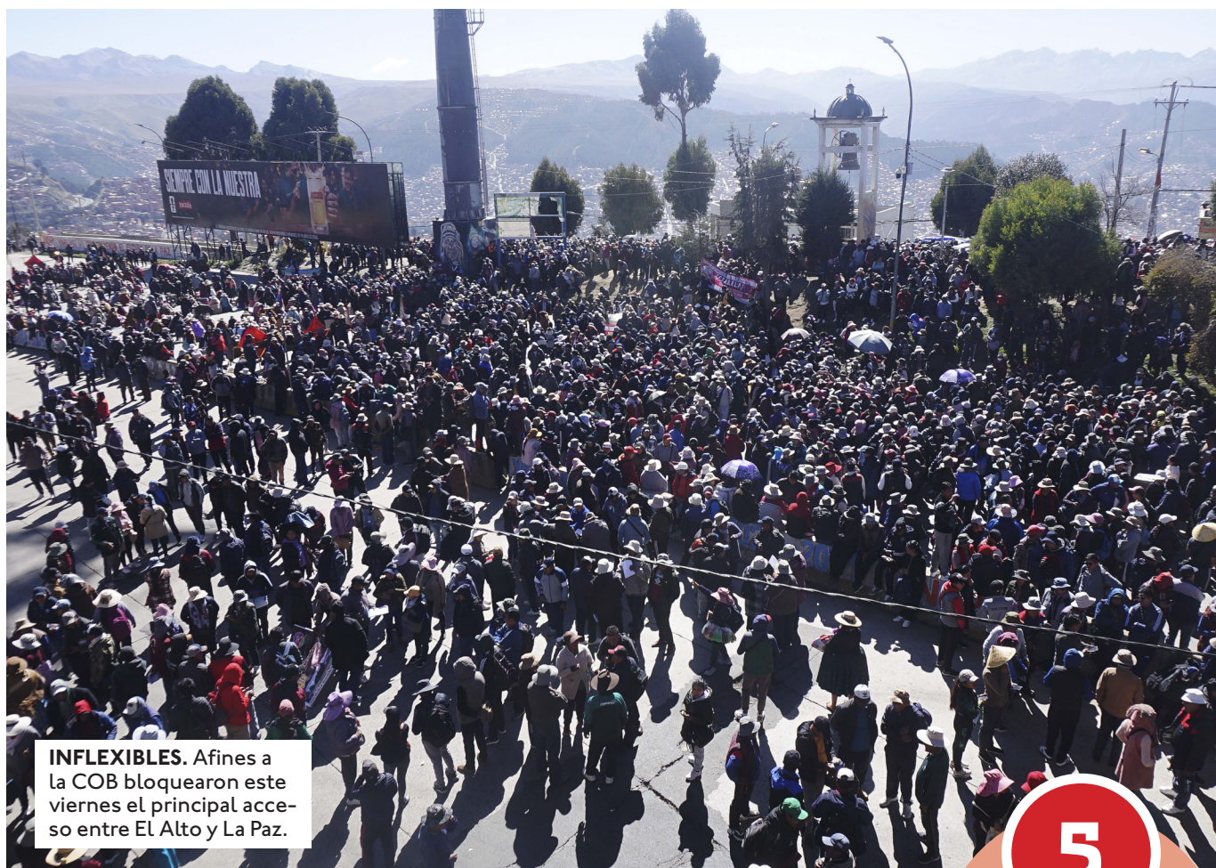
INFLEXIBLES. Afines a la COB bloquearon este viernes el principal acceso entre El Alto y La Paz.

Panorama del conflicto. Tras un jueves violento, por los enfrentamientos entre cooperativistas y