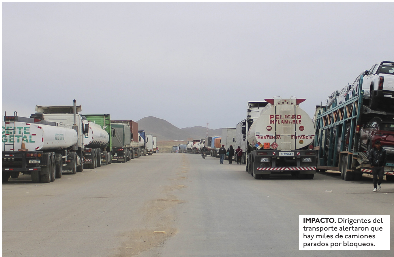
IMPACTO. Dirigentes del transporte alertaron que hay miles de camiones parados por bloqueos.

VENDEDORAS DE LOS MERCADOS VILLA ADELA EN EL ALTO Y RODRÍGUEZ EN LA PAZ NO GARANTIZABAN LA LLEGADA DE VARIOS PRODUCTOS POR LOS BLOQUEOS.