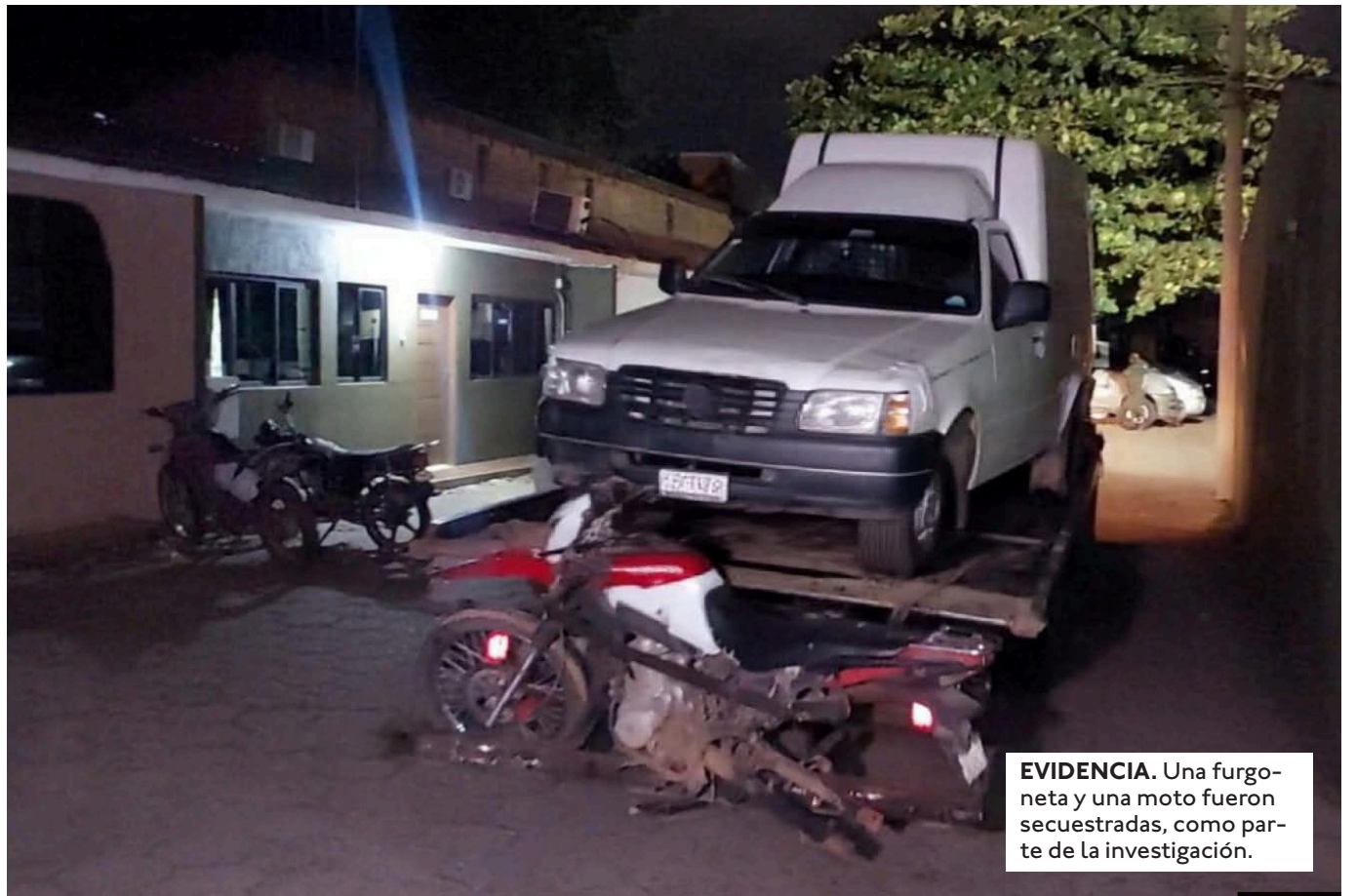
EVIDENCIA. Una furgoneta y una moto fueron secuestradas, como parte de la investigación.