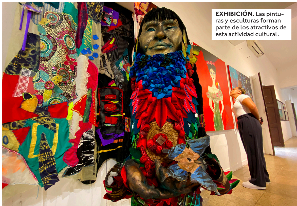
EXHIBICIÓN. Las pinturas y esculturas forman parte de los atractivos de esta actividad cultural.