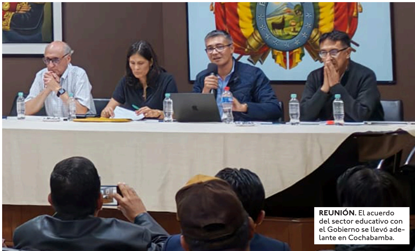
REUNIÓN. El acuerdo del sector educativo con el Gobierno se llevó adelante en Cochabamba.

LA MINISTRA DE EDUCACIÓN, BEATRIZ GARCÍA, ANUNCIÓ QUE EL GOBIERNO PREVE APROBAR EN CINCO DÍAS UN DECRETO SUPREMO PARA FORMALIZAR LOS ACUERDOS ALCANZADOS