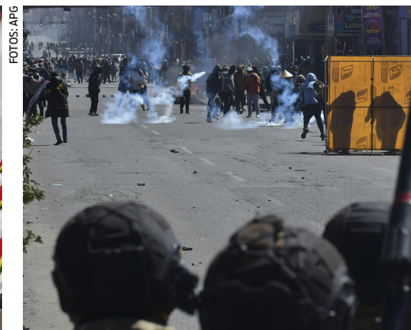
TENSIÓN. Durante el desbloqueo las fuerzas del orden optaron por no utilizar armas letales.