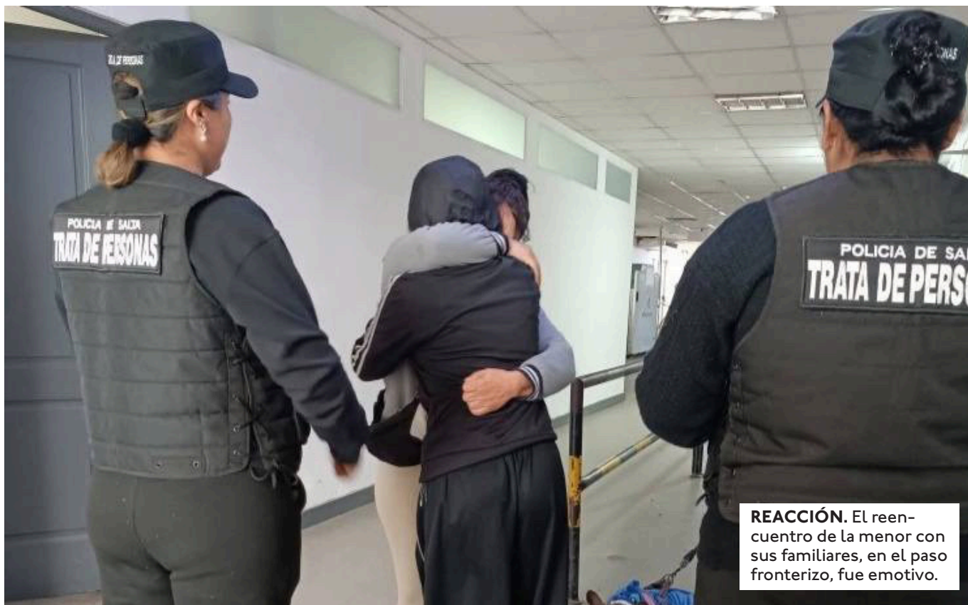
REACCIÓN. El reencontro de la menor con sus familiares, en el paso fronterizo, fue emotivo.

LAS INVESTIGACIONES CONTINÚAN ANTE LA POSIBLE EXISTENCIA DE MÁS VÍCTIMAS Y OTROS INTEGRANTES DE LA PRESUNTA RED DE TRATA Y EXPLOTACIÓN SEXUAL.