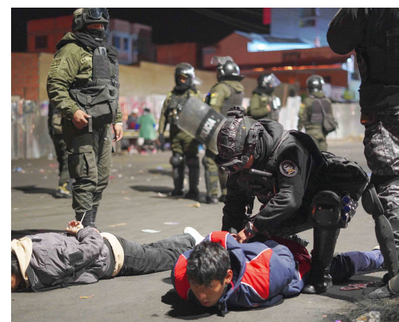
ARRESTOS. Efectivos de la Policía arrestaron a más de 20 personas en diferentes puntos de conflicto.

EN JORNADA TENSA DE APERTURA DE "CORREDOR HUMANITARIO"