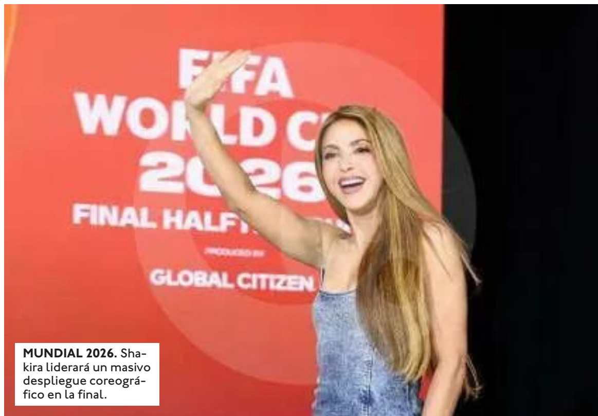
MUNDIAL 2026. Shakira liderará un masivo despliegue coreográfico en la final.

Los estrictos parámetros de la selección artística. La información oficial provista por los organizadores del espectáculo subraya que el proceso de selección constará de varias etapas rigurosas debido a la naturaleza del escenario. Los aspirantes deben poseer un