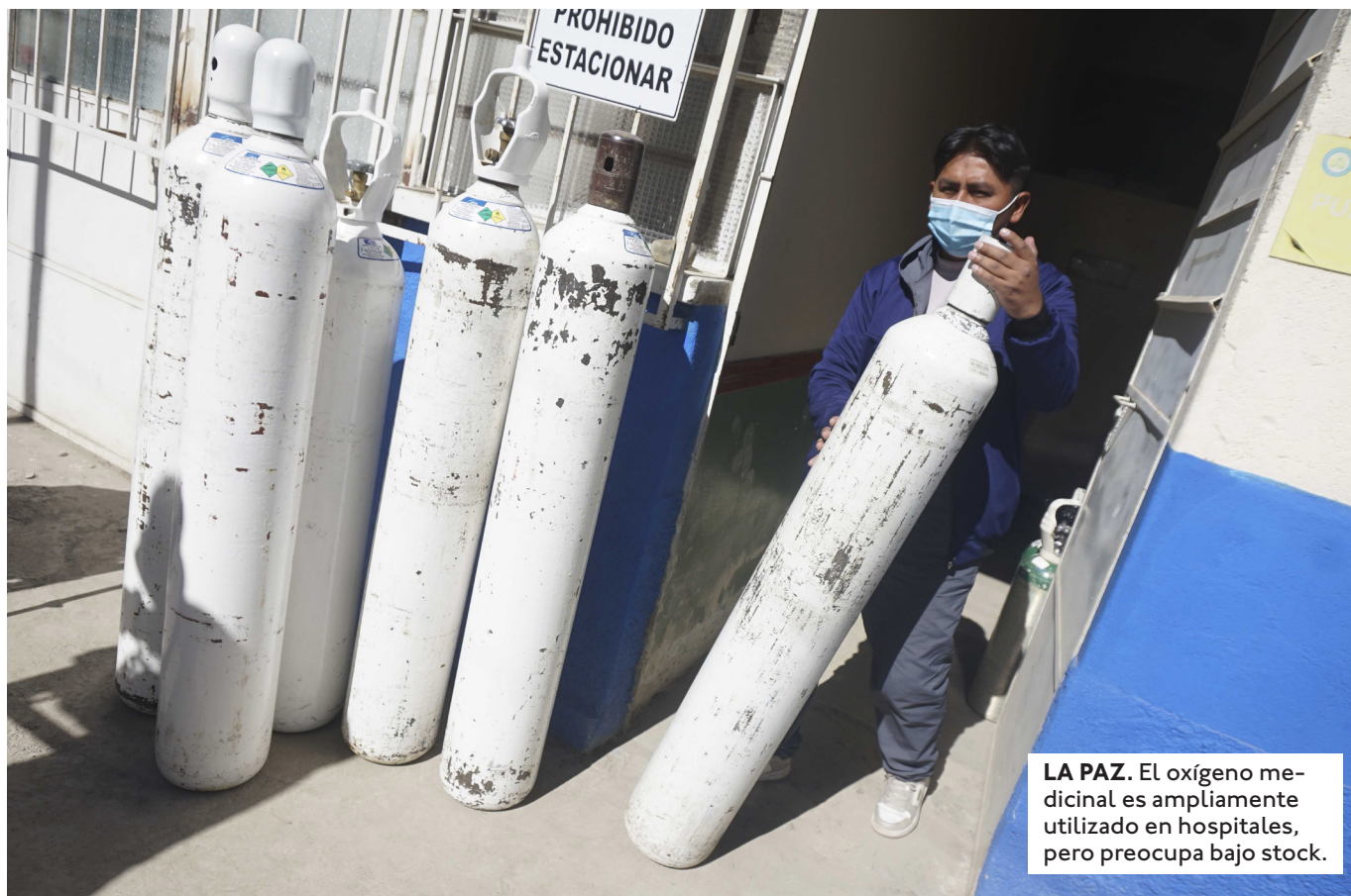
LA PAZ. El oxígeno medicinal es ampliamente utilizado en hospitales, pero preocupa bajo stock.

LOS PRODUCTORES DE FLORES DE COCHABAMBA NO PUEDEN HACER ENVÍOS A OTRAS REGIONES, EN ÉPOCA DE ALTA DEMANDA POR EL DÍA DE LA MADRE.