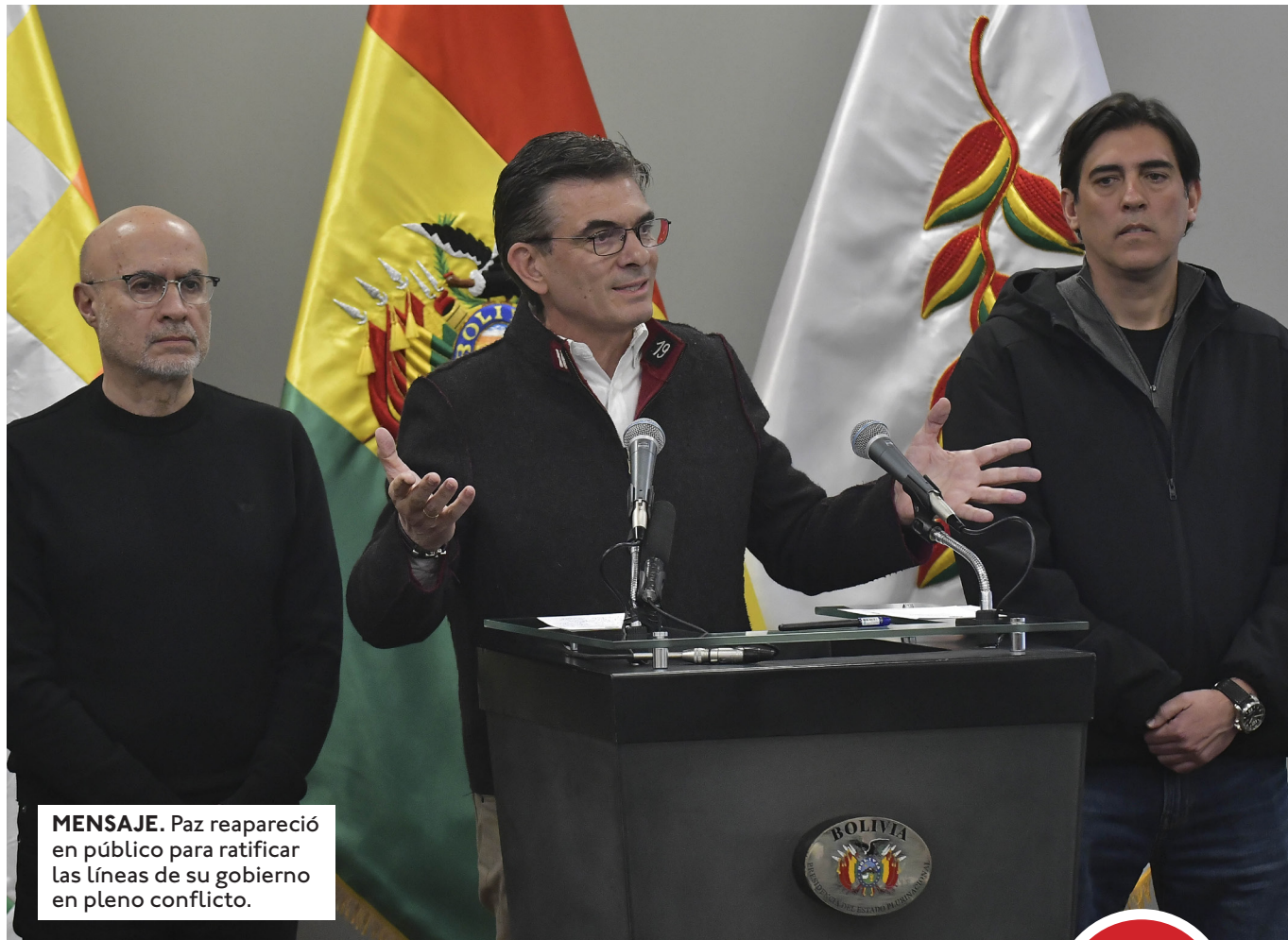
MENSAJE. Paz reapareció en público para ratificar las líneas de su gobierno en pleno conflicto.

Además pidió a los bloqueadores que abran un corredor humanitario para el paso de alimentos, oxí-