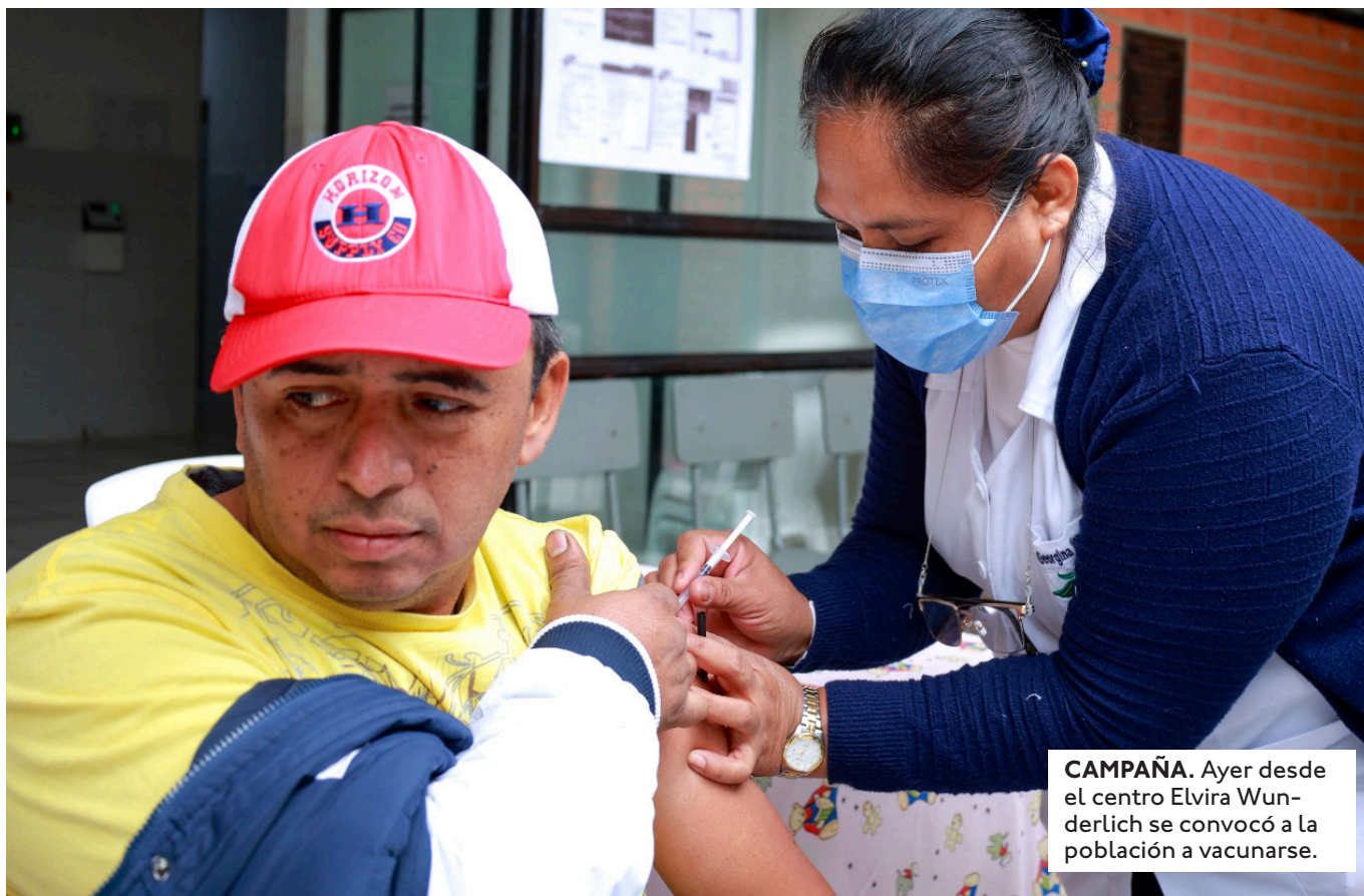
CAMPAÑA. Ayer desde el centro Elvira Wunderlich se convocó a la población a vacunarse.

ESTÁ INTERNADA EN EL HOSPITAL DE NIÑOS MARIO ORTIZ SUÁREZ. INGRESÓ HACE 13 DÍAS Y CONFIRMARON QUE PADECE ESTA ENFERMEDAD.