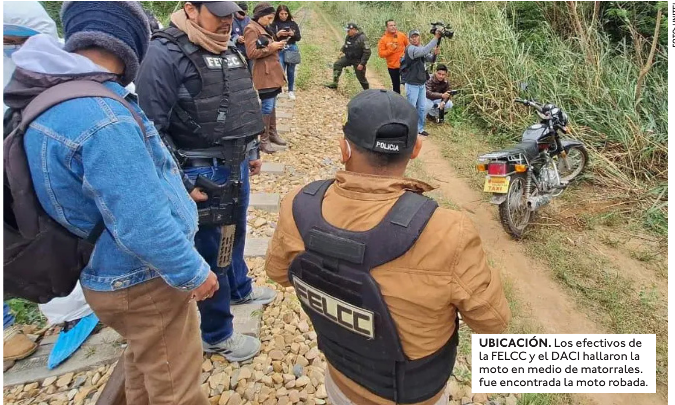
UBICACIÓN. Los efectivos de la FELCC y el DACI hallaron la moto en medio de matorrales. Fue encontrada la moto robada.

COMBINABA SU TRABAJO COMO REPARTIDOR, CON SUS ESTUDIOS DE AGROPECUARIA EN EL INSTITUTO TÉCNICO DE PORTACHUELO (ITAP).