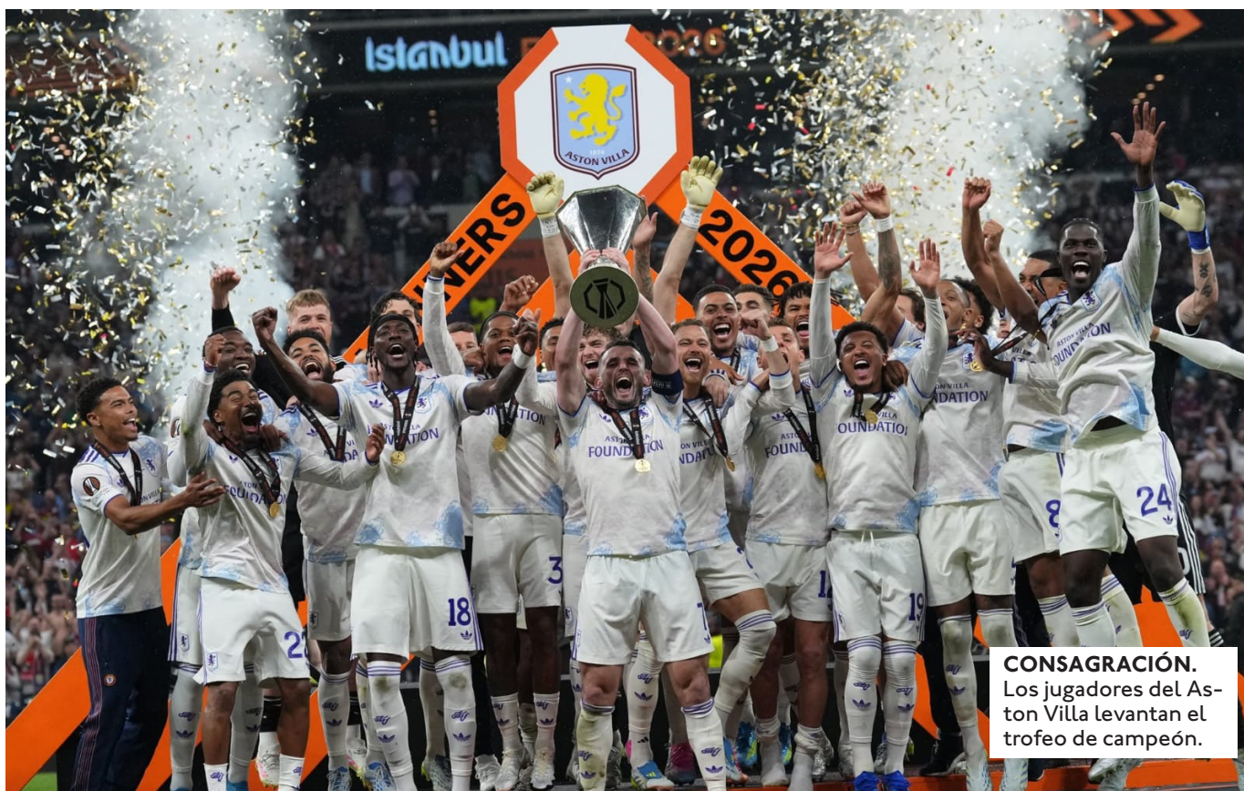
CONSAGRACIÓN. Los jugadores del Aston Villa levantan el trofeo de campeón.

TRAS CORONARSE CAMPEÓN CON ASTON VILLA, EL ARQUERO ARGENTINO REVELÓ QUE SE QUEBRÓ UN DEDO DE LA MANO EN LA ETAPA DE CALENTAMIENTO.