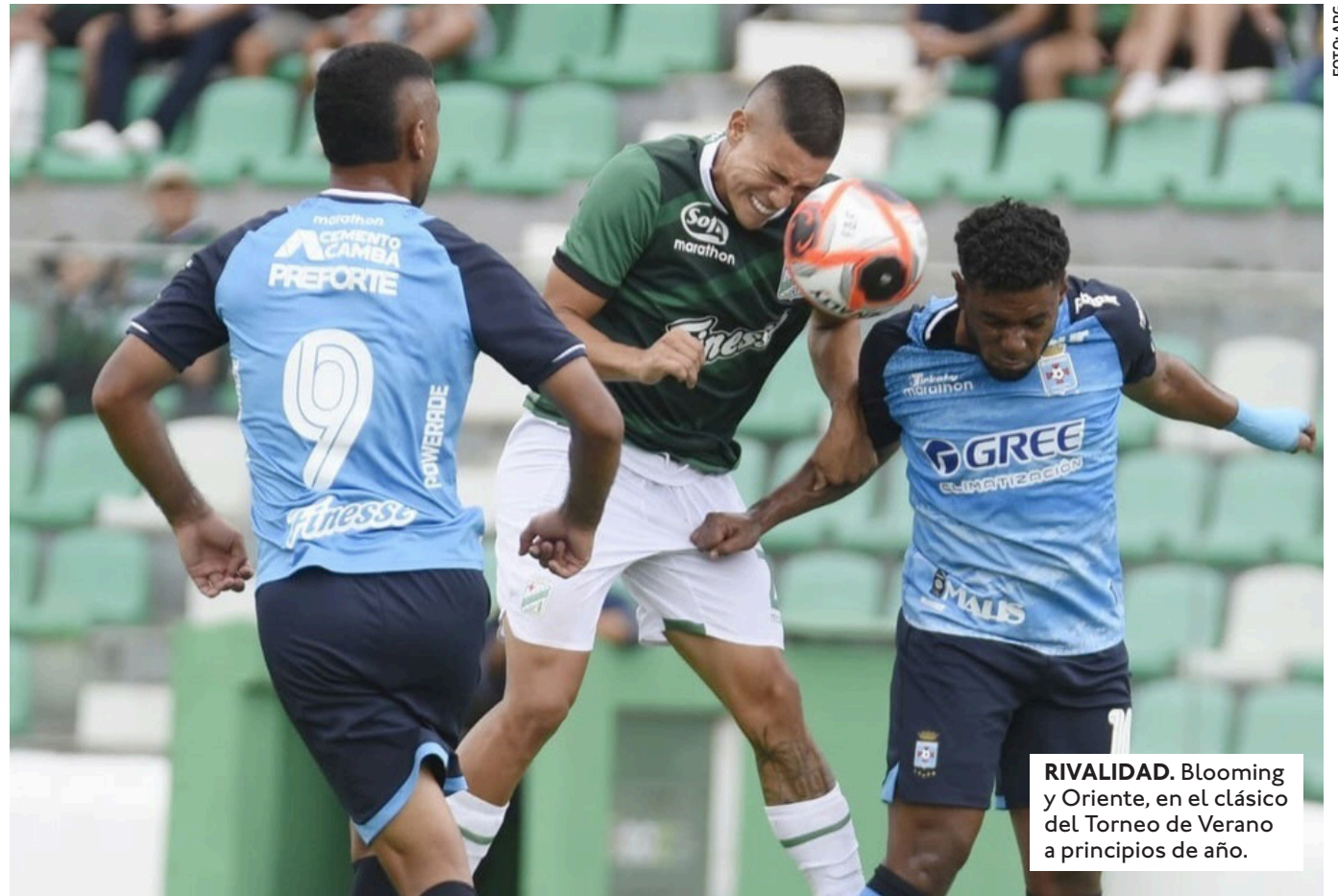
RIVALIDAD. Blooming y Oriente, en el clásico del Torneo de Verano a principios de año.

EL PRESIDENTE DE ORIENTE INDICÓ QUE YA LE SOLICITARON NEGOCIAR LA CONTINUIDAD, PERO DEPENDERÁ DEL JUGADOR SI QUIERE SEGUIR DESPUÉS DEL CLÁSICO.