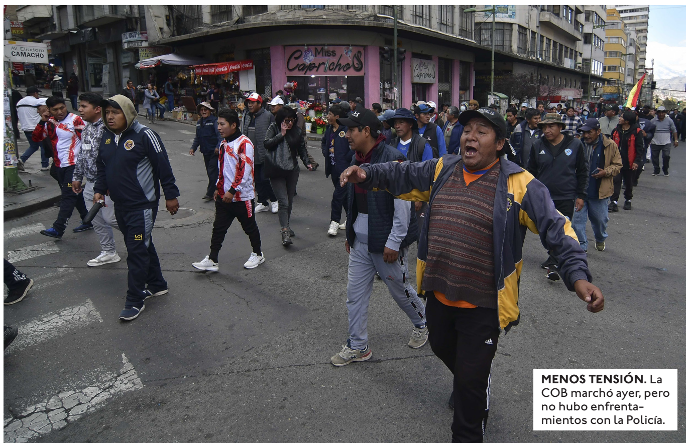
MENOS TENSIÓN. La COB marchó ayer, pero no hubo enfrentamientos con la Policía.

AGROPECUARIOS, TRANSPORTISTAS, GREMIALES, TEXTILEROS, AVÍCOLAS, PYMES Y FARMACÉUTICOS, ENTRE OTROS REPORTAN GRANDES PÉRDIDAS.