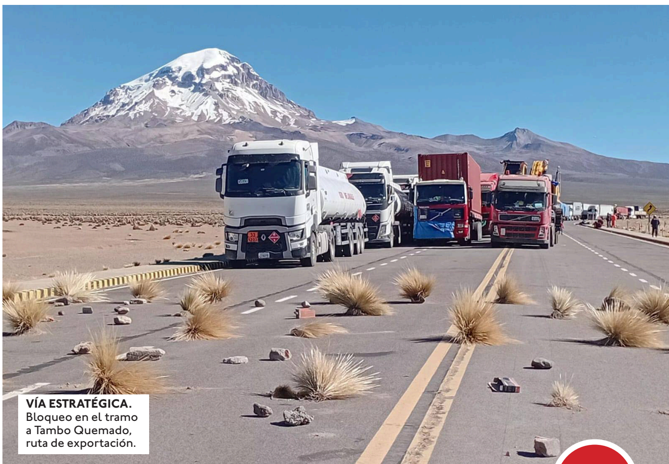
VÍA ESTRATÉGICA. Bloqueo en el tramo a Tambo Quemado, ruta de exportación.

Panorama de los bloqueos. El país amaneció el viernes con 75 puntos de bloqueo, según el monitoreo de la Administradora Boliviana de Carreteras (ABC). La