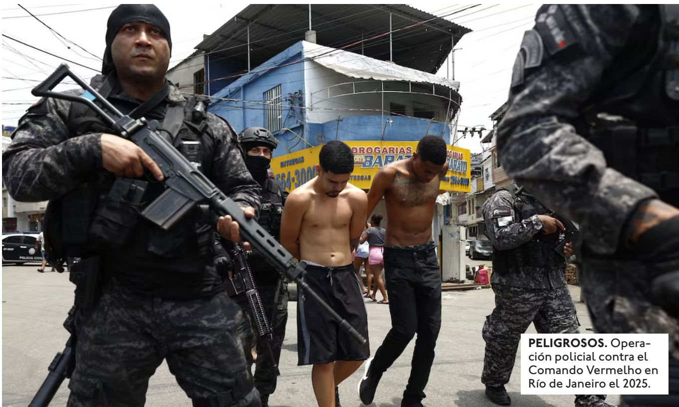
PELIGROSOS. Operación policial contra el Comando Vermelho en Río de Janeiro el 2025.