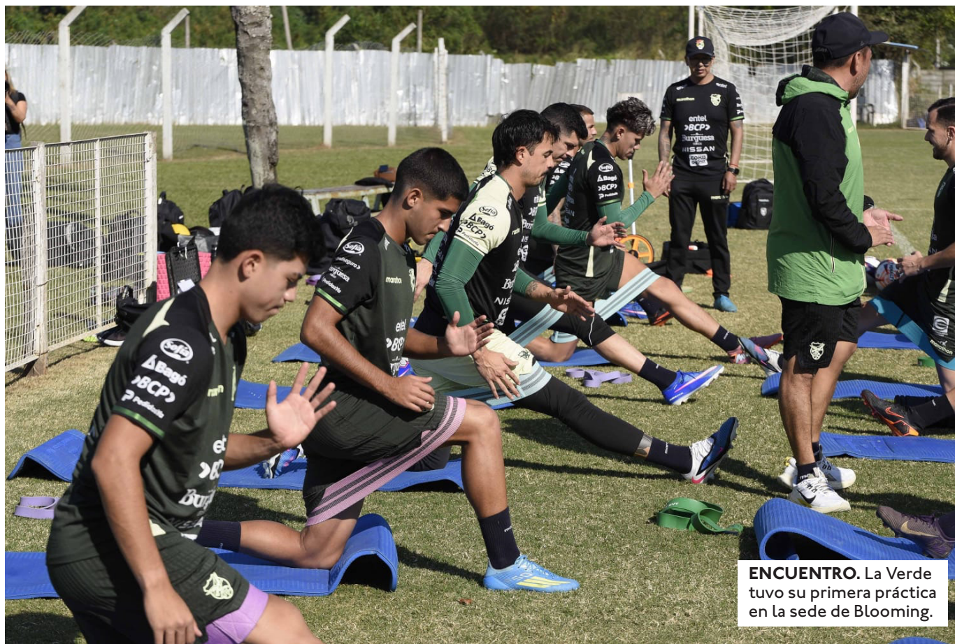
ENCUENTRO. La Verde tuvo su primera práctica en la sede de Blooming.

ENFRENTARÁ A GREMIO EN PARTIDOS DE IDA Y VUELTA. EL PRIMER DUELO ESTÁ PROGRAMADO PARA EL 21 DE JULIO EN LA PAZ.