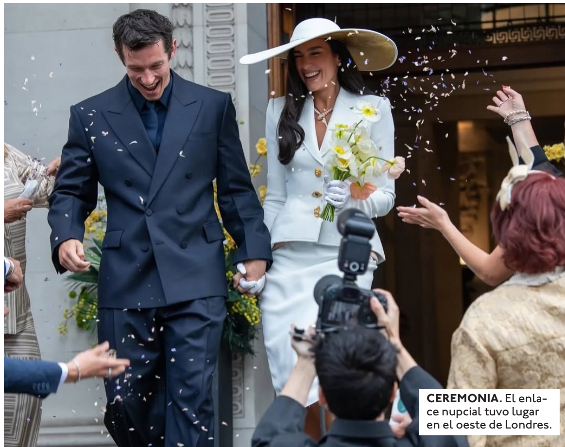
CEREMONIA. El enlace nupcial tuvo lugar en el oeste de Londres.

Elegancia minimalista y el hermetismo de los novios. La prensa de espectáculos y los críticos de moda han comenzado a desvelar los primeros detalles estéticos de la velada. Fiel a su estilo vanguardista pero sofisticado, la intérprete de "Levitating" lució un diseño nupcial clásico con toques modernos que se alejó de los excesos deco-