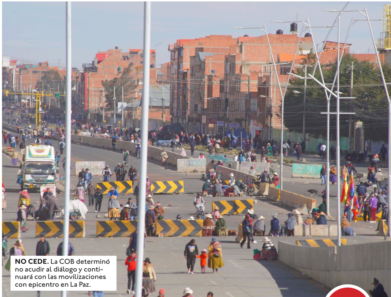
NO CEDE. La COB determinó no acudir al diálogo y continuará con las movilizaciones con epicentro en La Paz.

El monitoreo que realiza la Administradora Boliviana de Carreteras (ABC) reveló que en esta jornada se mantenían 94 puntos de bloqueo a nivel nacional. La Paz, la