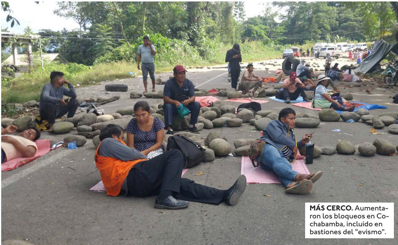
MÁS CERCO. Aumentaron los bloqueos en Cochabamba, incluido en bastiones del "evismo".