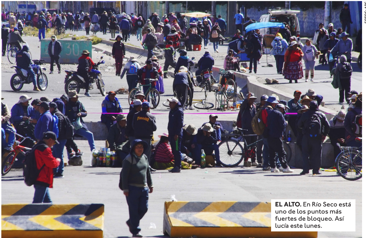
EL ALTO. En Río Seco está uno de los puntos más fuertes de bloqueo. Así lucía este lunes.

POCAS VENTAS, PUESTOS VACÍOS, ESCASEZ DE PRODUCTOS. ESE ES EL PANORAMA EN MERCADOS DE LA PAZ. GREMIALES PIDEN SOLUCIÓN