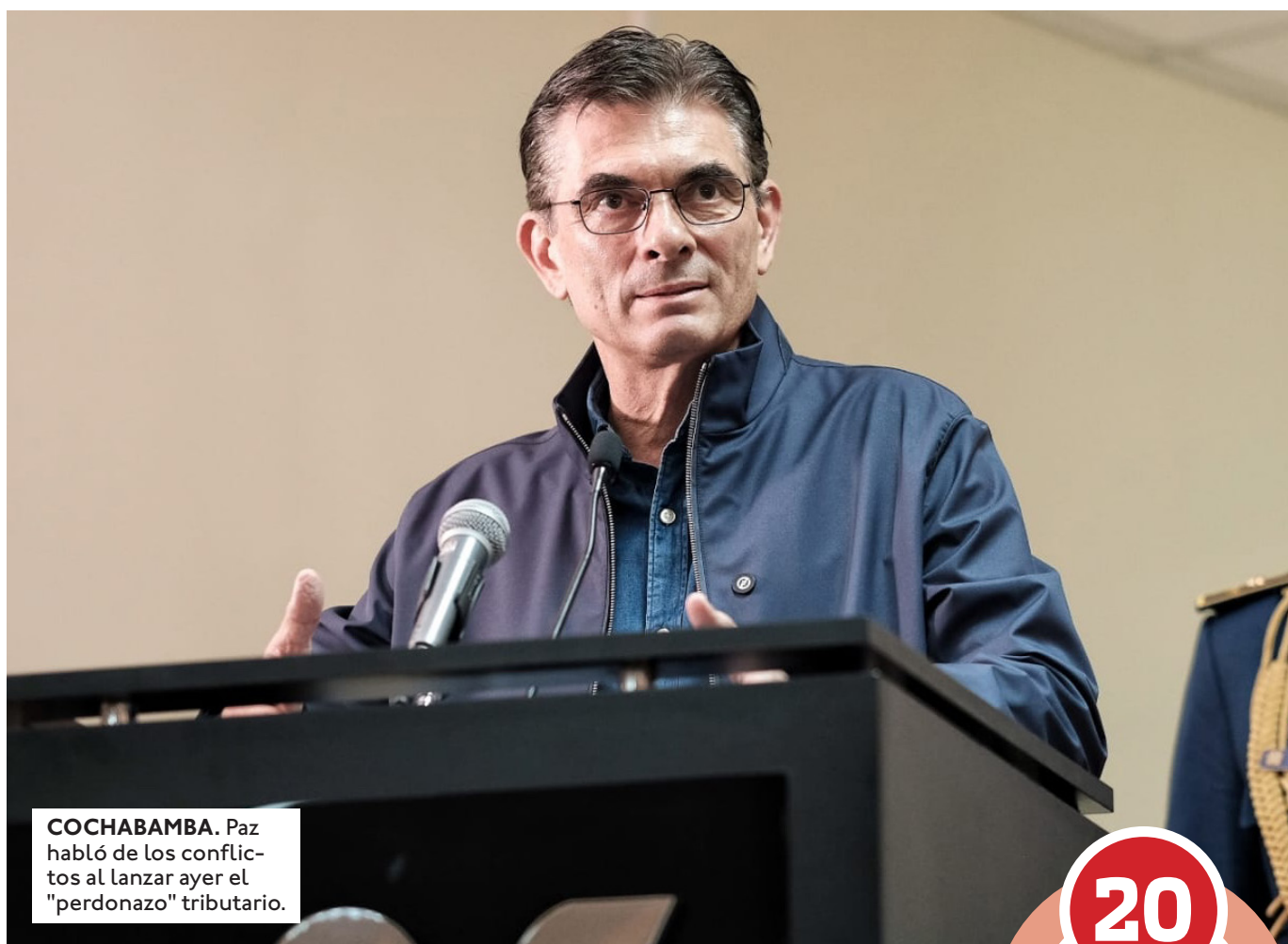
COCHABAMBA. Paz habló de los conflictos al lanzar ayer el "perdonazo" tributario.