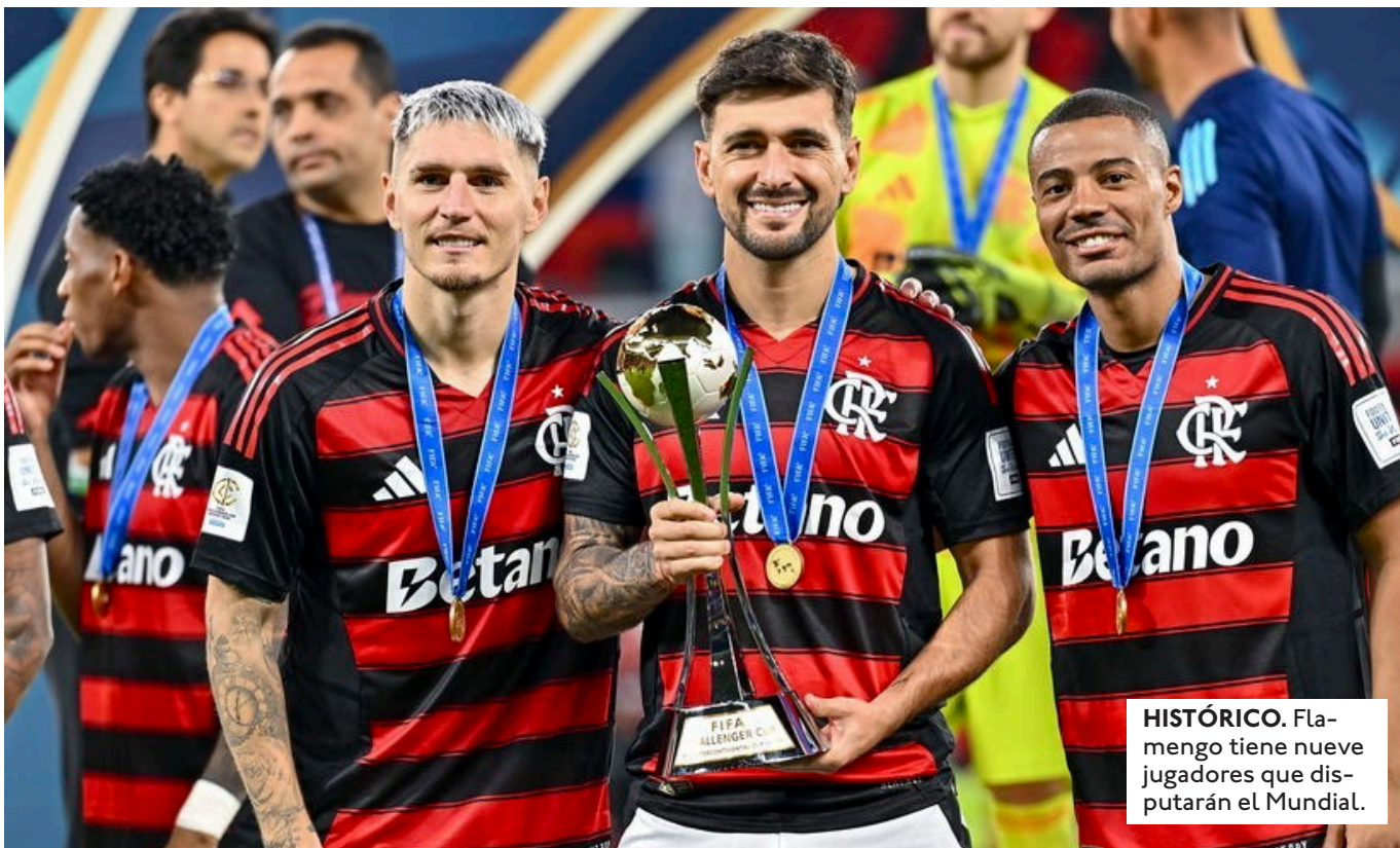
HISTÓRICO. Flamengo tiene nueve jugadores que disputarán el Mundial.

LUEGO DE APLASTAR 6-2 A PANAMÁ, LA SELECCIÓN DE BRASIL TRABAJA PARA ENFRENTAR A EGIPTO EL PRÓXIMO 6 DE JUNIO, ANTES DE AFRONTAR EL MUNDIAL.