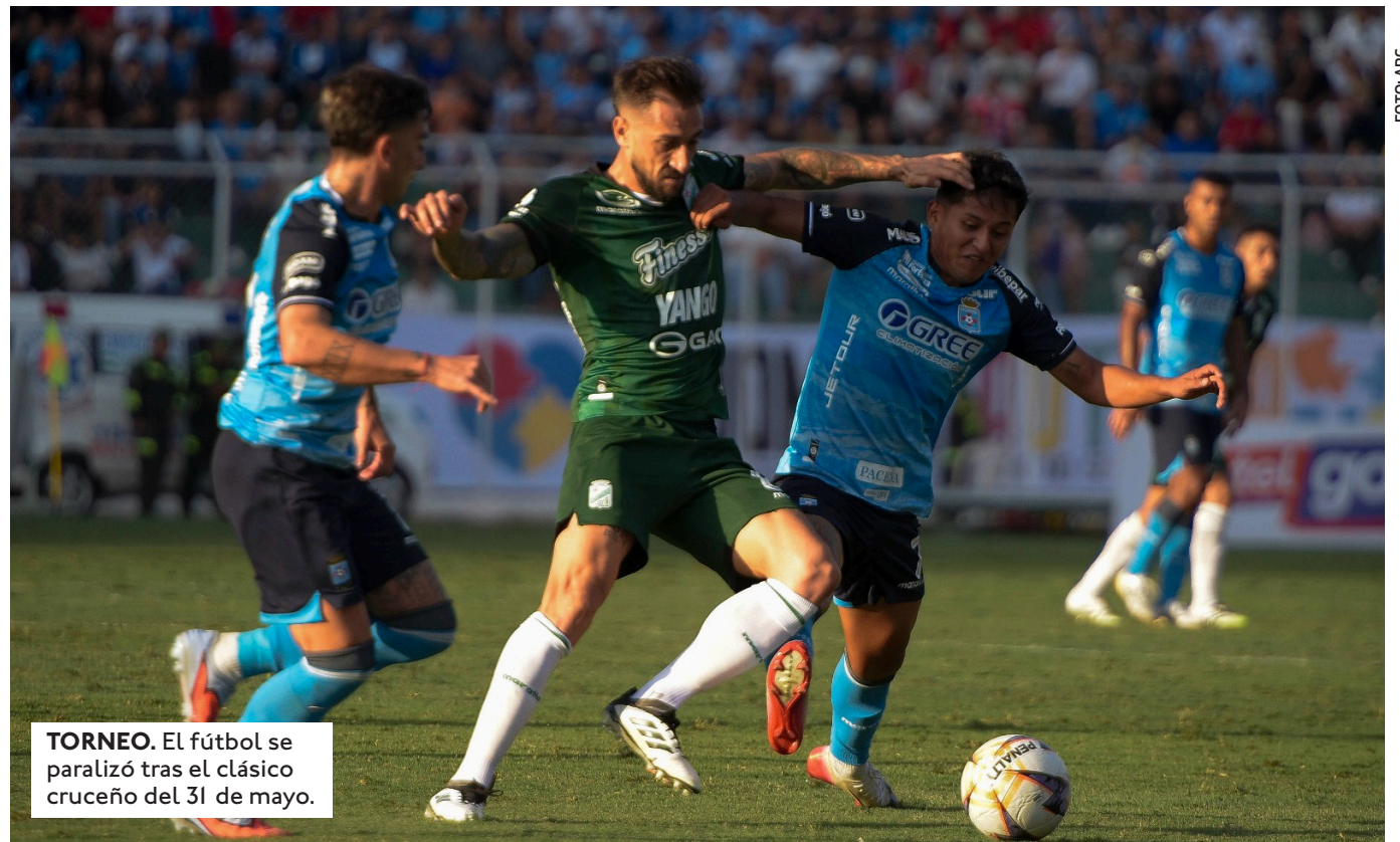
TORNEO. El fútbol se paralizó tras el clásico cruceño del 31 de mayo.

LA COPA DE LA DIVISIÓN PROFESIONAL DEBÍA INICIAR EN PARALELO, PERO LOS CONFLICTOS SOCIALES TAMBIÉN REPERCUTEN EN ESTE TORNEO SERIADO.