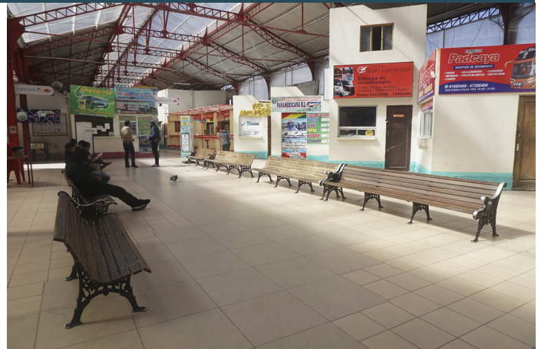
TERMINAL DESIERTA. Empresas de buses, golpeadas por bloqueos.

CEPB insistió en la necesidad de que el gobierno tome acciones bajo el amparo de la ley para poner orden. "Corresponde a las instituciones del Estado asumir plenamente sus prerrogativas constitucionales y ejercer, en el marco de la Ley y de sus mandatos, todas las acciones necesarias para restablecer el orden, garantizar los derechos de la población y preservar la estabilidad del país", emplazó la institución. / AA