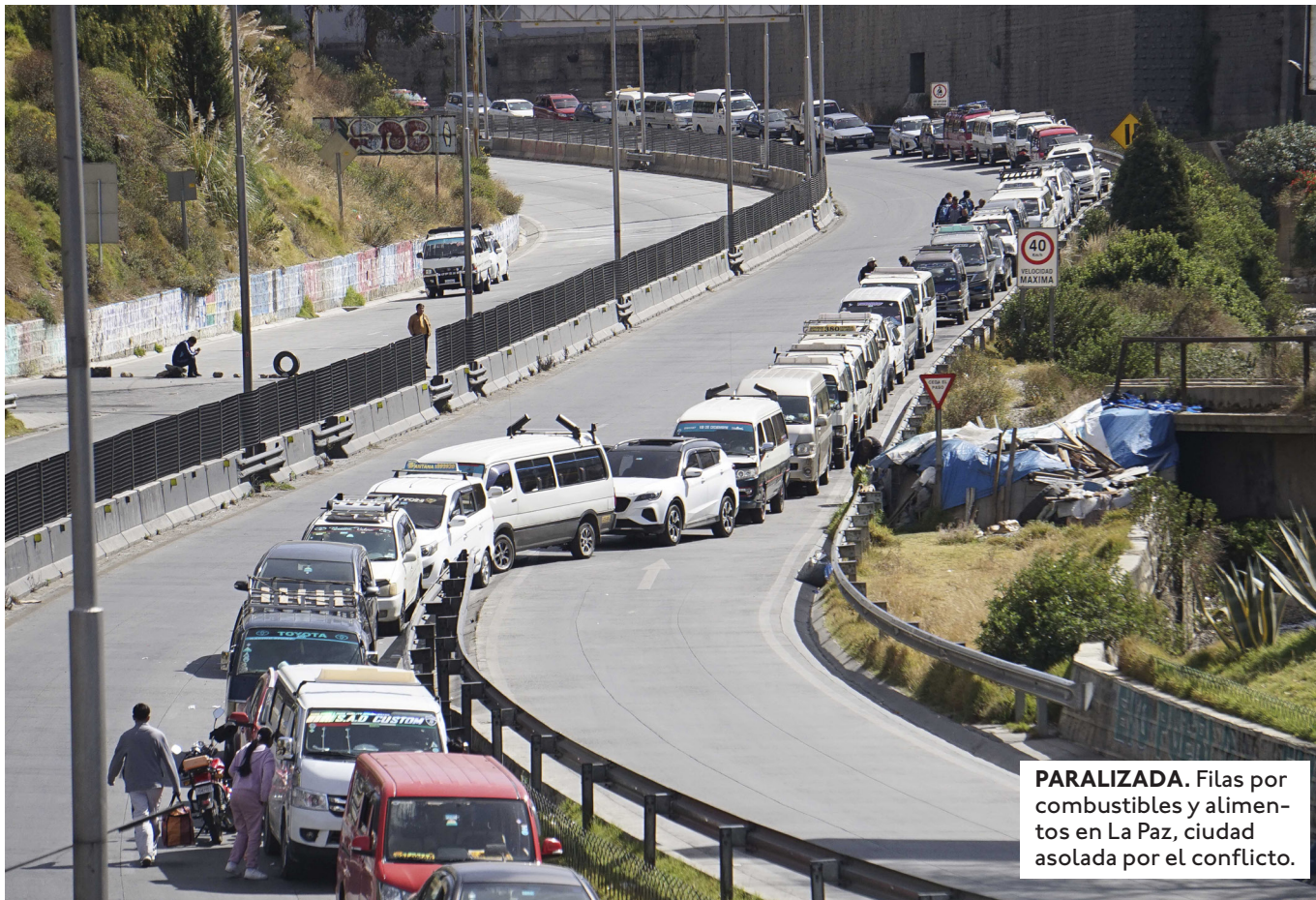
PARALIZADA. Filas por combustibles y alimentos en La Paz, ciudad asolada por el conflicto.