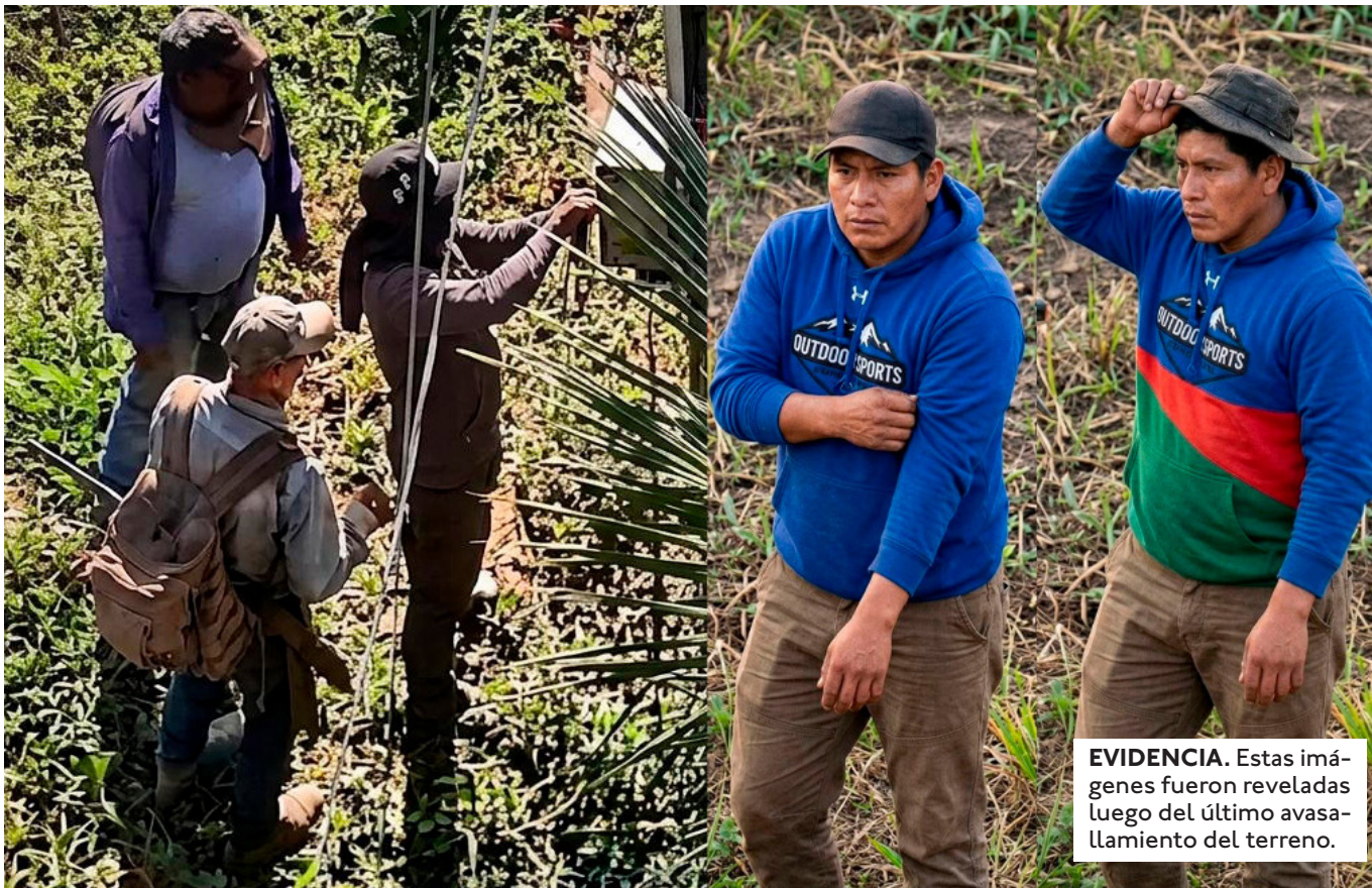
EVIDENCIA. Estas imágenes fueron reveladas luego del último avasallamiento del terreno.