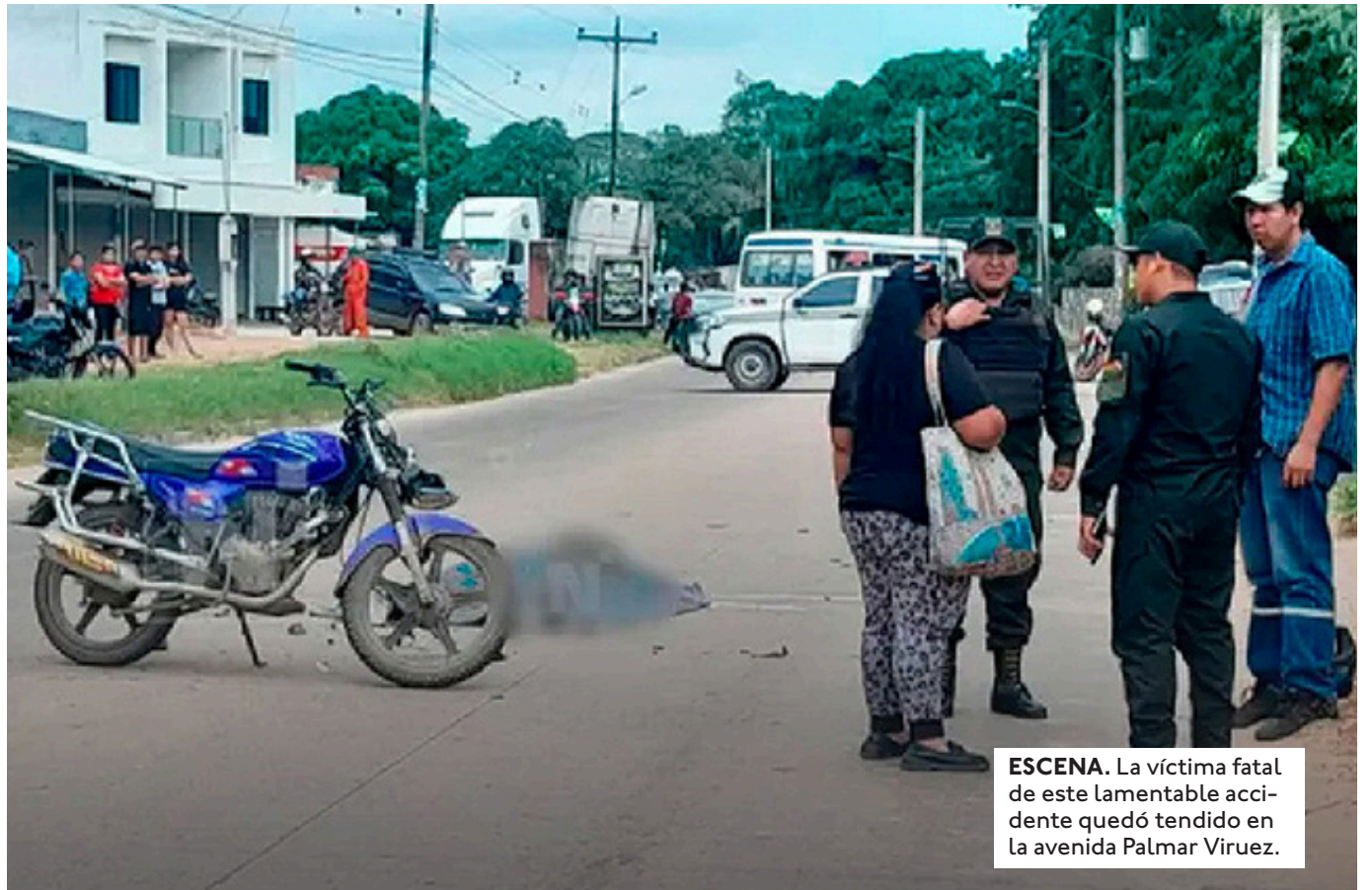
ESCENA. La víctima fatal de este lamentable accidente quedó tendido en la avenida Palmar Viruez.

LOS PADRES DE FAMILIA DEL COLEGIO ZENOBIA APONTE, QUE ESTÁ CERCA DEL LUGAR DE HECHO, PIDIERON LA INSTALACIÓN DE UN SEMÁFORO Y ROMPEMUELLES.