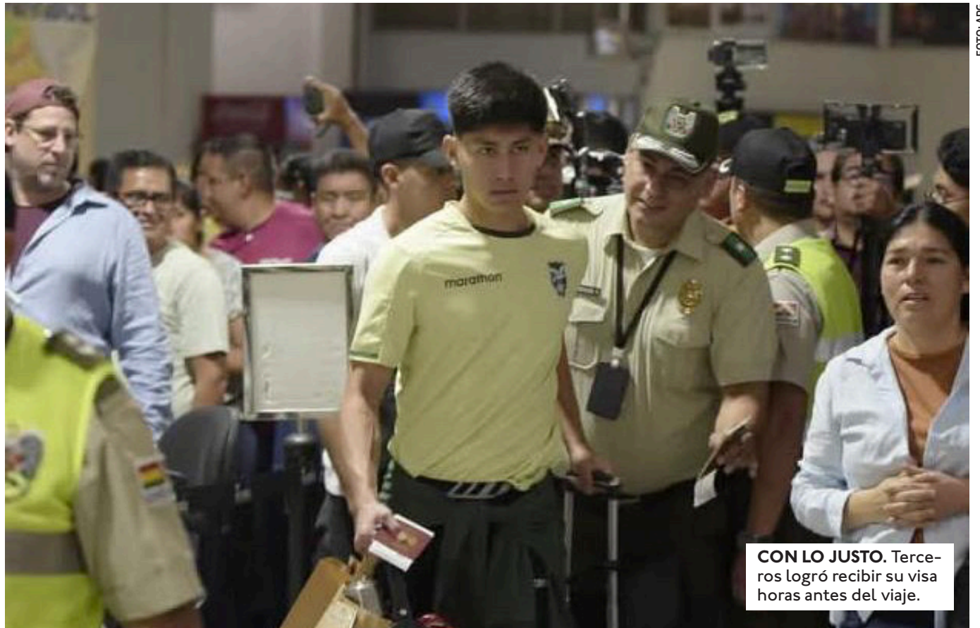
CON LO JUSTO. Terceros logró recibir su visa horas antes del viaje.

"TODAVÍA SIGUE DOLIENDO LO QUE PASÓ EN EL REPECHAJE", INDICÓ EL PORTERO, SOBRE LA DERROTA ANTE IRAK QUE IMPIDIÓ IR AL MUNDIAL.