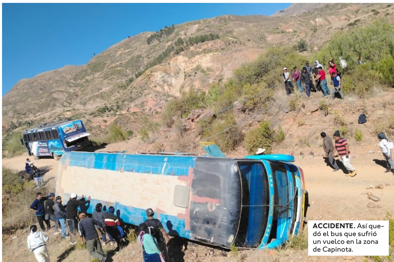
ACCIDENTE. Así quedó el bus que sufrió un vuelco en la zona de Capinota.

"ME CONTÓ QUE INCLUSO ROGÓ Y SUPPLICÓ A LOS BLOQUEADORES PARA QUE LO DEJARAN PASAR", SEÑALÓ LA MUJER DEL CHOFRER FALLECIDO.