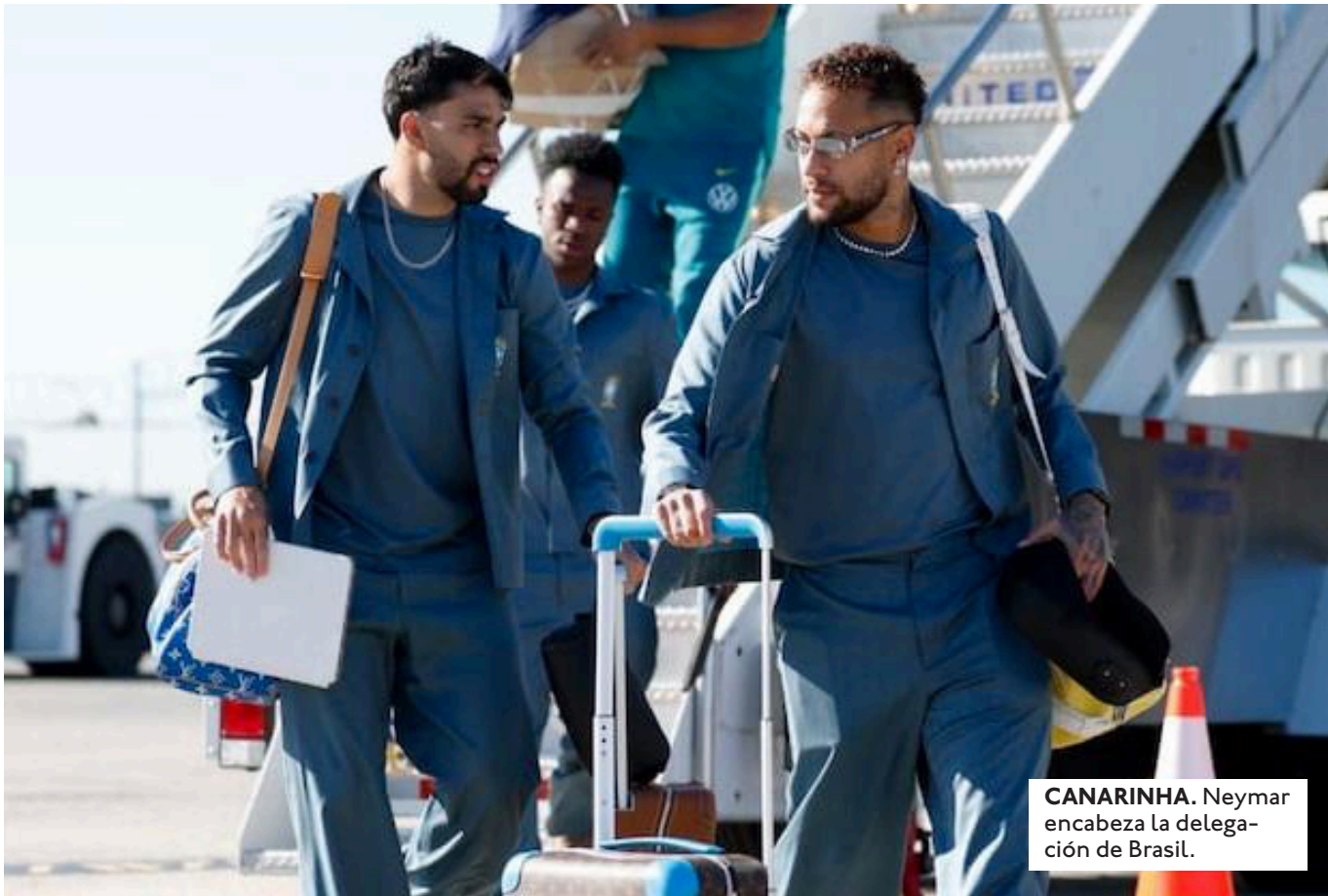
CANARINHA. Neymar encabeza la delegación de Brasil.

EL PRÓXIMO SÁBADO (18:00, HB) DISPUTARÁ UN AMISTOSO FRENTE A EGIPTO, SU ÚLTIMO ENSAYO ANTES DEL DEBUT MUNDIALISTA.