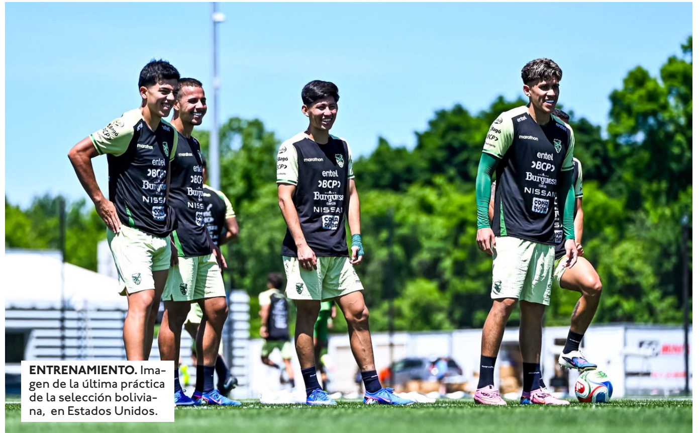
ENTRENAMIENTO. Imagen de la última práctica de la selección boliviana, en Estados Unidos.

EL ÁRBITRO CLÉMENT TURPIN (FRANCIA) FUE NOMI- NADO PARA ESTE JUEGO. A CARGO DEL VAR ESTARÁ JÉRÔME BRI- SARD.