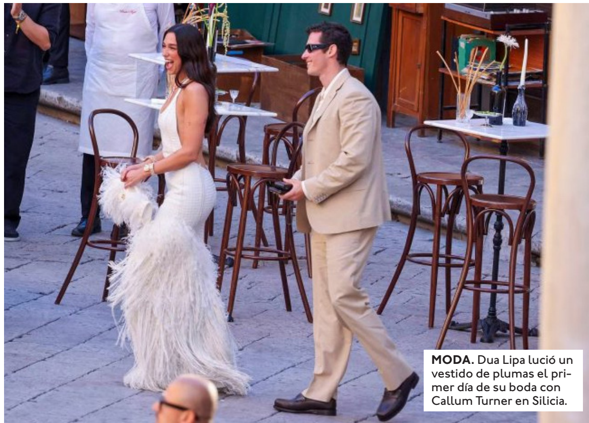
MODA. Dua Lipa lució un vestido de plumas el primer día de su boda con Callum Turner en Sicilia.

Los reportes de la prensa especializada describen escenas de evidente tensión en las inmediaciones del complejo histórico. Residentes de los municipios sicilianos colindantes han manifestado su indignación ante lo que consideran un trato preferencial desmedido hacia las celebridades de Hollywood, acusando a