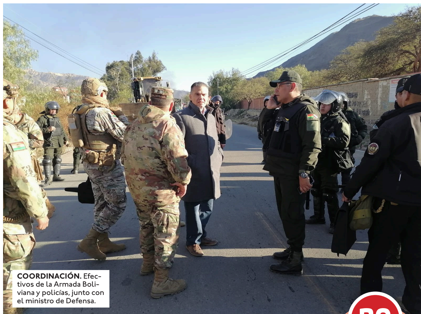
COORDINACIÓN. Efectivos de la Armada Boliviana y policías, junto con el ministro de Defensa.