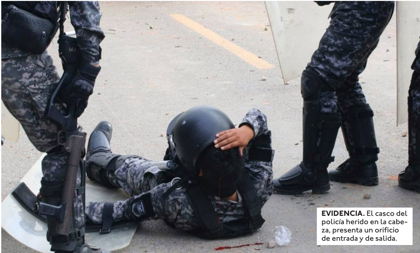
EVIDENCIA. El casco del policía herido en la cabeza, presenta un orificio de entrada y de salida.

EL MINISTRO DE ECONOMÍA, JOSÉ GABRIEL ESPINOZA, CONFIRMÓ QUE YA ESTÁ IDENTIFICADO EL AUTOR QUE DISPARÓ E HIRIÓ A UN POLICÍA EN SAN JULIÁN.