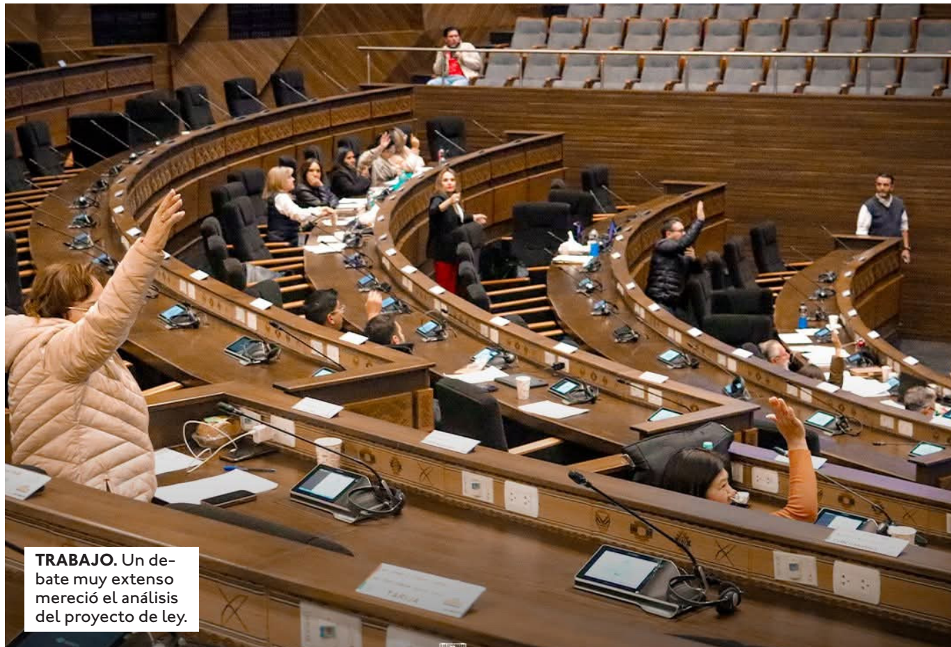
TRABAJO. Un debate muy extenso mereció el análisis del proyecto de ley.