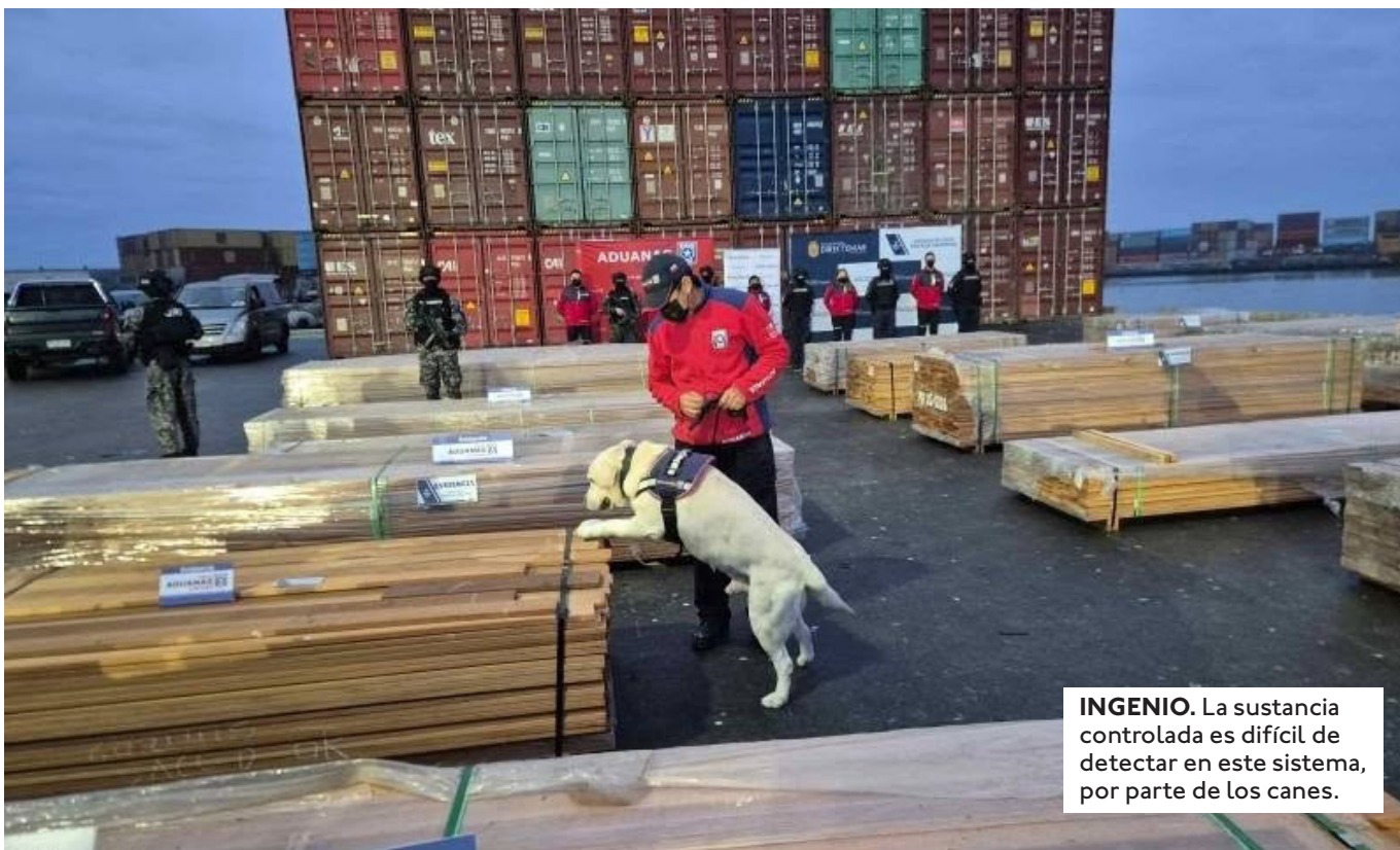
INGENIO. La sustancia controlada es difícil de detectar en este sistema, por parte de los canes.

EL EXPRESIDENTE ESCRIBIÓ ESE MENSAJE EN X. ADEMÁS INDICÓ QUE FALTA COMIDA EN LAS CIUDADES PERO "CAMIONES CON NARCOTADORA SE MUEVEN A SUS ANCHAS".