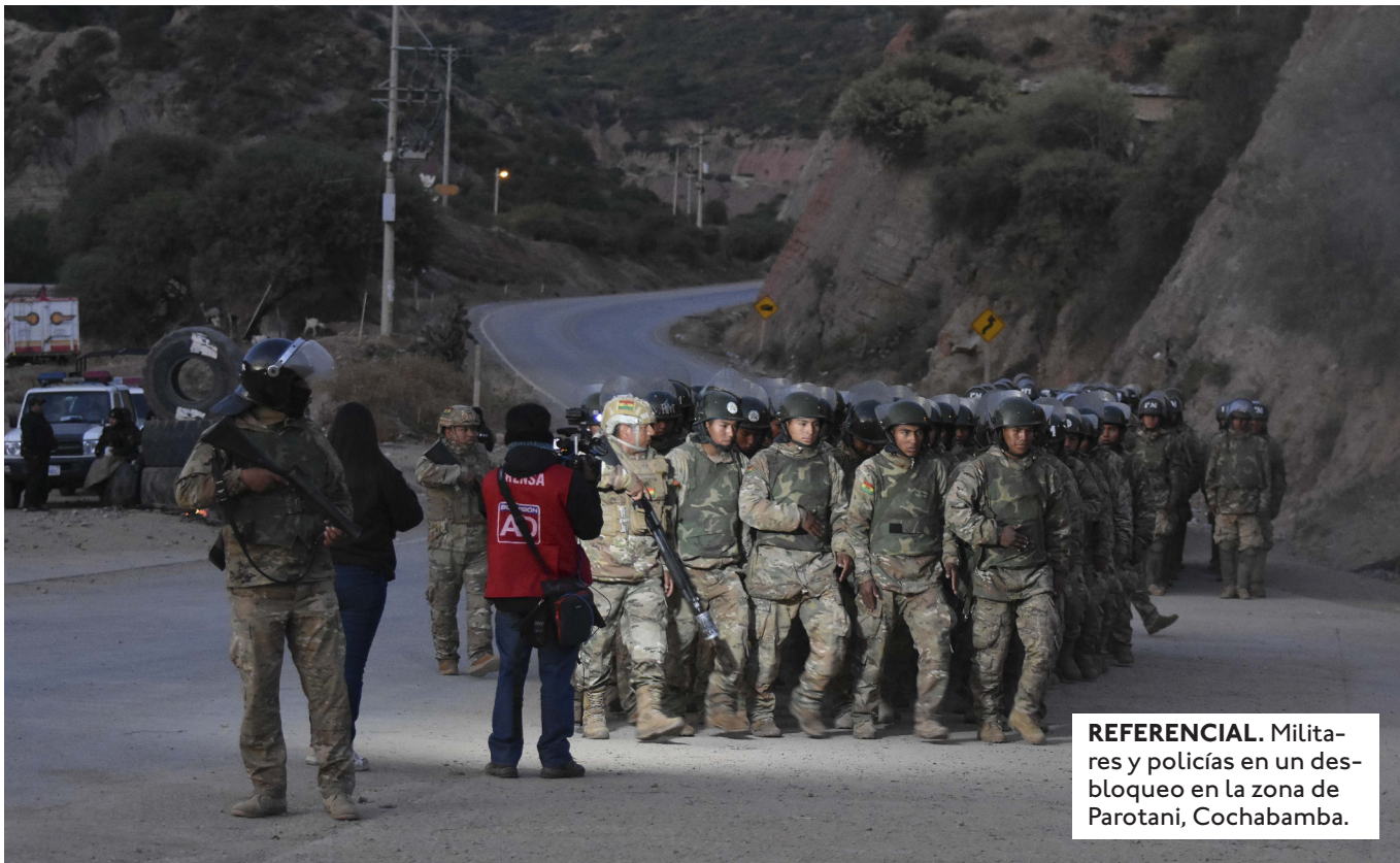
REFERENCIAL. Militares y policías en un desbloqueo en la zona de Parotani, Cochabamba.

AYER A SE REPORTÓ LA LLEGADA DE DECENAS DE PERSONAS DESDE EL NORTE DE POTOSÍ Y LA PROVINCIA CARRASCO DE COCHABAMBA PARA APOYAR LAS PROTESTAS CONTRA EL GOBIERNO.