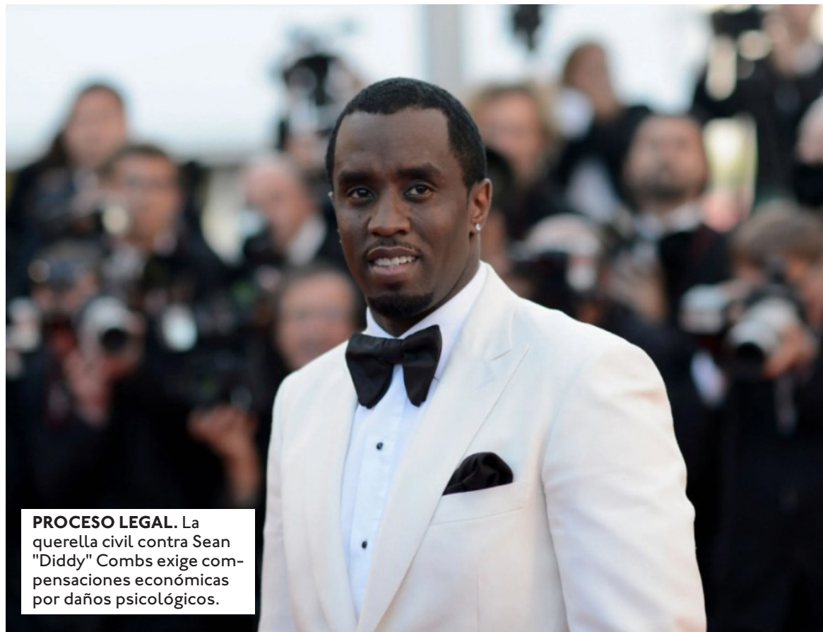
PROCESO LEGAL. La querrela civil contra Sean "Diddy" Combs exige compensaciones económicas por daños psicológicos.

La querrela detalla que el incidente principal se registró hace casi dos décadas, un periodo en el cual el demandante se vio cohibido de denunciar de manera inmediata debido al profundo temor a las represalias profesionales en Hollywood y al enorme impacto psicológico del suceso. El equipo legal del ex-actor infantil argumenta que se han acogido a las legislaciones y ventanas jurídi-