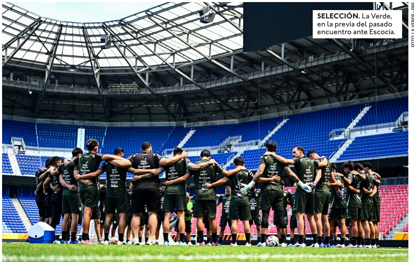
SELECCIÓN. La Verde, en la previa del pasado encuentro ante Escocia.

combinado africano, interesado en evitar cualquier exposición pública antes de su estreno en el torneo. La falta de acceso para el público y los medios también explica que el encuentro no aparezca en la programación oficial de la fecha FIFA de junio publicada por la FIFA. Incluso hasta este martes no existía una confirmación oficial sobre el escenario ni el horario del compromiso, aunque distintas versiones señalan que comenzará a las 20:00 (hora boliviana). Sobre la situación, Villegas expresó que le hubiera gustado contar con imágenes del encuentro para realizar posteriores análisis.