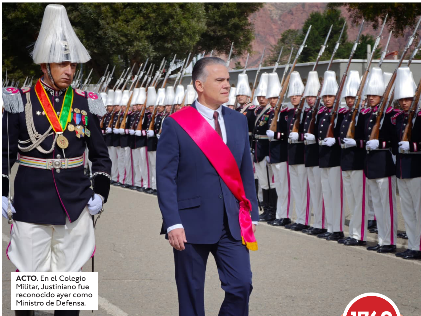
ACTO. En el Colegio Militar, Justiniano fue reconocido ayer como Ministro de Defensa.

¿Dictarán Estado de excepción? Hasta ayer no había indicios de que el gobierno asuma de inmediato la decisión de dictar